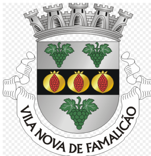
Imagem 1: Enquadramento territorial de Vila nova de Famalicão e Brasão do concelho; Fonte: Wikipedia

O presente relatório tem como objetivo dar cumprimento ao Regulamento n.º 430/2019, publicado no Diário da República, 2.ª série, n.º 94, de 16 de maio de 2019, na sua versão mais atualizada, e ao Regulamento (CE) n.º 1370/2007, do Parlamento Europeu e do Conselho, de 23 de outubro de 2007.