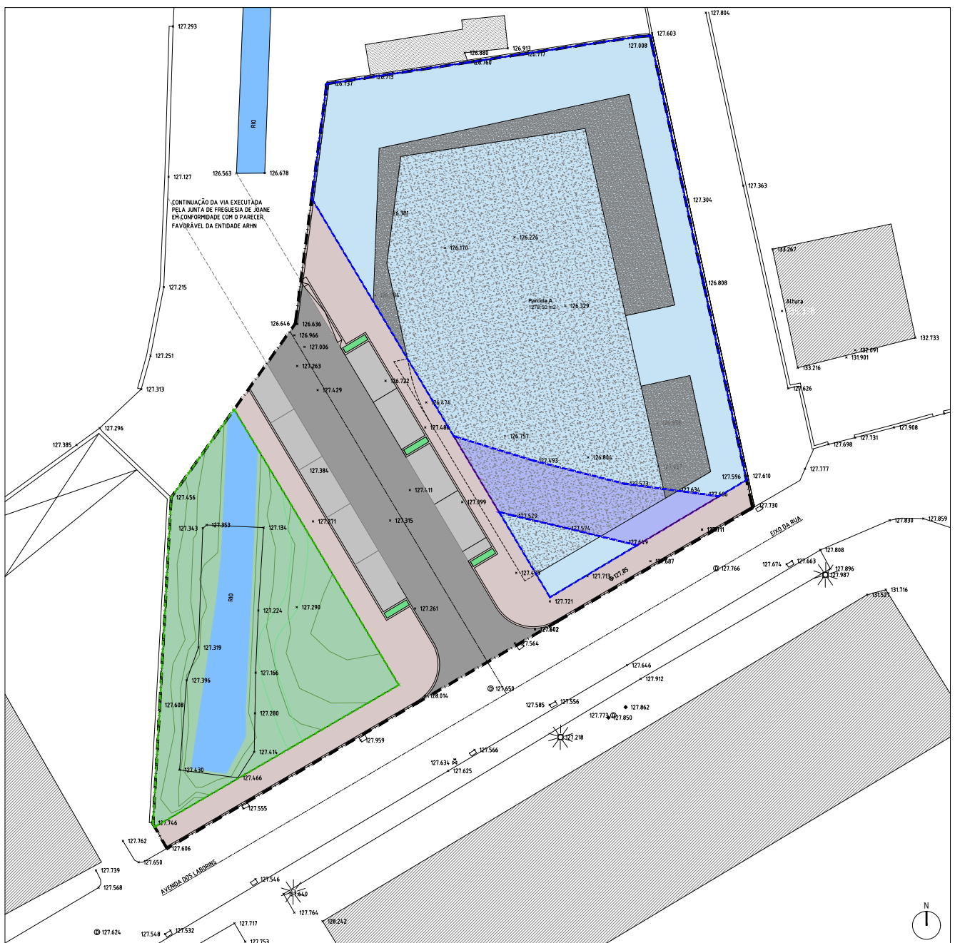
Programa/Solução Urbanística / Áreas de cedência

Deve ser dotado das infraestruturas de Abastecimento de Água, de Sistemas de Drenagem de Águas Residuais e Águas Pluviais, de Infraestruturas Elétricas e de Gás e Telecomunicações.