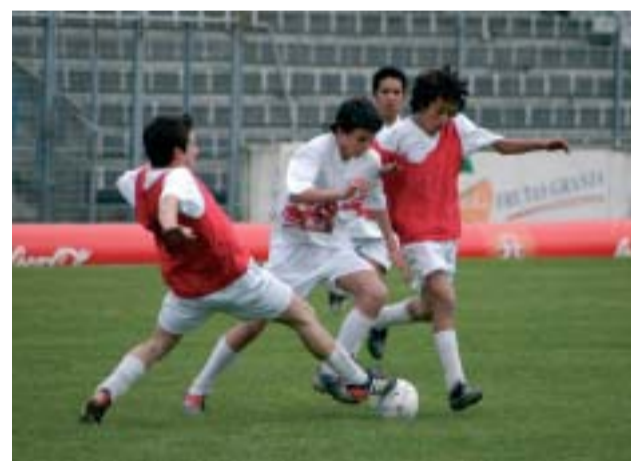
DESPORTO Euro Taça Coca-Cola