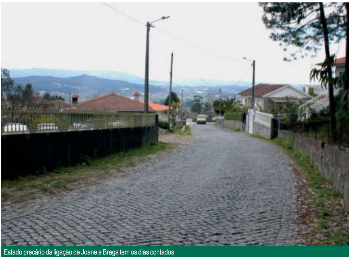
Estado precário da ligação de Joane a Braga tem os dias contados

AMBIENTE Entretanto, a Câmara Municipal de Vila Nova de