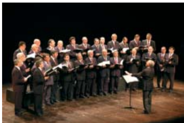
Concerto coral pelo Orfeão Famalicense