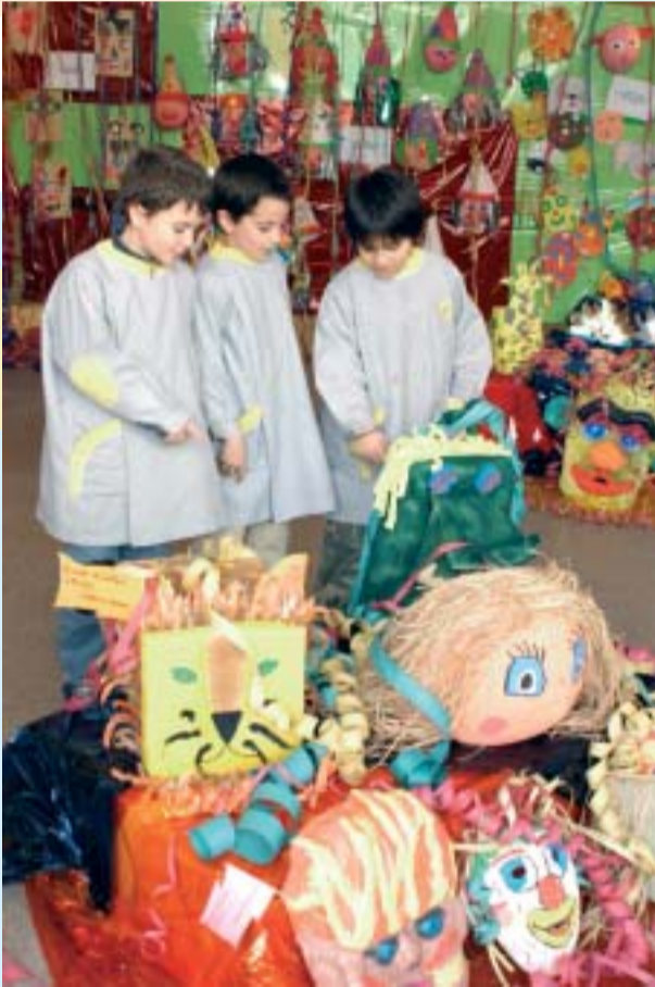
18.02.2004 Crianças visitam exposição de Máscaras de Carnaval, organizada pelo pelouro da Educação