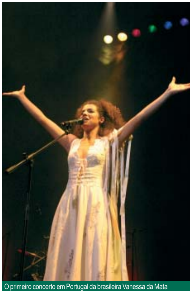
O primeiro concerto em Portugal da brasileira Vanessa da Mata