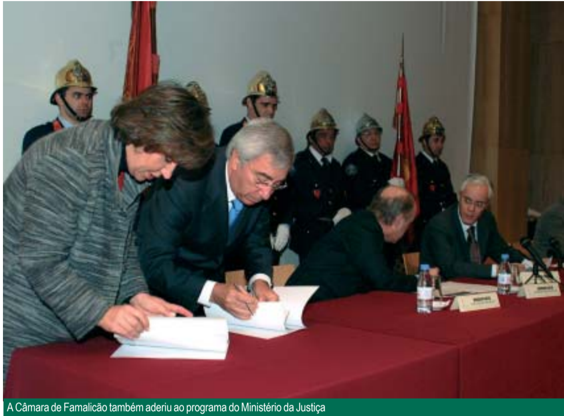
A Câmara de Famalicão também aderiu ao programa do Ministério da Justiça

“A aplicação de um novo paradigma de sanções penais para as penas de prisão não superiores a um ano, é uma medida que importa reforçar cada vez mais, não só porque pode atenuar as