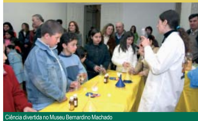
Ciência divertida no Museu Bernardino Machado

ACOMPANHADAS DAS respectivas famílias, mais de uma centena de crianças passaram, no dia 28 de Março, um domingo diferente no Museu Bernardino Machado ao participarem na realização de experiências simples, bem demonstrativas de que muitas das coisas com que lidamos todos os dias têm uma base científica. Esta foi a forma que a Câmara Municipal encontrou para divulgar junto das gerações mais novas a faceta científica de Bernardino Machado, no dia em que se assinalaram os 153 anos do seu nascimento, promovendo uma crescente curiosidade por uma das mais notáveis figuras famalicenses. Com a realização da iniciativa, que encantou tanto os mais novos como os familiares, pretendeu-se também transformar o espaço museológico, normalmente tido como fechado e estático, num local aberto, de animação e divertimento.