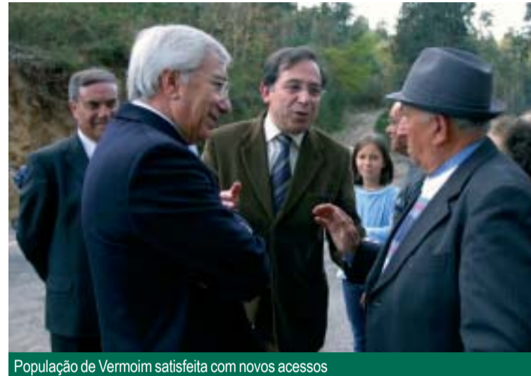
População de Vermoim satisfeita com novos acessos

Naturalmente satisfeito, estava também o presidente da Câmara Municipal, “por mais esta efectiva resposta autárquica a uma