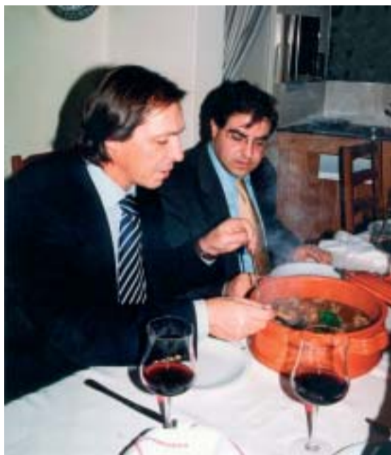
O ex-futebolista Fernando Gomes não resistiu ao arroz de cabidela