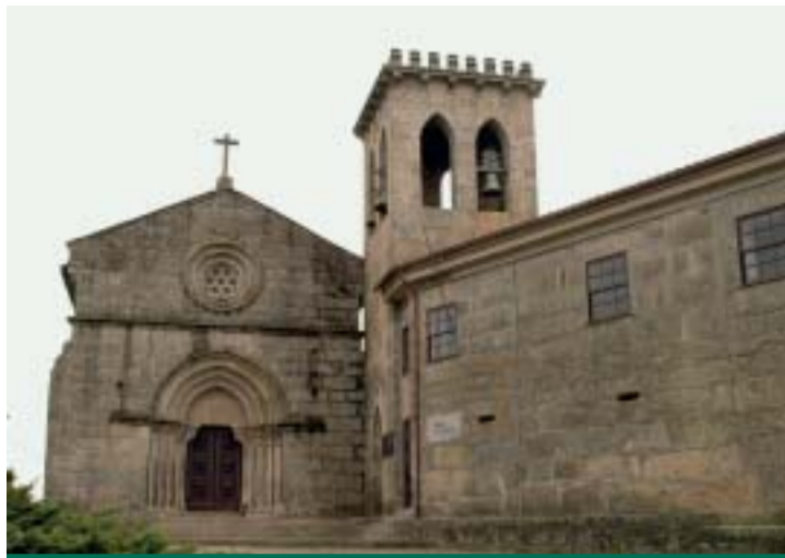
Igreja Românica de S. Tiago de Antas