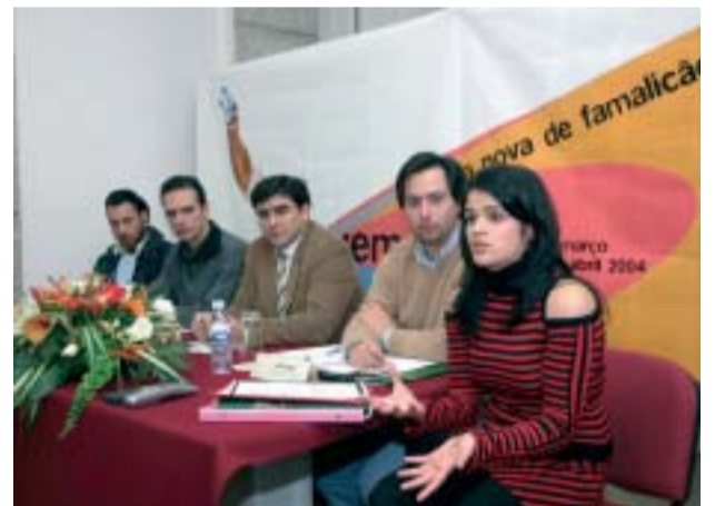
JORNADAS MUNICIPAIS DA JUVENTUDE Associativismo e Voluntariado