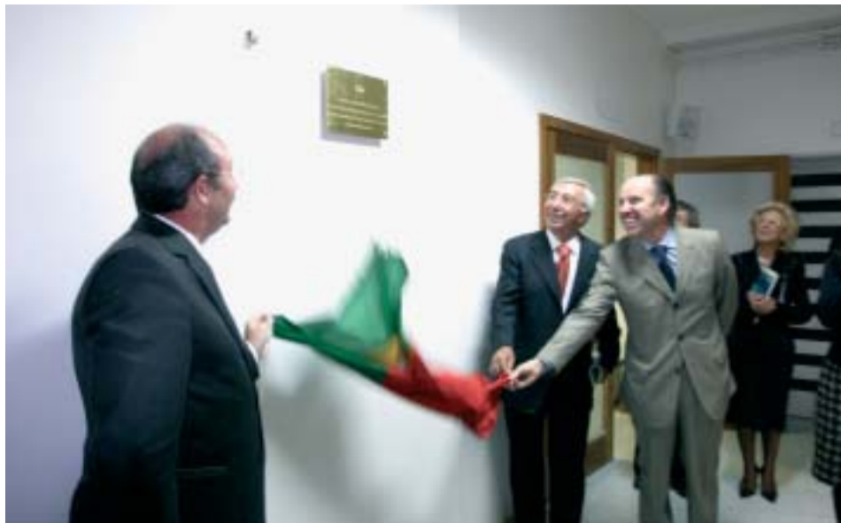
Inauguração do bloco de partos do Hospital S. João de Deus, SA