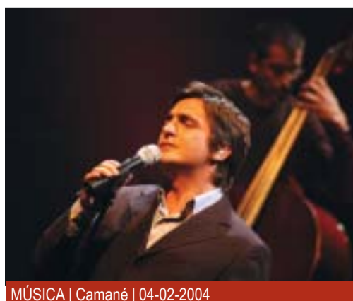
MÚSICA | Camané | 04-02-2004