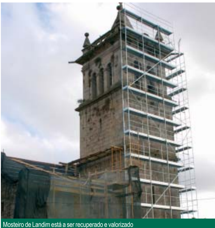
Mosteiro de Landim está a ser recuperado e valorizado

PRIMEIRAS DUAS FASES PRONTAS DENTRO DE MEIO ANO