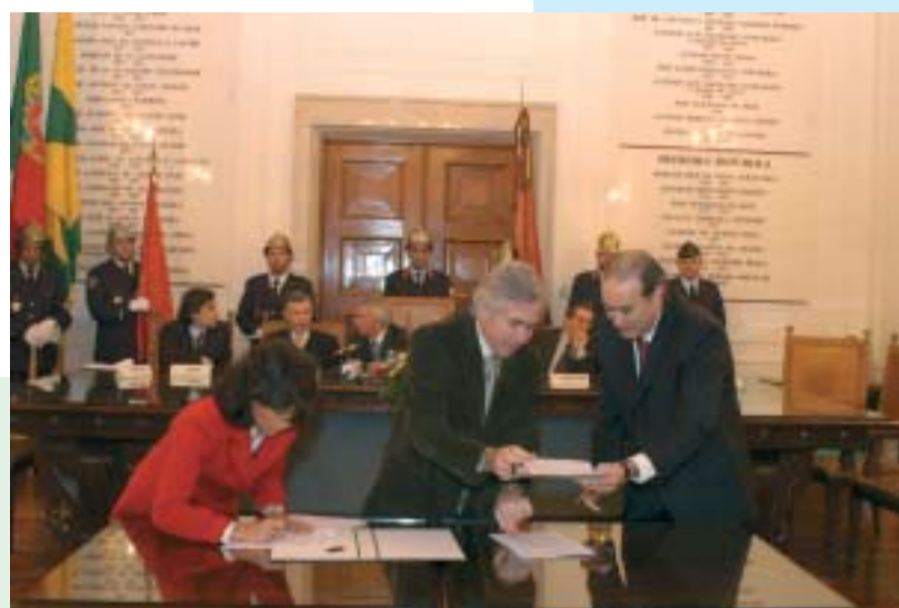
01.02.2004 Assinatura de protocolo entre o Ministério das Cidades, Ordenamento do Território e Ambiente e a Associação Cultural, Recreativa e Social de Ribeirão, para a construção do Pavilhão Gimnodesportivo de Ribeirão