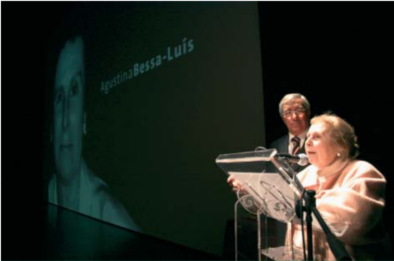
Agustina Bessa-Luís presidiu ao júri internacional do Famafest' 2004