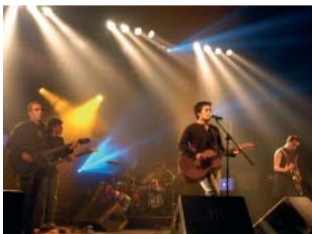
MÚSICA EZ Special