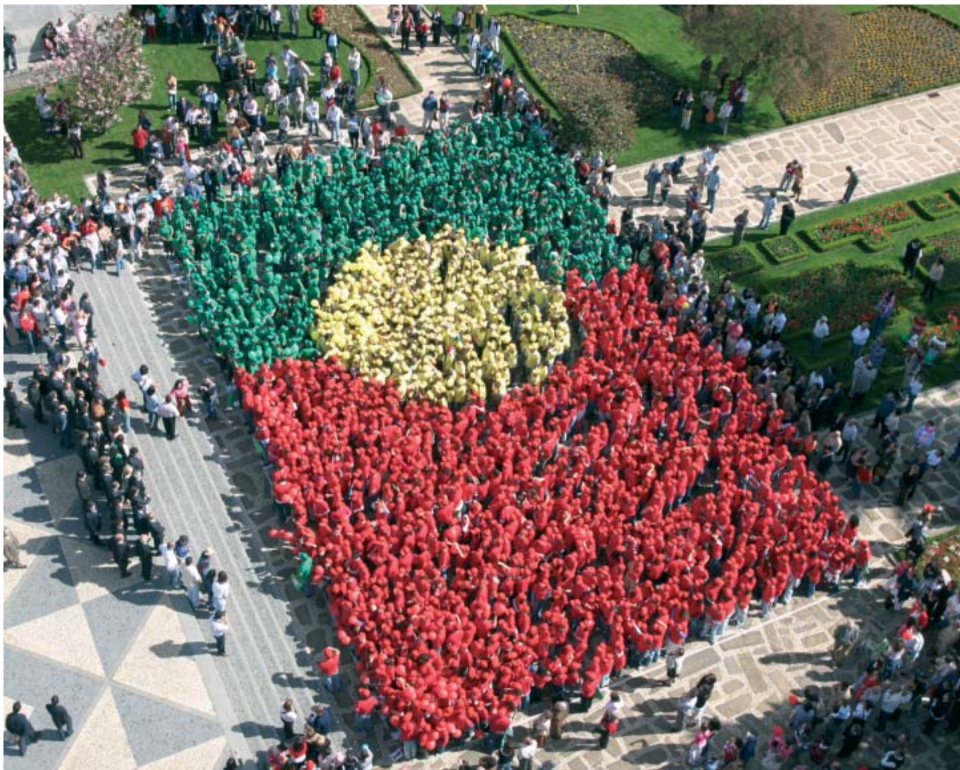
Um espectáculo inédito em Vila Nova de Famalicão