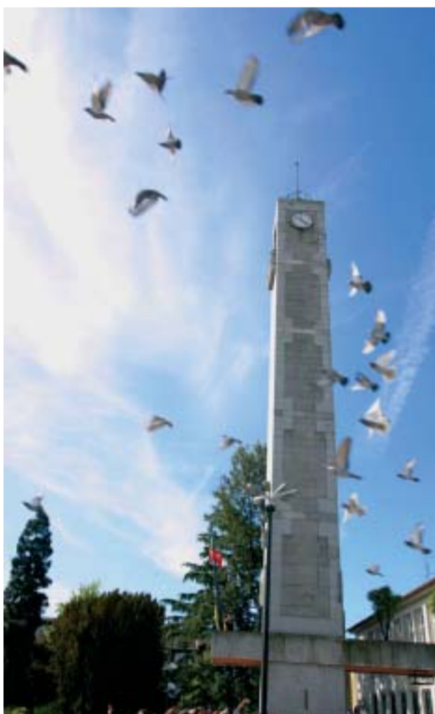
Largada de pombos