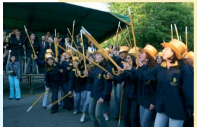
28.04.2004 Alunos da Escola Superior de Saúde do Vale do Ave durante o Cortejo Académico 2004