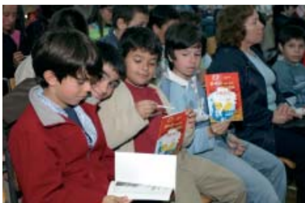
Apresentação do livro "O ano em que nasceu Abril"