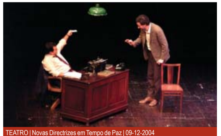
TEATRO | Novas Directrizes em Tempo de Paz | 09-12-2004