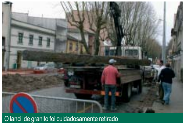
O lancil de granito foi cuidadosamente retirado

Há pedras que pela sua utilização ou pelos lugares onde se encontram estão profundamente ligadas à nossa história, seja como povo ou como nação. Dos marcos miliários e outras construções românicas, aos templos e monumentos que permanentemente nos ligam a épocas e acontecimentos nos quais assentam os pilares civilizacionais. Outras têm um alcance bem mais modesto, mas igualmente digno, e se há peças cujo valor resulta do conjunto onde se inserem, outras há que valem por si sós e pelo carácter peculiar dos episódios que as envolvem.