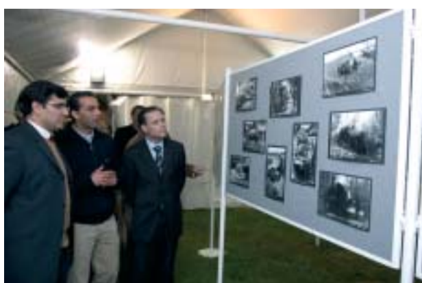
Exposição "Memórias de uma Guerra", em Ceide S. Miguel