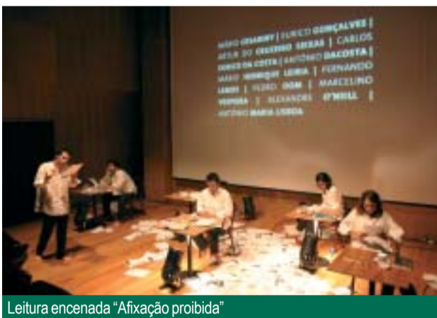
Leitura encenada "Afixação proibida"