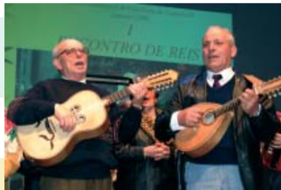
08.01.2004 I Encontro de Reis Sénior, na Casa das Artes