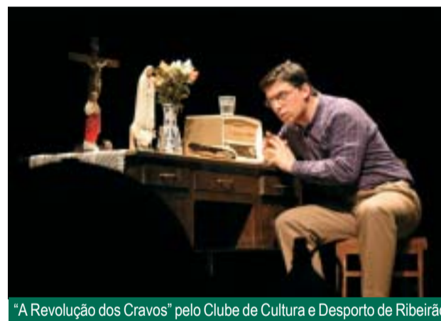
"A Revolução dos Cravos" pelo Clube de Cultura e Desporto de Ribeirão