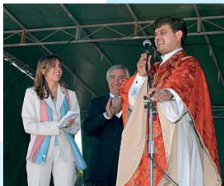
30.05.2004 Festa do 10º Aniversário da Associação de Desenvolvimento Local – Engenho