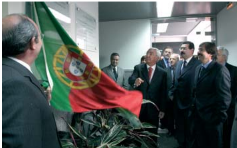
Nova unidade de internamento em Riba de Ave