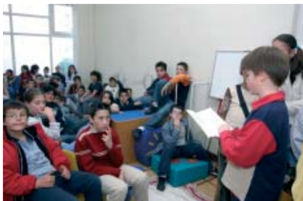
Atelier "Palavras com Asas"