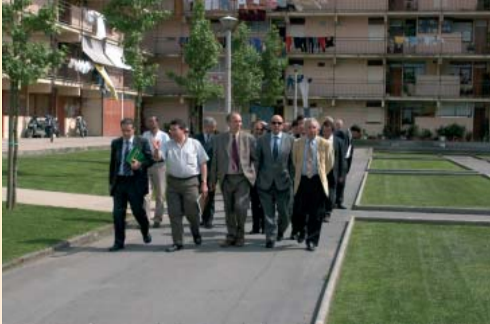
20.05.2004 Visita à Urbanização das Lameiras para apresentação do plano de reabilitação da sua zona envolvente