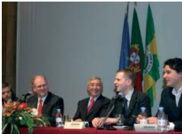
CONFERÊNCIA União Europeia - Que futuro?

“Vila Nova de Famalicão orgulha-se de ser um dos municípios mais jovens do país e da Europa. Este capital humano é, sem dúvida, um dos nossos maiores trunfos, numa era globalizante e competitiva que estamos a viver.”