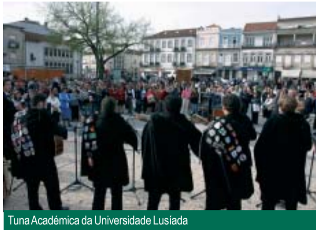
Tuna Académica da Universidade Lusíada