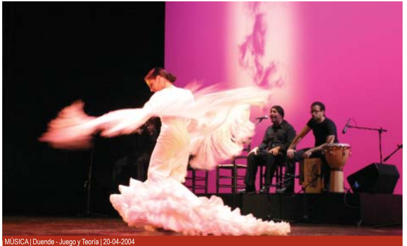
MÚSICA | Duende - Juego y Teoría | 20-04-2004