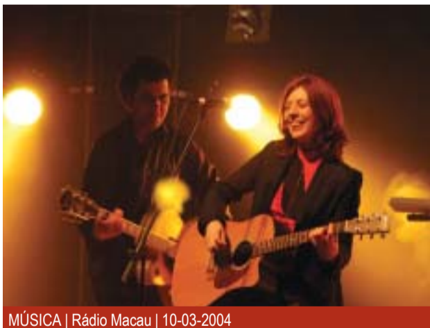
MÚSICA | Rádio Macau | 10-03-2004