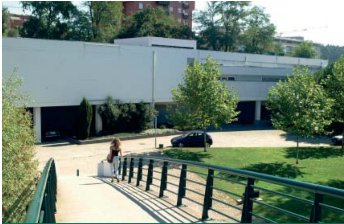
Biblioteca Municipal Camilo Castelo Branco

NÚMEROS Só durante o ano de 2003, o município emprestou 33.538 livros e recursos audiovisuais, tais como vídeos, CD e DVD. Perto de 5.300 crianças estiveram envolvidas em activi-