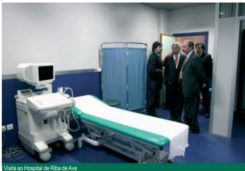
Visita ao Hospital de Riba de Ave