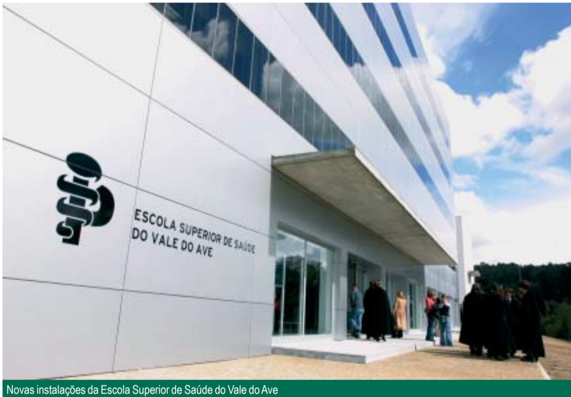
Novas instalações da Escola Superior de Saúde do Vale do Ave

“A partir de agora, Vila Nova de Famalicão tem a certeza que as novas gerações terão na sua terra uma escola de qualidade para a sua formação superior nas mais diversas especialidades da saúde”, declarou Armindo Costa na sessão solene de inauguração da nova escola superior, no passado dia 12 de Março, numa cerimónia que contou com a presença de diversas personalidades ligadas à educação e à saúde, como a ministra da Ciência e do Ensino Superior, Graça Carvalho, o secretário de Estado Adjunto do ministro da Saúde, Adão Silva, o presidente da CESPU, Almeida Dias, entre outros.