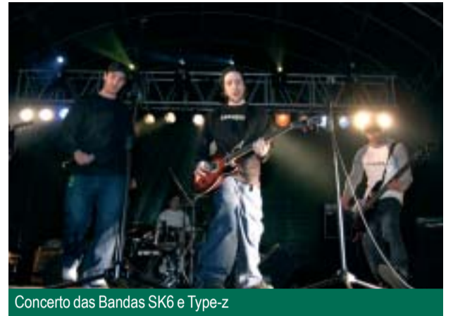
Concerto das Bandas SK6 e Type-z