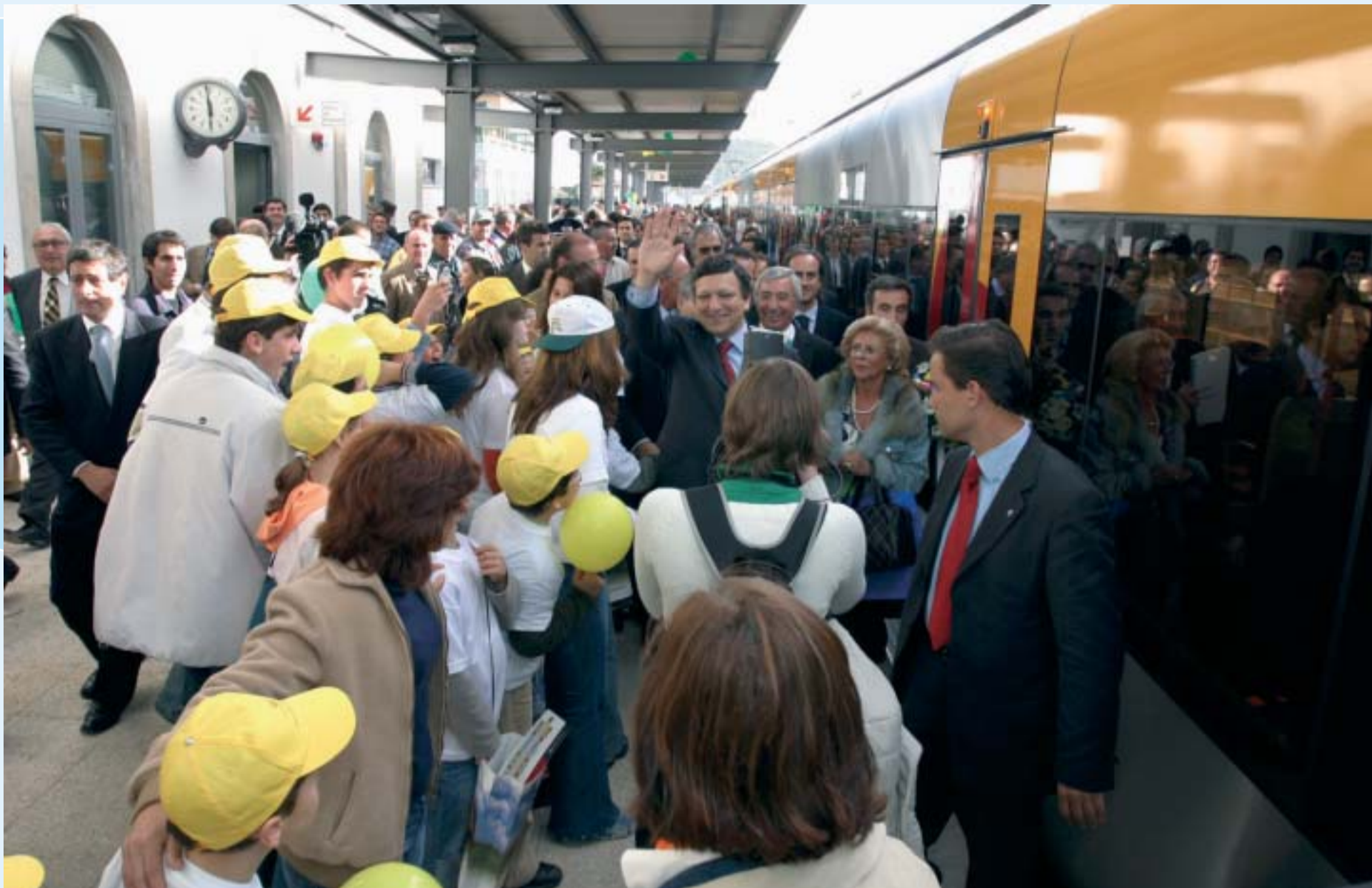
Uma multidão recebeu Durão Barroso e Armindo Costa nas Estações de Nine e Vila Nova de Famalicão