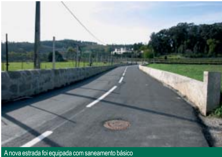
A nova estrada foi equipada com saneamento básico

O caminho municipal 1504 tem uma extensão de 1900 metros e liga a Estrada Municipal 206 (Famalicão-Guimarães) à Rua de Vinho, passando pelas avenidas do Palácio e Casal. A intervenção efectuada incluiu o alargamento do traçado, a consequente reconstrução de muros e a colocação da rede de saneamento básico, mediante protocolos entre a Câmara Municipal e a Junta de Freguesia de Vermoim.