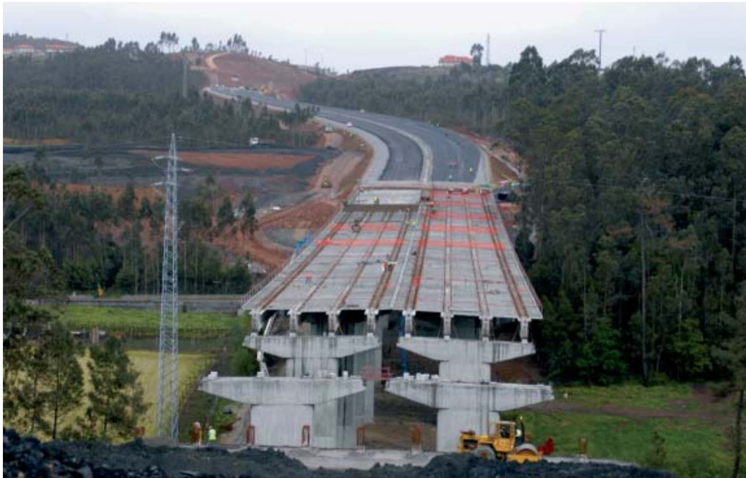
Viaduto em construção na freguesia de Vilarinho das Cambas da auto-estrada Famalicão – Póvoa de Varzim