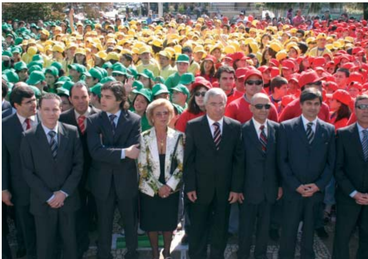
O Dia da Liberdade em Famalicão foi assinalado por várias gerações de famalicenses