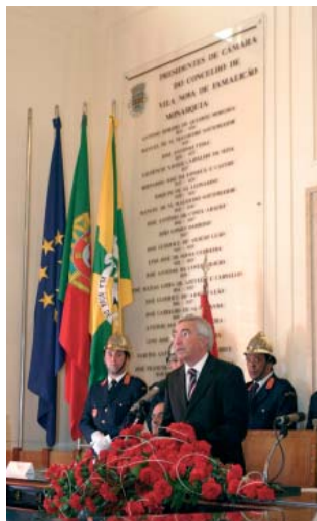
Sessão Solene da Assembleia Municipal