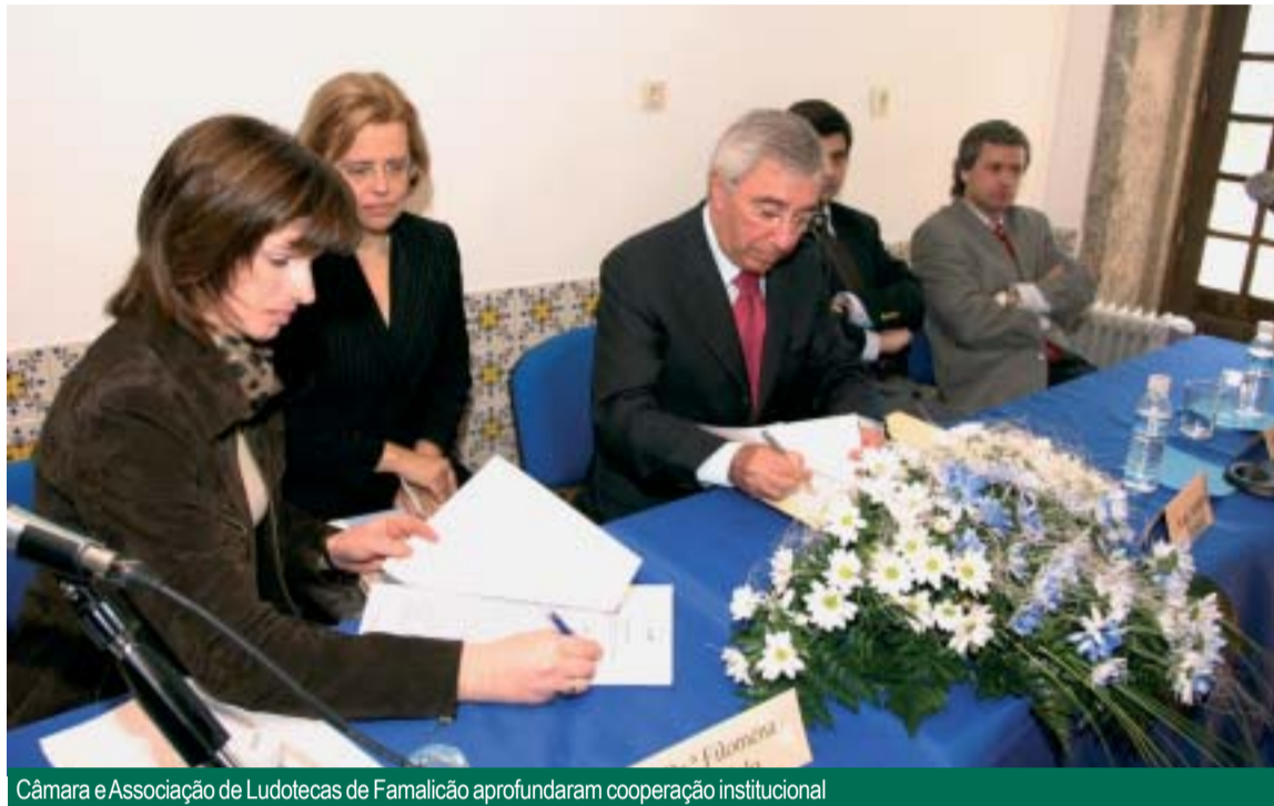
Câmara e Associação de Ludotecas de Famalicão aprofundaram cooperação institucional

CÂMARA ASSINOU CONTRATO-PROGRAMA COM ASSOCIAÇÃO DE LUDOTECAS