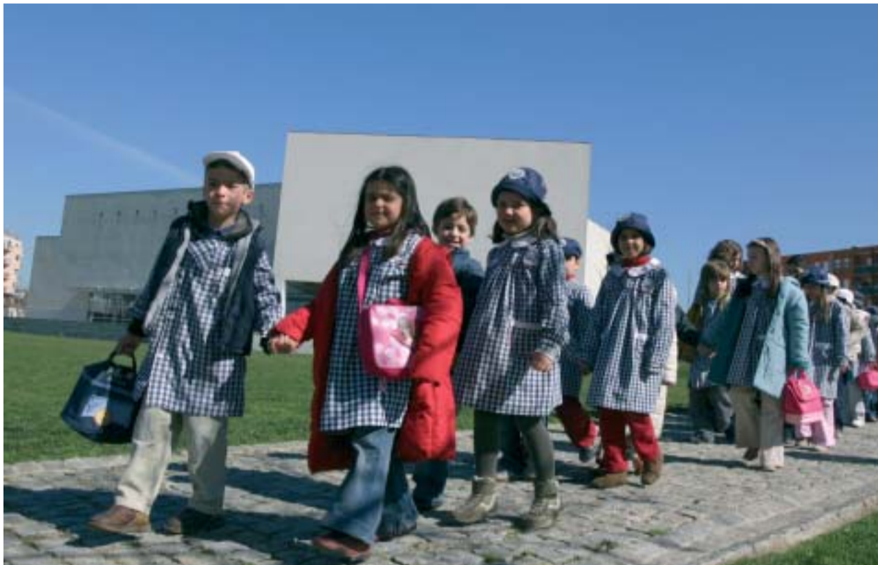
Crianças foram presença assídua nos auditórios da Casa das Artes e Biblioteca Municipal Camilo Castelo Branco