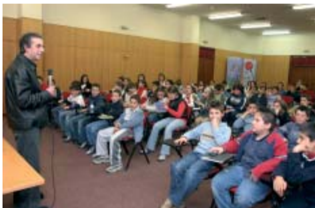
Apresentação do livro "O Rapaz da Bicicleta Azul", de Álvaro Magalhães