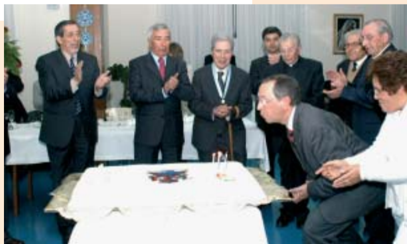
02.03.2004 O provedor da Santa Casa da Misericórdia de Vila Nova de Famalicão apaga as velas do 130º aniversário da instituição