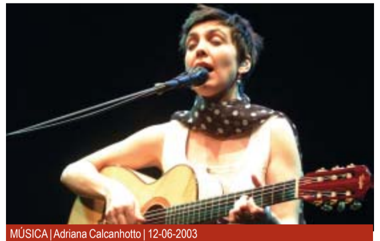
MÚSICA | Adriana Calcanhotto | 12-06-2003