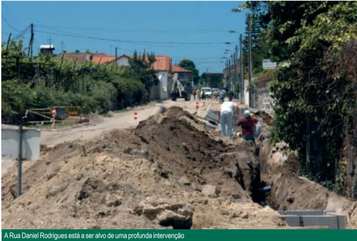
A Rua Daniel Rodrigues está a ser alvo de uma profunda intervenção

Trata-se de uma obra essencial para a melhoria das acessibilidades à cidade, tanto mais que estamos perante um dos mais importantes acessos à Estação Ferroviária de Famalicão, recentemente renovada no âmbito das obras de modernização da Linha do Minho, que implicaram a construção de um novo viaduto rodoviário sobre a Rua Queirós Moreira, artéria que surge no seguimento da Rua Daniel Rodrigues.