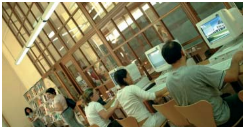
Acesso à Internet é um dos recursos mais procurados