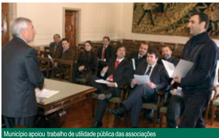
Município apoiou trabalho de utilidade pública das associações

A cerimónia, que decorreu no Salão Nobre da Câmara Municipal, juntou representantes dos clubes desportivos contemplados com os subsídios, entre os quais se encontrava também a Associação de Futebol de Salão Amador de Vila Nova de Famalicão (AFSA), que organiza o Campeonato Concelhio de Futebol de Salão Amador, congregando cerca de 30 associações concelhias.