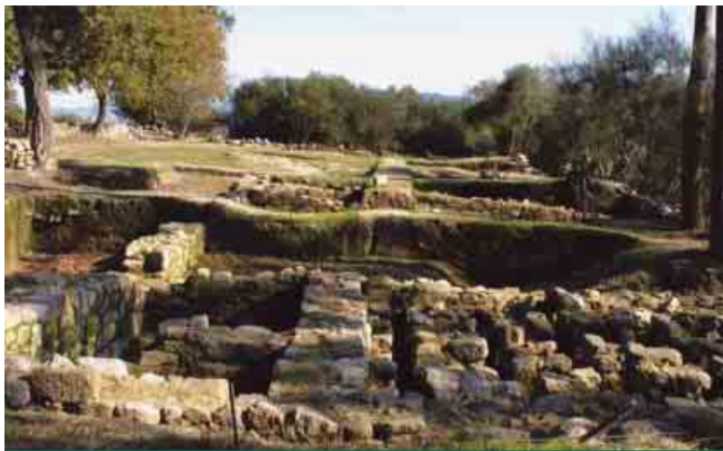
DELÃES Aquisição de terrenos do Campo Arqueológico de Perrelos