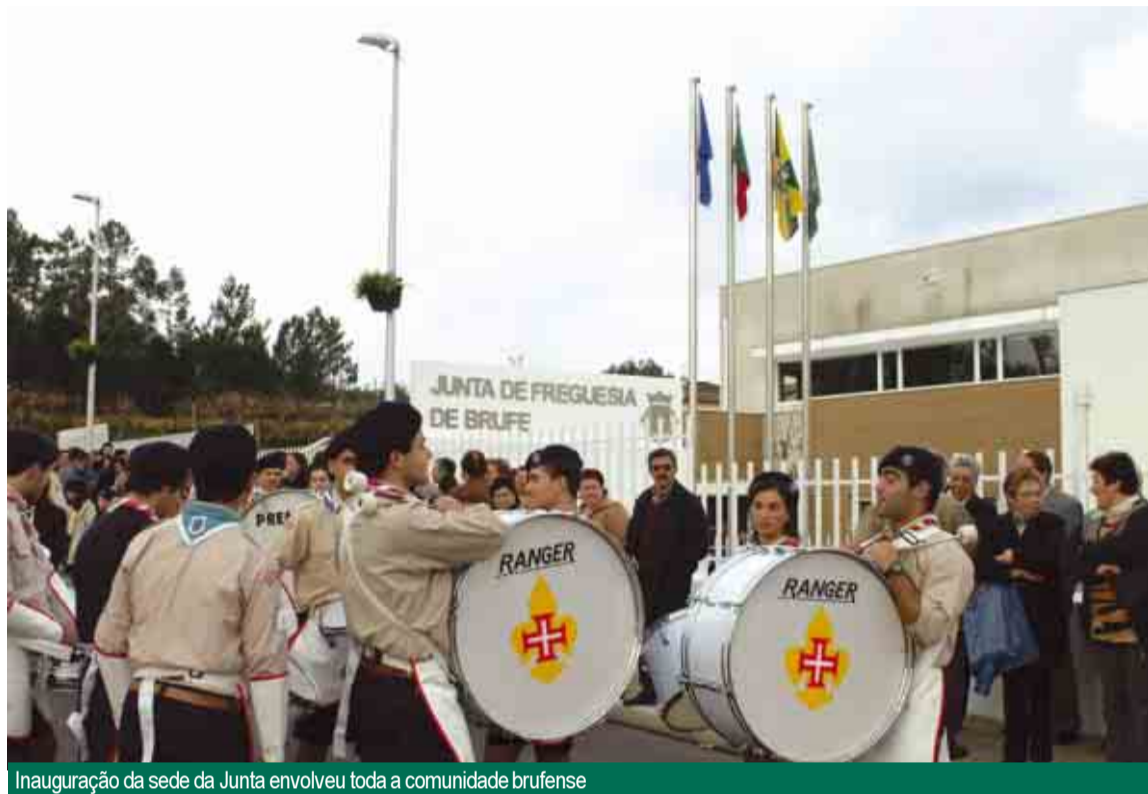
Inauguração da sede da Junta envolveu toda a comunidade brufense

POPULAÇÃO ASSOCIOU-SE À FESTA DA FREGUESIA