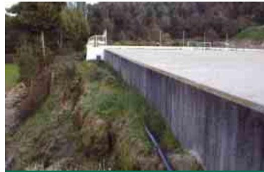
VALE SÃO COSME Reconstrução do muro de suporte ao campo de futebol