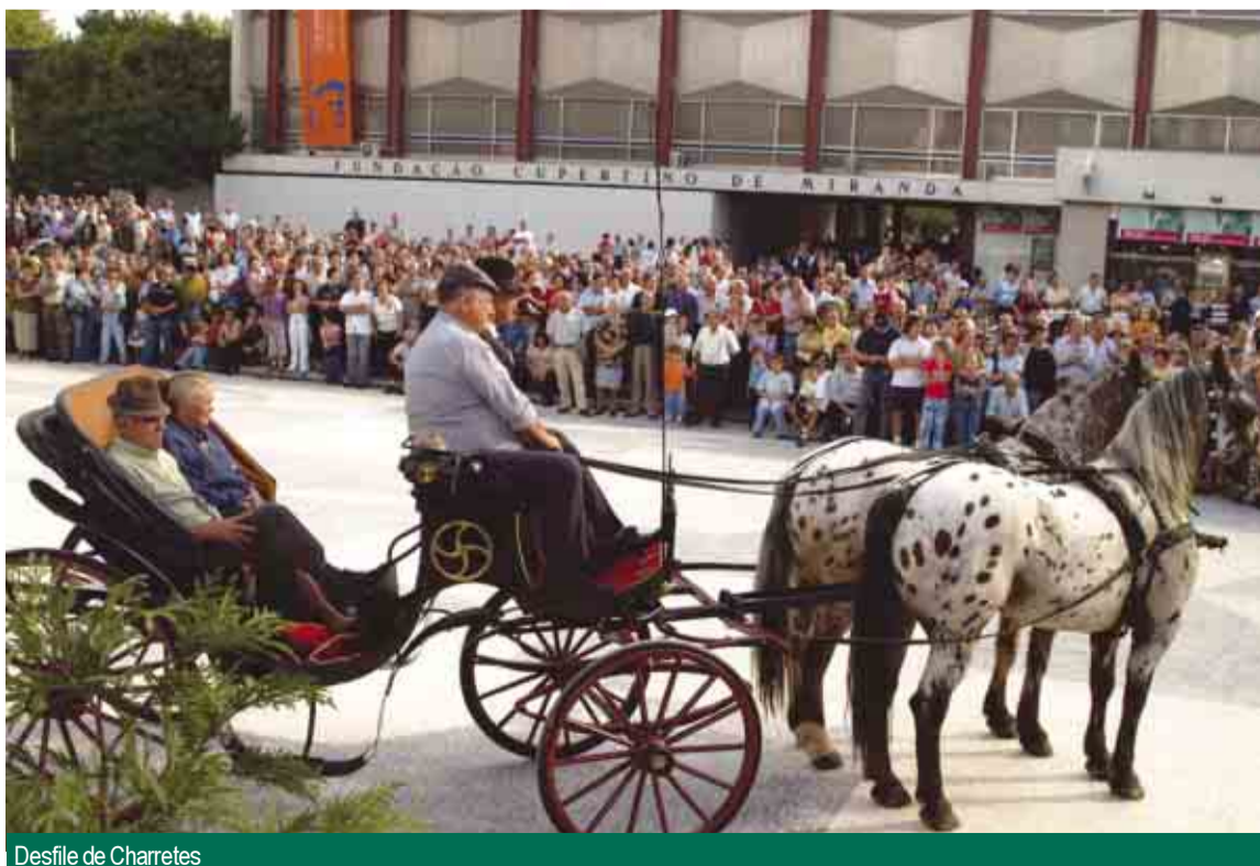
Desfile de Charretes