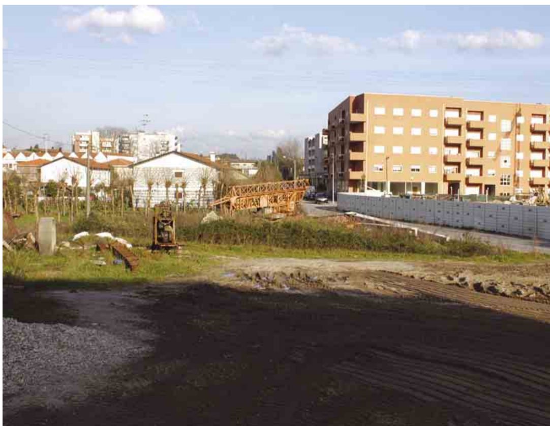
JOANE Cedência de terreno para a construção do futuro Posto da GNR