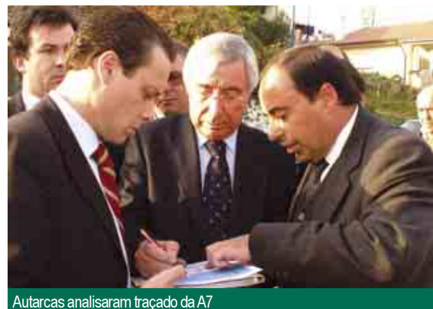
Autarcas analisaram traçado da A7