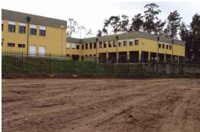
ARNOSO SANTA MARIA Terreno para o futuro jardim-de-infância