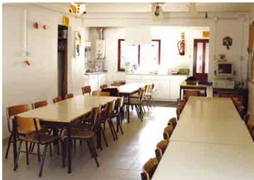
CRUZ Construção do refeitório para a Escola Básica da Boavista