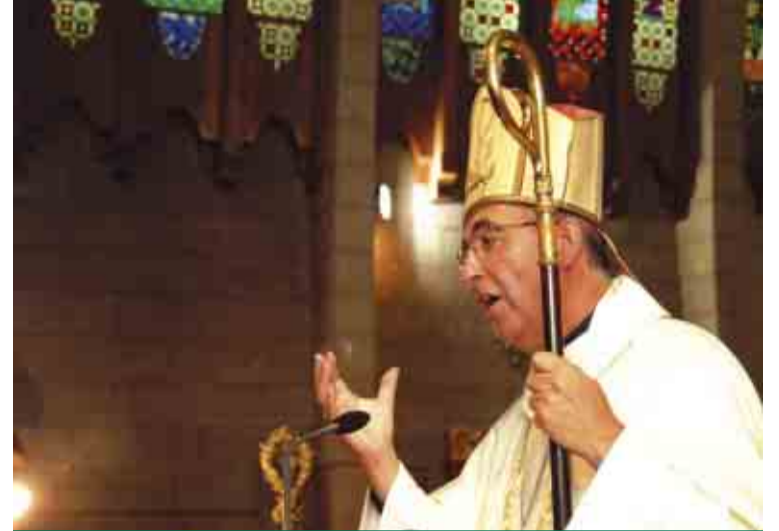
Igreja do Divino Salvador de Joane, 07-09-2003