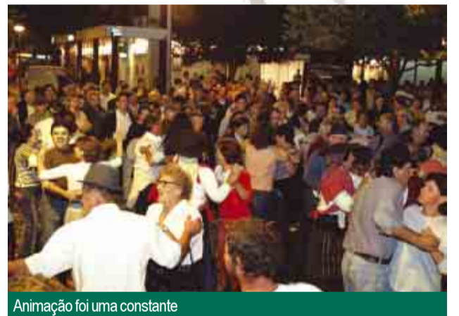
Animação foi uma constante