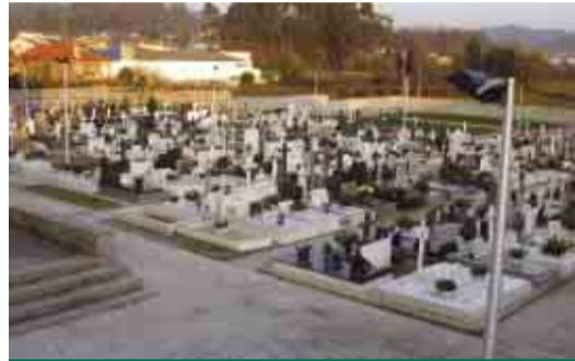
LOURO Colocação de iluminação pública no cemitério