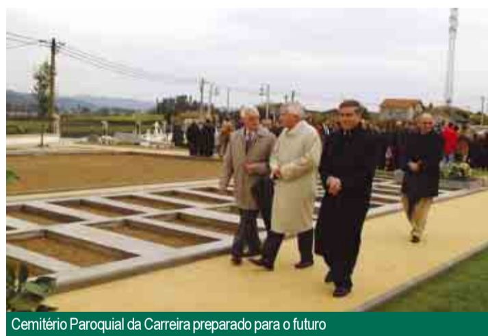
Cemitério Paroquial da Carreira preparado para o futuro