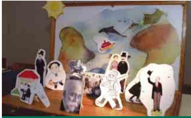
Maletas pedagógicas levam museus às escolas