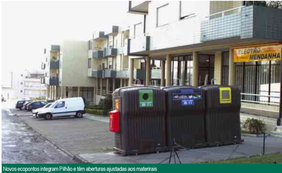
Novos ecopontos integram Pilhão e têm aberturas ajustadas aos materiais

Também a proximidade de zonas escolares serviu de critério para a localização dos ecopontos, numa medida que dá continui-