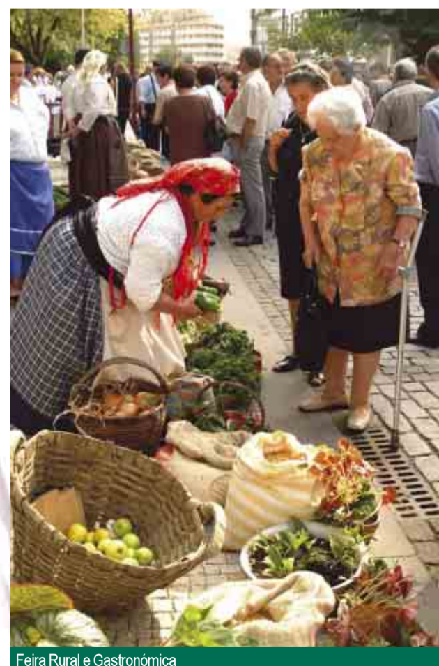
Feira Rural e Gastronómica