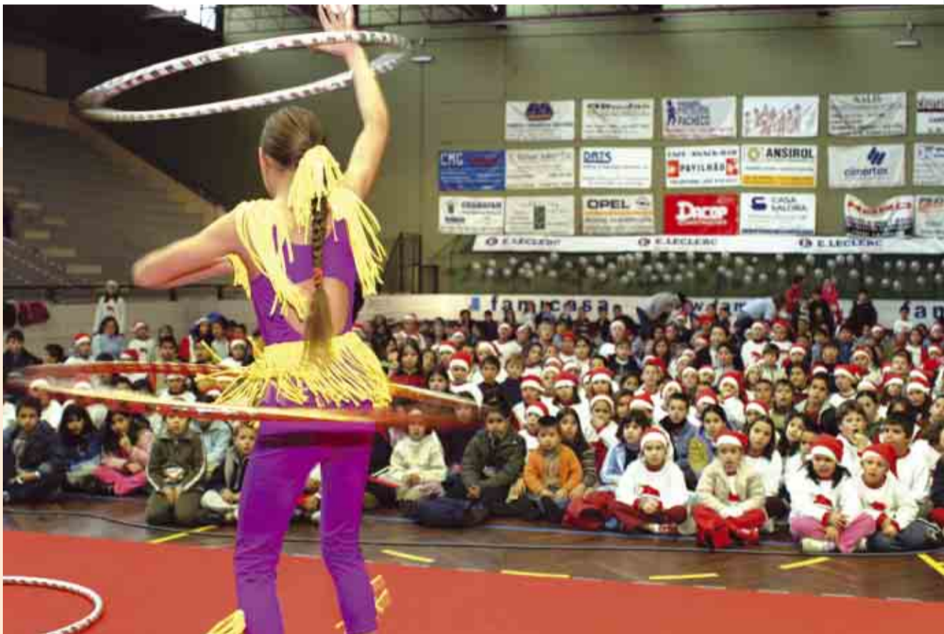
22.12.2003 Milhares de crianças participaram nas Férias Desportivas e Culturais do Natal. Na foto, um espectáculo de dança no Pavilhão Municipal de Famalicão