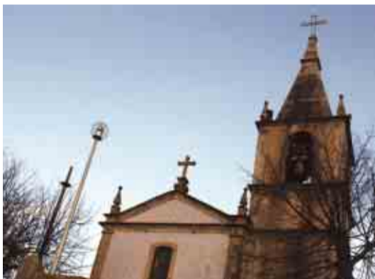
PORTELA Colocação de iluminação pública no adro da Igreja