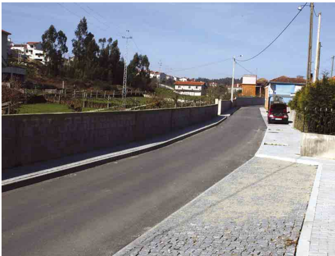
RIBEIRÃO Pavimentação da Rua de Boucinhas e do Paraíso