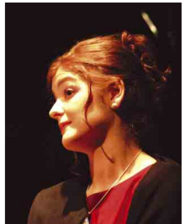
Mostra de Teatro Amador do Vale do Ave, 21-11-2003