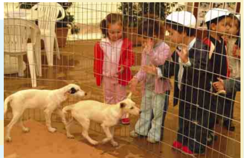
30.09.2003 Entusiasmo das crianças durante as comemorações do Dia Mundial do Animal