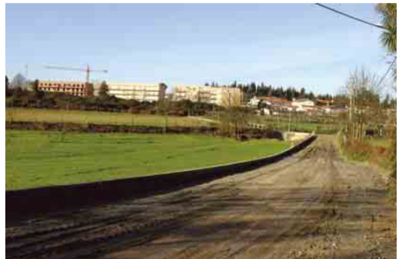
AVIDOS Reconstrução e alargamento do Caminho Municipal nº 1510