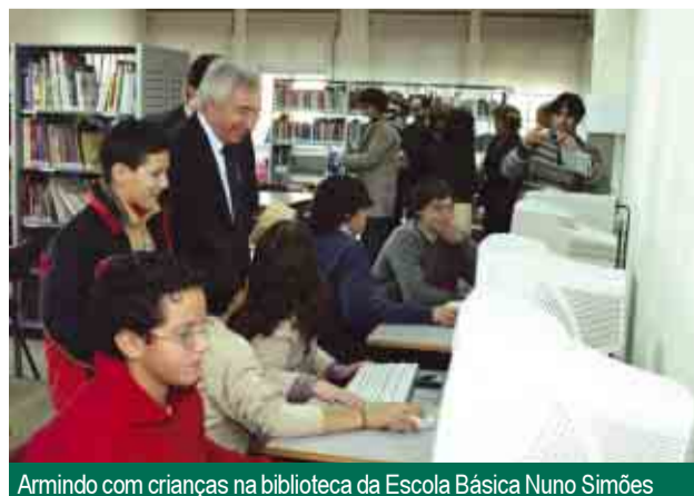
Armindo com crianças na biblioteca da Escola Básica Nuno Simões

A educação esteve também em destaque na visita de Armindo Costa a Calendário, tendo o presidente da Câmara assinalado a abertura do novo parque infantil da Escola Básica da Magida, para alegria das dezenas de crianças presentes. O novo equipamento de lazer, no valor de quatro mil euros, foi financiado pela Câmara Municipal. Entretanto, está em fase de conclusão a construção do Jardim-de-Infância da Lage, num terreno situado junto ao campo de futebol do Grupo Desportivo Lagense. A infra-estrutura educativa implica um investimento municipal de 324 mil euros.