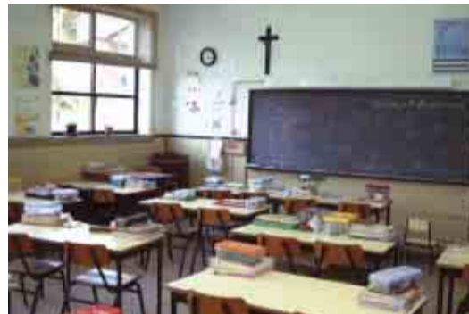
VALE SÃO MARTINHO Beneficiação da Escola Básica do 1º Ciclo