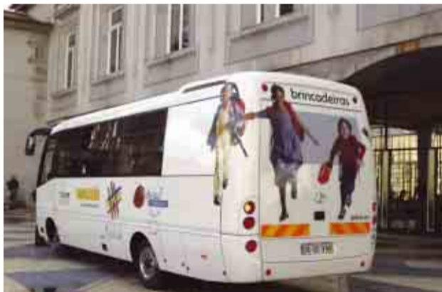
Autocarro “Brincadeiras” vai ao encontro das crianças