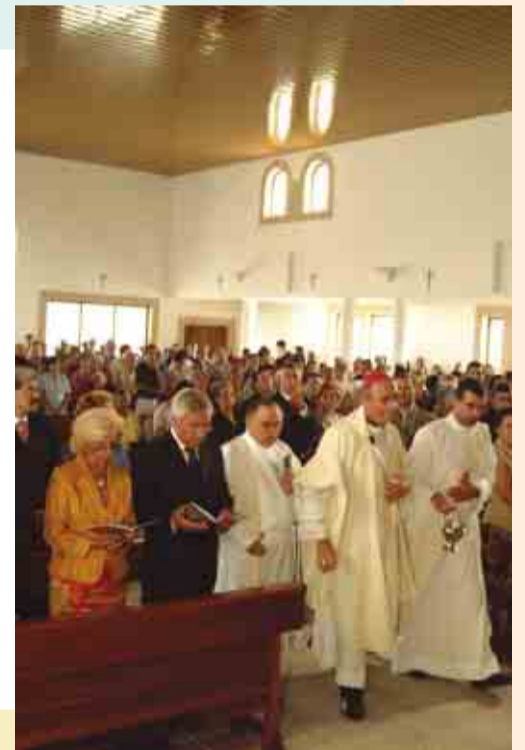
20.09.2003 Cerimónia de inauguração e bênção da Capela de S. Miguel-o-Anjo, em Calendário