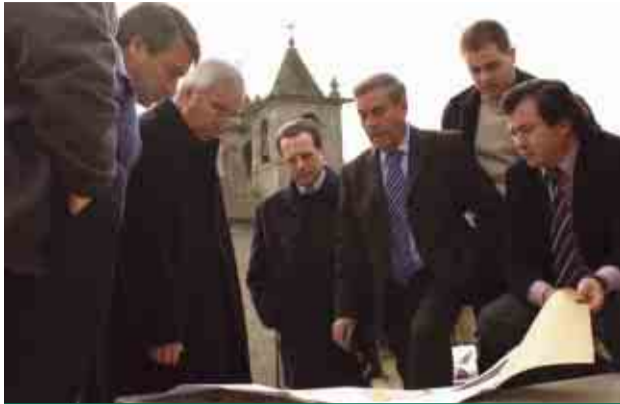
Autarcas analisam projecto para Largo do Mosteiro