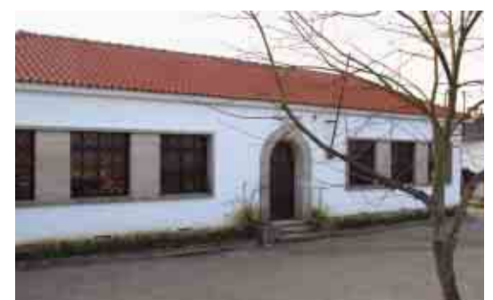
BRUFE Beneficiação da Escola Básica do Carvalho