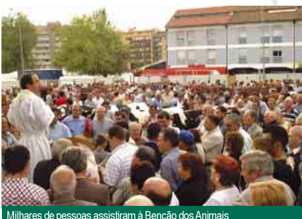
Milhares de pessoas assistiram à Benção dos Animais