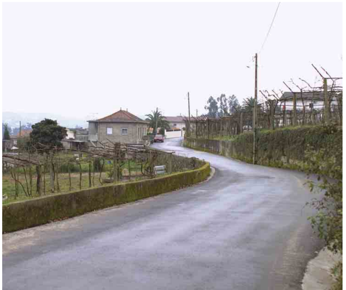
PEDOME Pavimentação da Rua de Pedação Mau