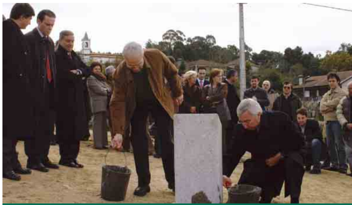
Novo equipamento autárquico e educativo de Jesufrei potencia uma nova centralidade na freguesia

PRIMEIRA PEDRA PARA CONSTRUÇÃO DA NOVA SEDE DE JUNTA E JARDIM-DE-INFÂNCIA