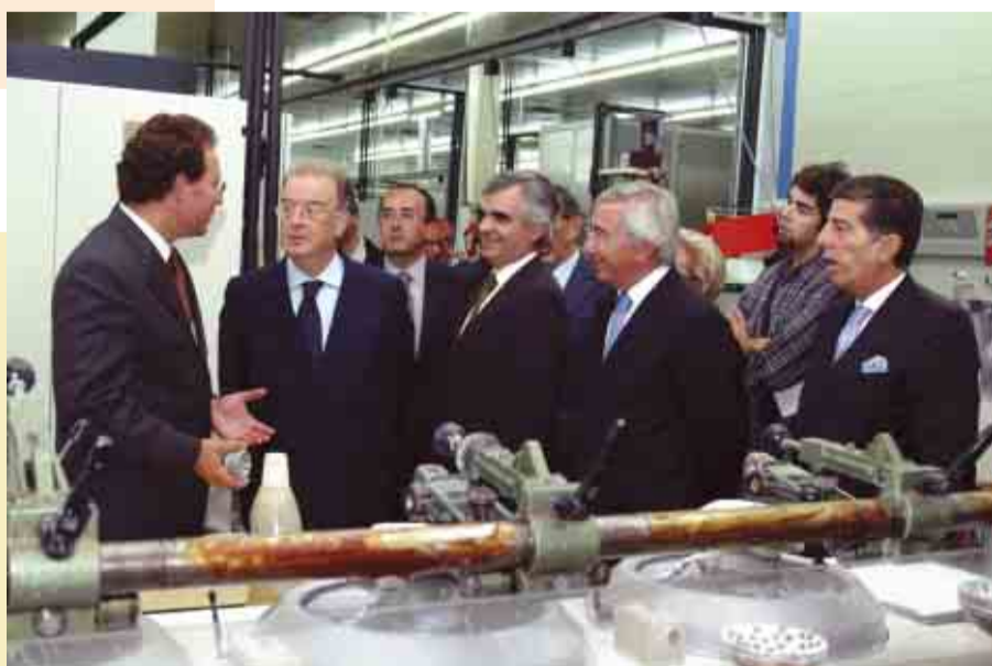
30.09.2003 Visita do Presidente da República, Jorge Sampaio, à empresa multinacional Leica, em Antas