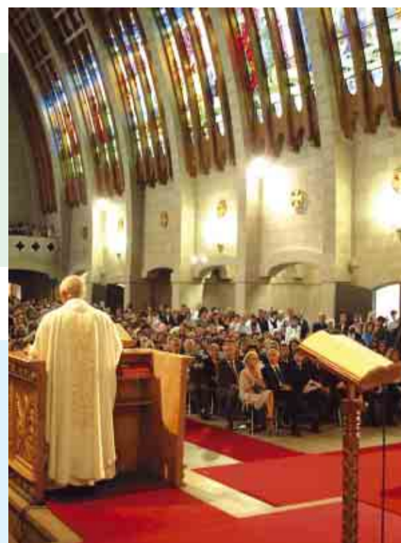
07.09.2003 Inauguração da Igreja do Divino Salvador de Joane