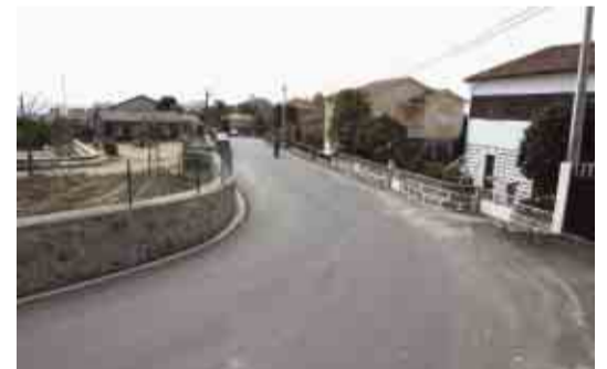
REQUIÃO Pavimentação da Rua do Couce