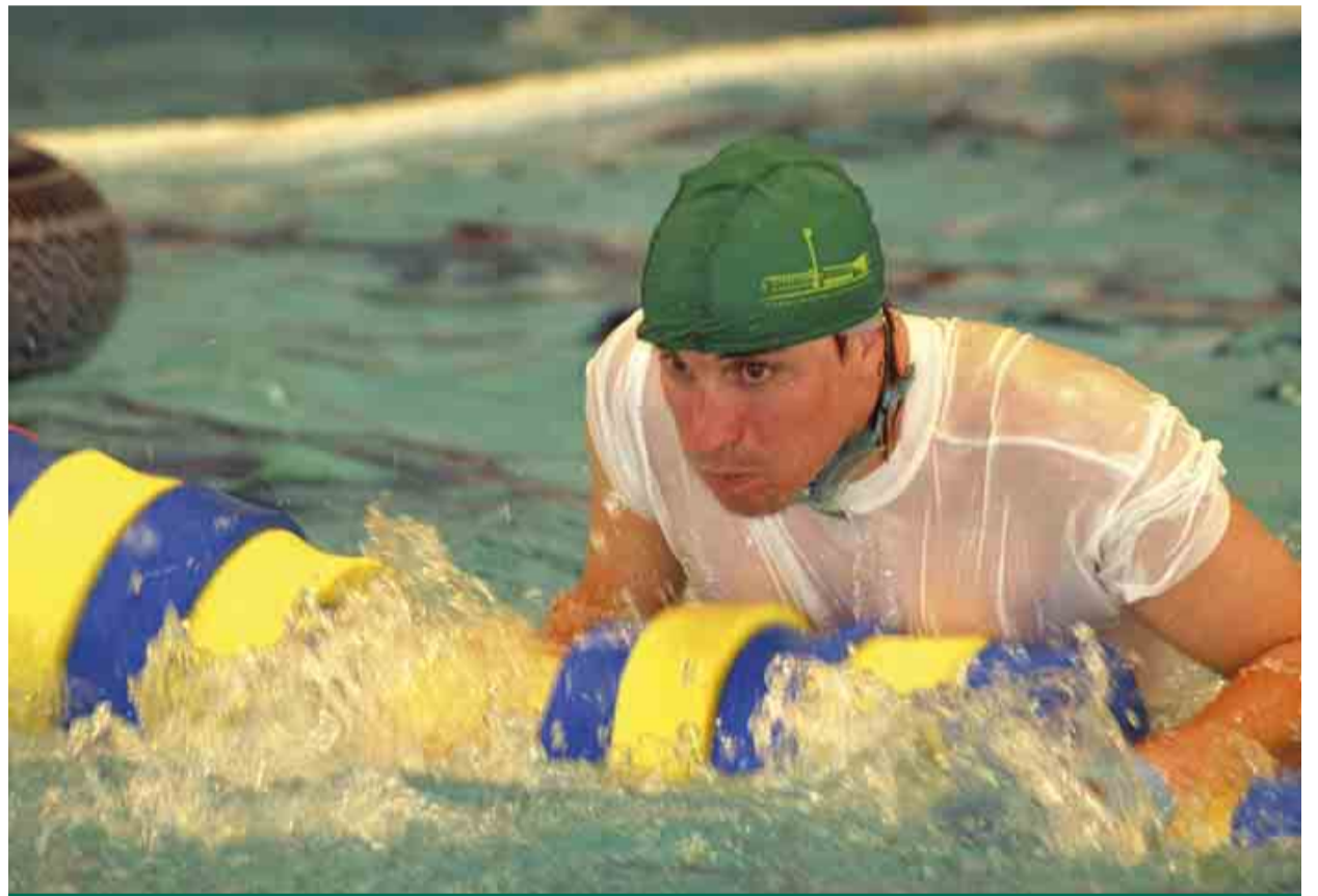
Piscina Municipal de Joane, 05-07-2003