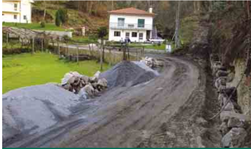
TELHADO Reconstrução da Rua do Ribeirinho