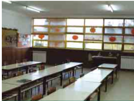
OLIVEIRA SÃO MATEUS Beneficiação do Jardim-de-Infância de Santana 1