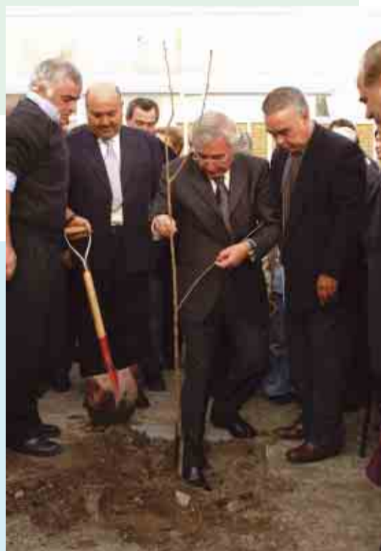
23.11.2003 Plantação da primeira cerejeira da campanha Brufe - Terra das Cerejas