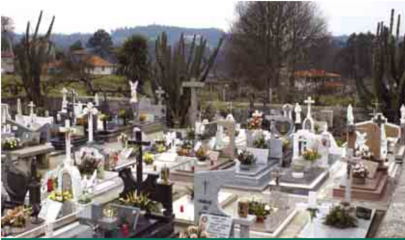
SEZURES Aquisição de terreno para ampliação do cemitério