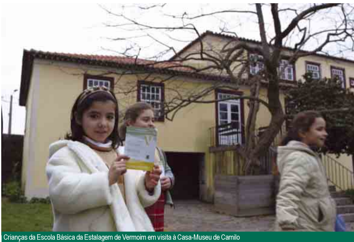
Crianças da Escola Básica da Estalagem de Vermoim em visita à Casa-Museu de Camilo

São cinco as maletas pedagógicas que estão a viajar pelas escolas do 1º Ciclo do Ensino Básico do concelho, respeitantes a cada um dos espaços museológicos envolvidos no projecto: Museu da Indústria Têxtil, Museu Bernardino Machado, Casa-Museu Camilo Castelo Branco, Casa-Museu Soledade Malvar e Estação Arqueológica de Perrelos (Delães).