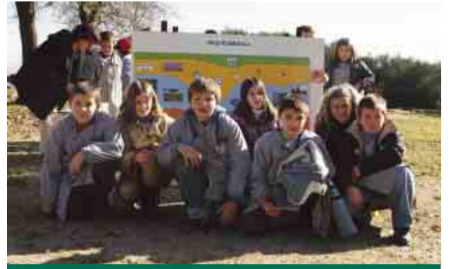
Crianças de visita à Estação Arqueológica de Perrelos