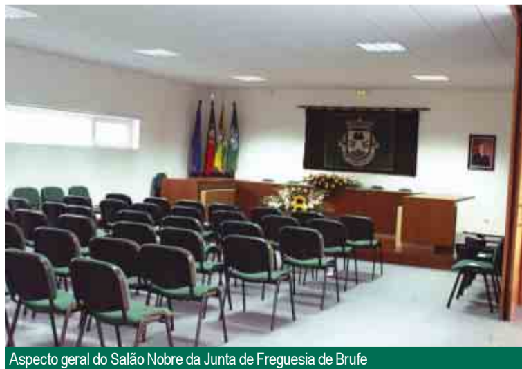
Aspecto geral do Salão Nobre da Junta de Freguesia de Brufe