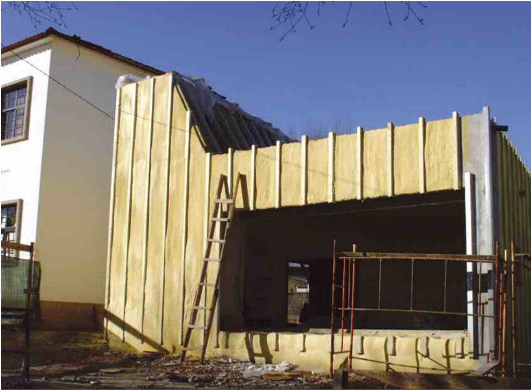
LANDIM Construção de cantina na Escola Básica da Passelada 1