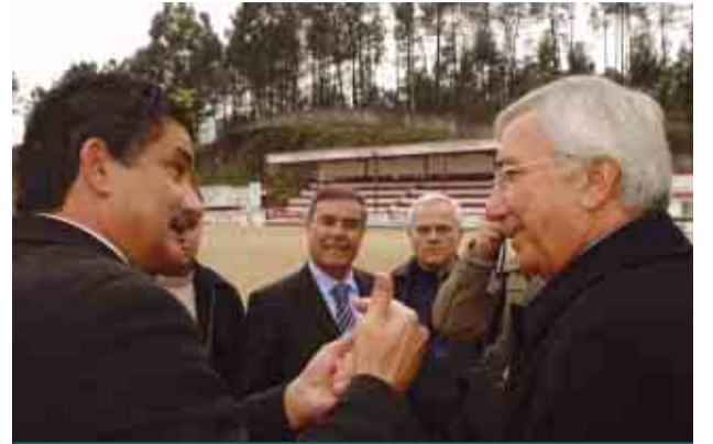
Câmara apoia a AD Oliveirense