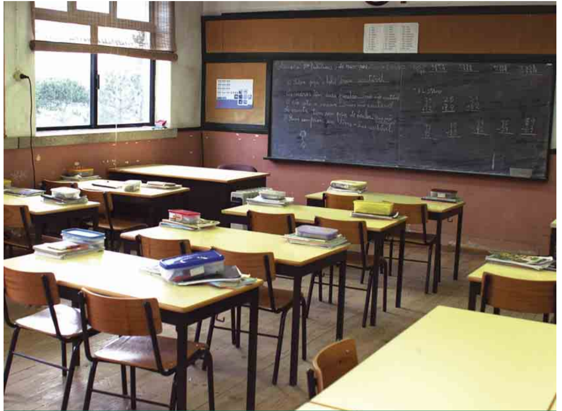
ARNOSO SANTA EULÁLIA Beneficiação da Escola Básica de Quintão