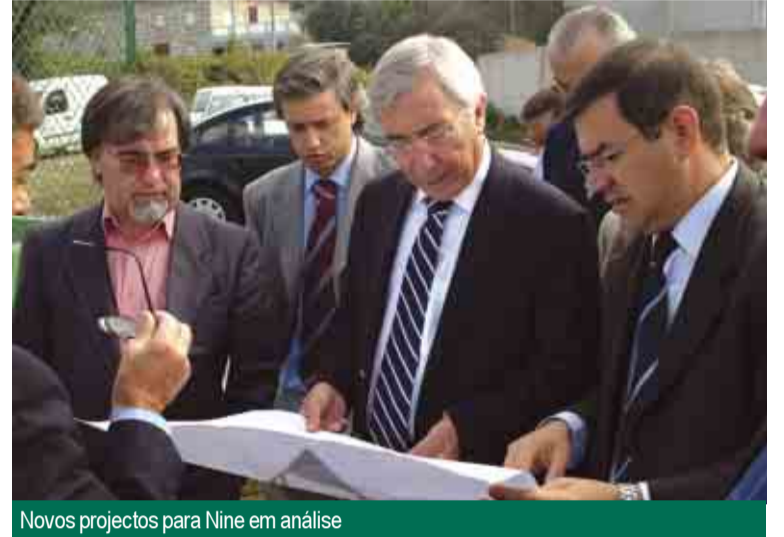
Novos projectos para Nine em análise