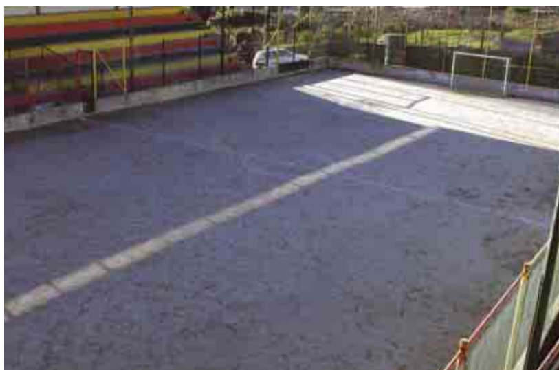
NOVAIS Protocolo para pavimentação do Polidesportivo da Associação Desportiva e Cultural de Novais