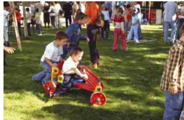
Centenas de crianças marcaram presença na inauguração