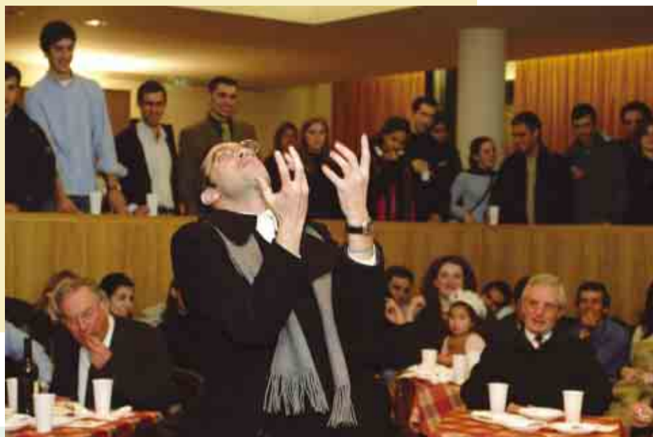
22.11.2003 Actuação do grupo Varazim no café-concerto da Casa das Artes durante a Mostra de Teatro Amador do Vale do Ave