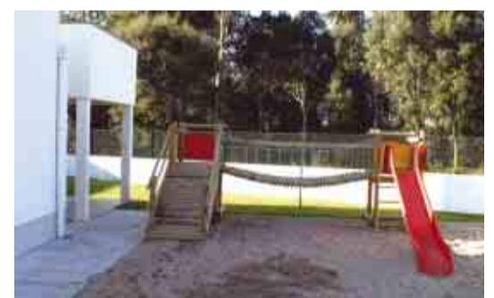
BENTE Colocação de parque infantil no jardim-de-infância