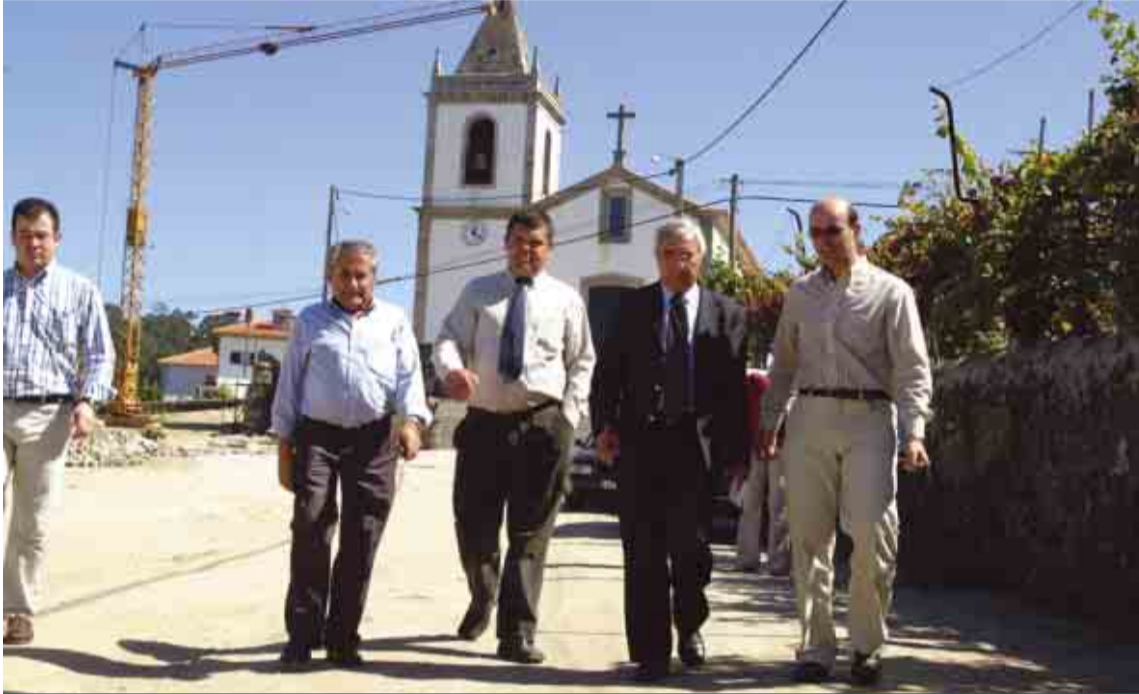
Construção da Alameda da Igreja cria centro cívico em Ceide São Paio

OS SERVIÇOS autárquicos de Ceide S. Paio estão a funcionar na nova Sede de Junta de Freguesia desde o início deste mês de Março. Em visita de trabalho à