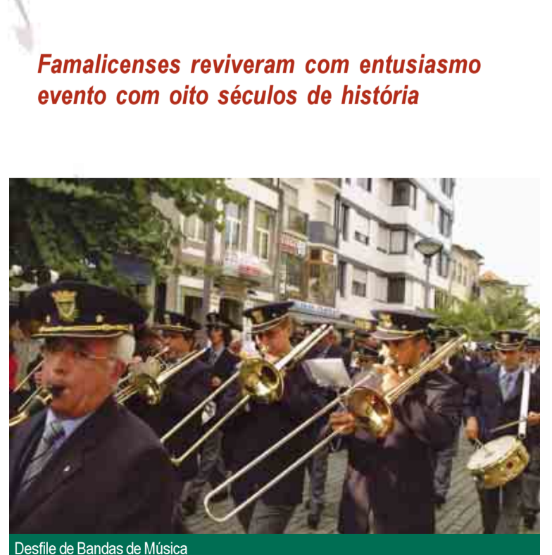
Desfile de Bandas de Música

Famalicenses reviveram com entusiasmo evento com oito séculos de história