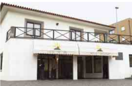
MOGEGE Apoio ao Centro de Dia da Associação Nascer do Sol