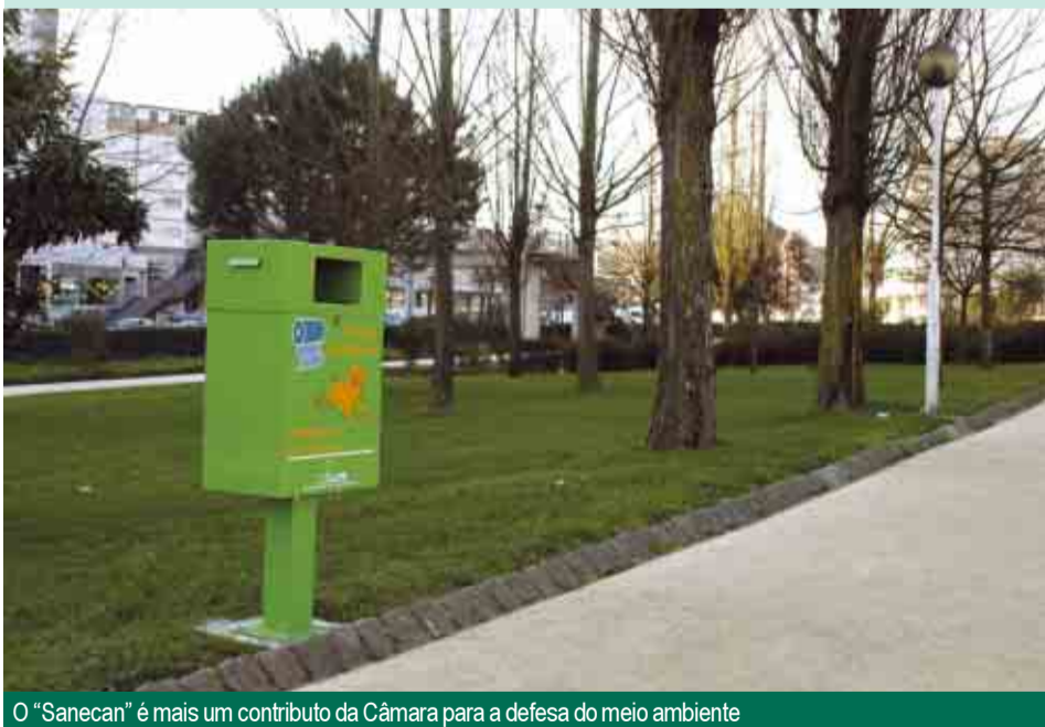
O “Sanecan” é mais um contributo da Câmara para a defesa do meio ambiente

PROSSEGUINDO UMA política de defesa do meio ambiente e promovendo condições de uma cada vez maior qualidade de vida dos famalicenses, a Câmara procedeu à colocação na cidade de dez recipientes “Sanecan” destinados à recolha dos dejectos caninos. Os contentores – em que estão integrados distribuidores de sacos-luvas, em material opaco e impermeável aos odores – foram distribuídos pelos principais espaços verdes urbanos, locais normalmente utilizados pelos munícipes para passearem os seus animais de estimação. “Com esta medida, a Câmara pretende contribuir para uma cidade mais limpa e eliminar o perigo que representam para a saúde pública os dejectos caninos em locais públicos”, afirma o presidente da Câmara. Os recipientes foram colocados nos parques de Sinções e da Juventude, nas praças Álvaro Marques e D. Maria II e Rua Ernesto Carvalho.