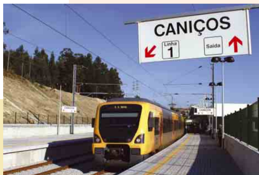
19.01.2004 Primeiro comboio a passar na Estação de Caniços, em Bairro, depois das obras de modernização da Linha de Guimarães