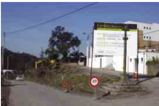
VILARINHO DAS CAMBAS Construção de sede de Junta