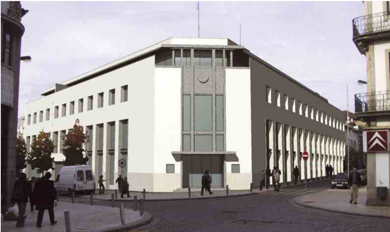
Projecto de recuperação do ex-Hotel Garantia dá o mote para a criação de uma nova praça no centro da cidade