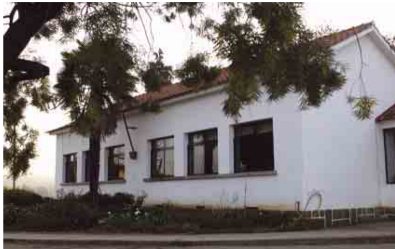
CAVALÕES Beneficiação da Escola Básica de S. Gonçalo