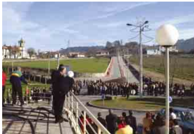
Ruivanenses acorreram em massa à inauguração

OBRA ESTRUTURANTE IMPLICOU INVESTIMENTO DE 250 MIL EUROS