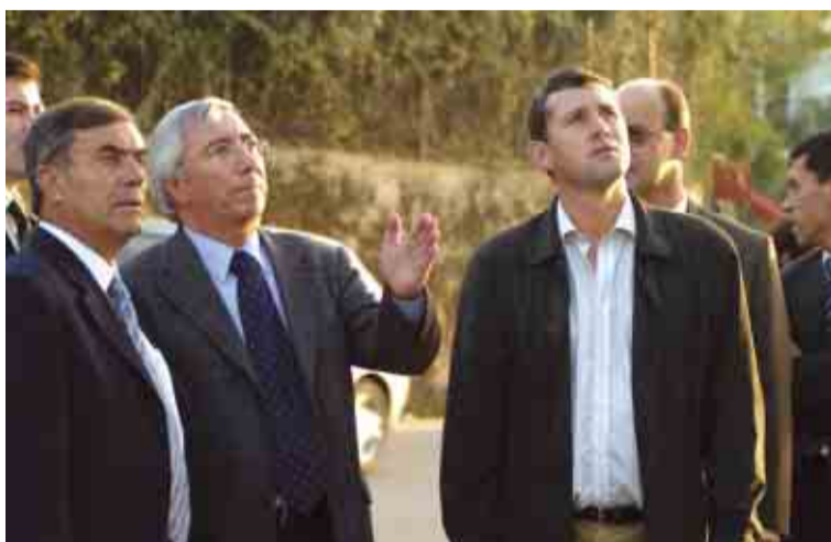
Novos projectos para Vale S. Martinho em análise

chão da sede da Junta de Freguesia) e visitou as instalações do Grupo Recreativo Vale S. Martinho e do Grupo Desportivo do Montinho, onde avaliou a possibilidade de o Município participar na melhoria das respectivas instalações.