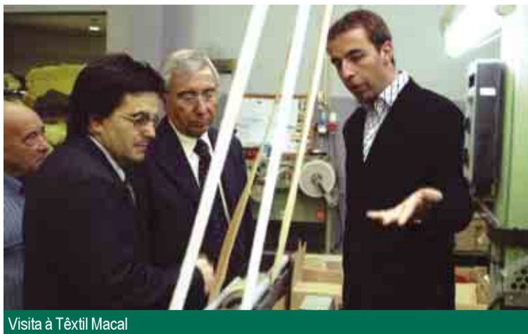
Visita à Têxtil Macal