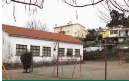
LEMENHE Beneficiação da Escola Básica da Prelada 2