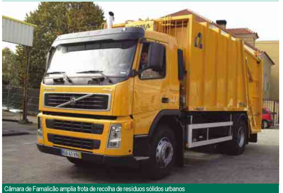
Câmara de Famalicão amplia frota de recolha de resíduos sólidos urbanos

A CÂMARA Municipal reforçou a capacidade de recolha de resíduos sólidos urbanos, com a criação de duas novas frotas e o conseqüente reajustamento dos circuitos existentes no concelho, com excepção da cidade, cujo serviço permanece inalterado (ver no verso da contracapa deste Boletim Municipal). A ampliação do serviço de recolha de lixos domésticos, possibilitada pela aquisição de duas novas viaturas, num investimento global de cerca de 288 mil euros, e com a admissão de quatro novos funcionários para o serviço, permitiu acabar de vez com a recolha por contentor, sendo agora todo o território concelhio servido com a recolha porta-a-porta. As alterações introduzidas no serviço de recolha de lixo entraram em vigor no passado dia 9 de Fevereiro, tendo a Câmara Municipal lançado uma campanha de informação.