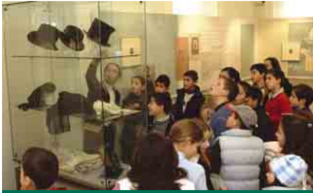
Alunos da EBI de Gondifelos conheceram Museu Bernardino Machado