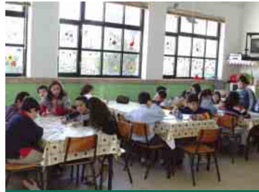
CARREIRA Sala de ATL na Escola Básica do Outeiro