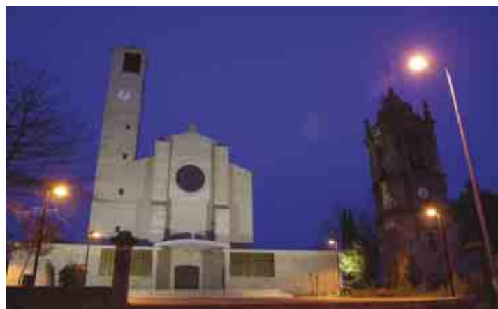
Nova iluminação no adro da Igreja de Joane