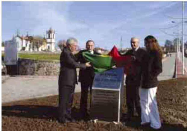
Nova avenida concretiza sonho antigo da população