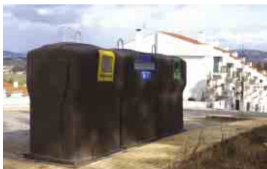
GONDIFELOS Dois novos ecopontos na freguesia