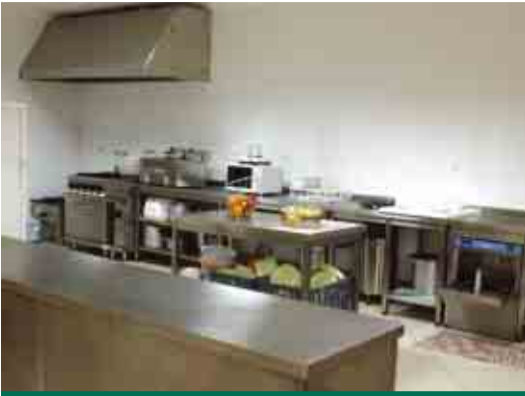
CABEÇUDOS Equipamento de cozinha do jardim-de-infância