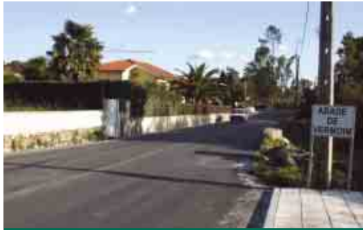
ABADE DE VERMOIM Reconstrução da Estrada Municipal nº 573