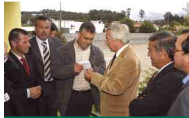
Grupo Desportivo do Louro recebeu apoio