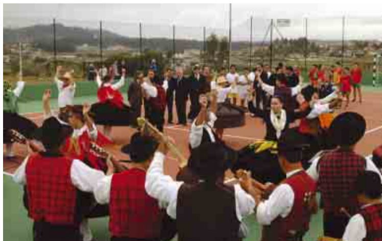
Ambiente de festa acompanhou inaugurações