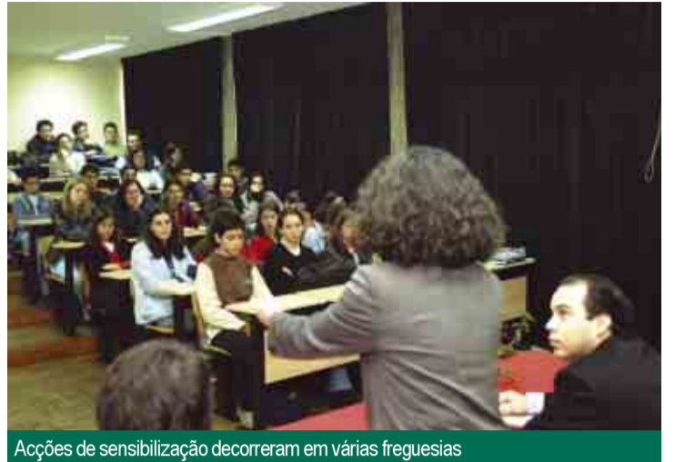
Acções de sensibilização decorreram em várias freguesias

A Solidariedade, a Administração Autárquica e o Departamento Administrativo e Financeiro absorvem 21,56 por cento do orçamento, ou seja uma verba de 14,8 milhões de euros. São áreas prioritárias de acção da Câmara Municipal de Vila Nova de Famalicão, que trabalha em prol de um município moderno, credível, solidário e próximo dos cidadãos.