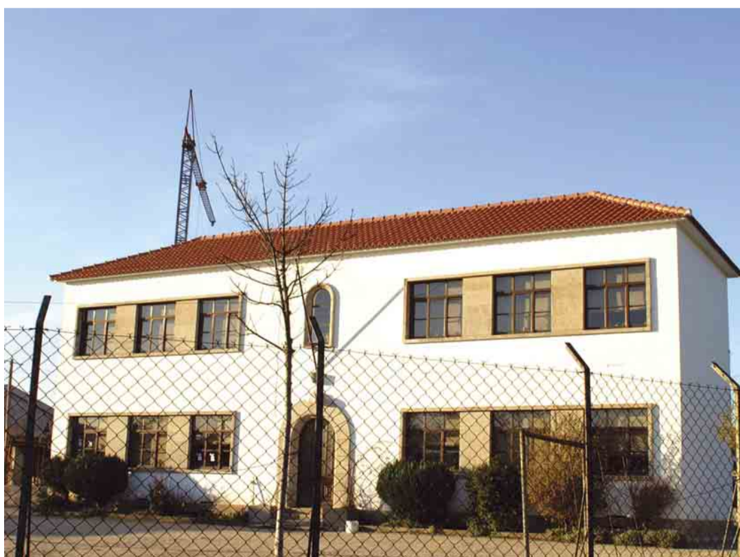
BAIRRO Beneficiação da Escola Básica da Igreja