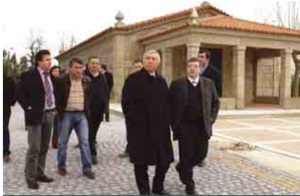
Capela de Santa Tecla renovada