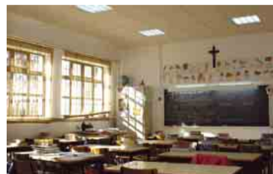
JESUFREI Beneficiação da Escola Básica de Bairro