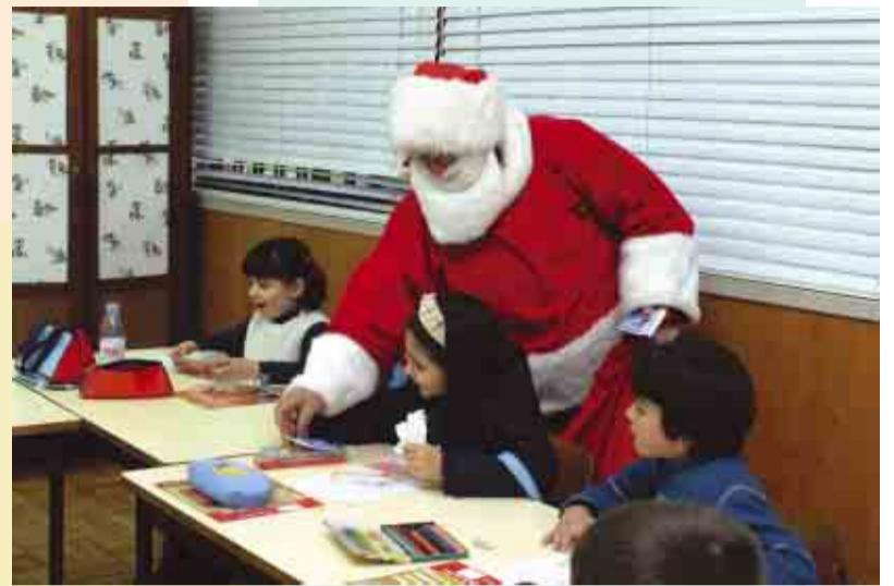
10.12.2003 O Pai Natal da Câmara Municipal visitou as escolas pré-primárias e do 1º Ciclo do Ensino Básico do concelho famalicense