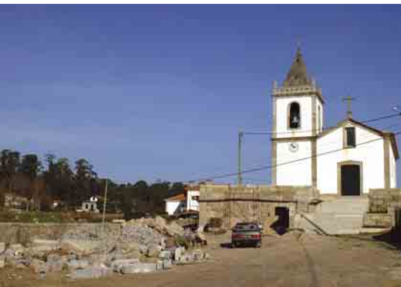
CEIDE SÃO PAIO Reordenamento urbanístico da zona envolvente à Igreja Paroquial