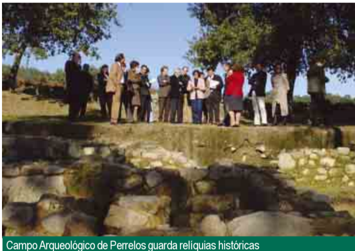
Campo Arqueológico de Perrelos guarda reliquias históricas