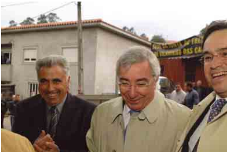
“Um dia muito grande para Vilarinho”, disse o presidente da Junta