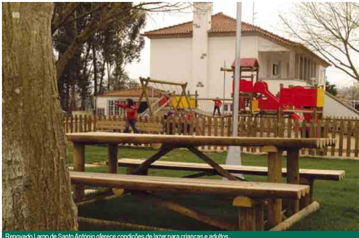
Renovado Largo de Santo António oferece condições de lazer para crianças e adultos

ESPAÇO DE CONVÍVIO A intervenção urbanística efectuada no Largo de Santo António, em frente à sede de Junta de Freguesia, requalificou um espaço nobre da freguesia, agora devolvido à população com condições óptimas para a convivência e ocupação de tempos livres. Com um investimento global de 25 mil euros, 19 mil dos quais suportados pela Câmara, a renovação daquele espaço público consistiu na criação de um parque infantil e de um espaço de merendas, no ajardinamento de