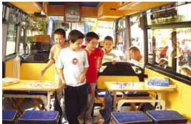
Interior da viatura agrada aos mais novos

A unidade está equipada com diverso material informático, jogos lúdico-pedagógicos, livros, CD, vídeos e materiais de expressão dramática, musical, motora e plástica. A dinamização do “Brincadeiras” e o planeamento e avaliação das actividades estão a cargo de uma equipa de técnicos credenciados afectos ao projecto, que comporta dois educadores de infância, um técnico superior de serviço social, um técnico superior de educação e dois animadores sócio-culturais.