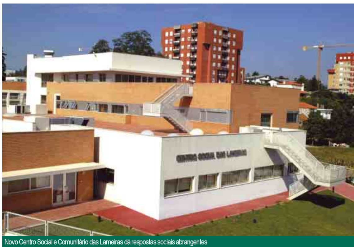
Novo Centro Social e Comunitário das Lameiras dá respostas sociais abrangentes

INVESTIMENTO Para a construção do Centro Comunitário das Lameiras, que correspondeu