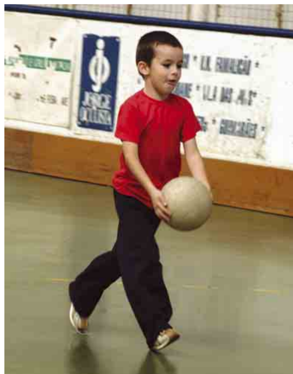
Riba de Ave, 13-10-2003