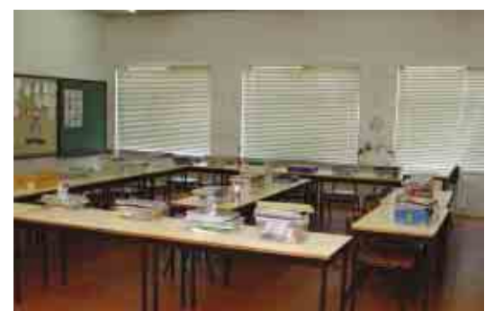
RUVÃES Beneficiação do jardim-de-infância