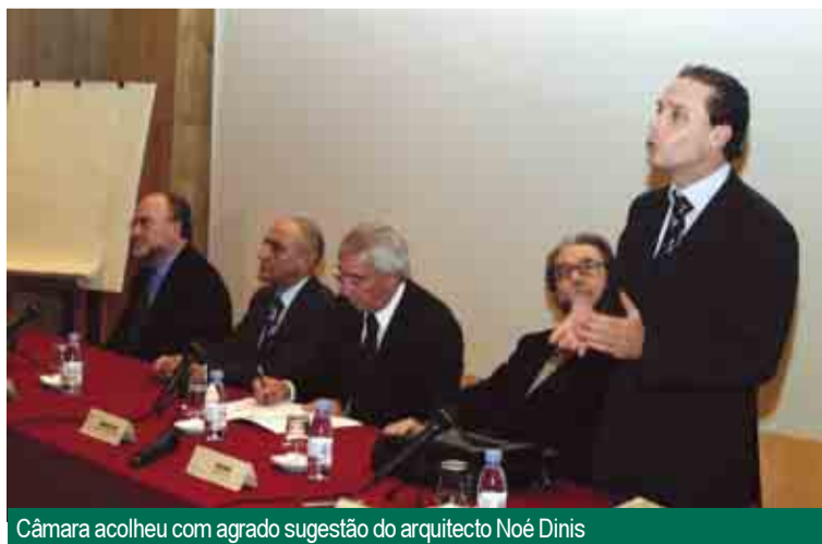
Câmara acolheu com agrado sugestão do arquitecto Noé Dinis