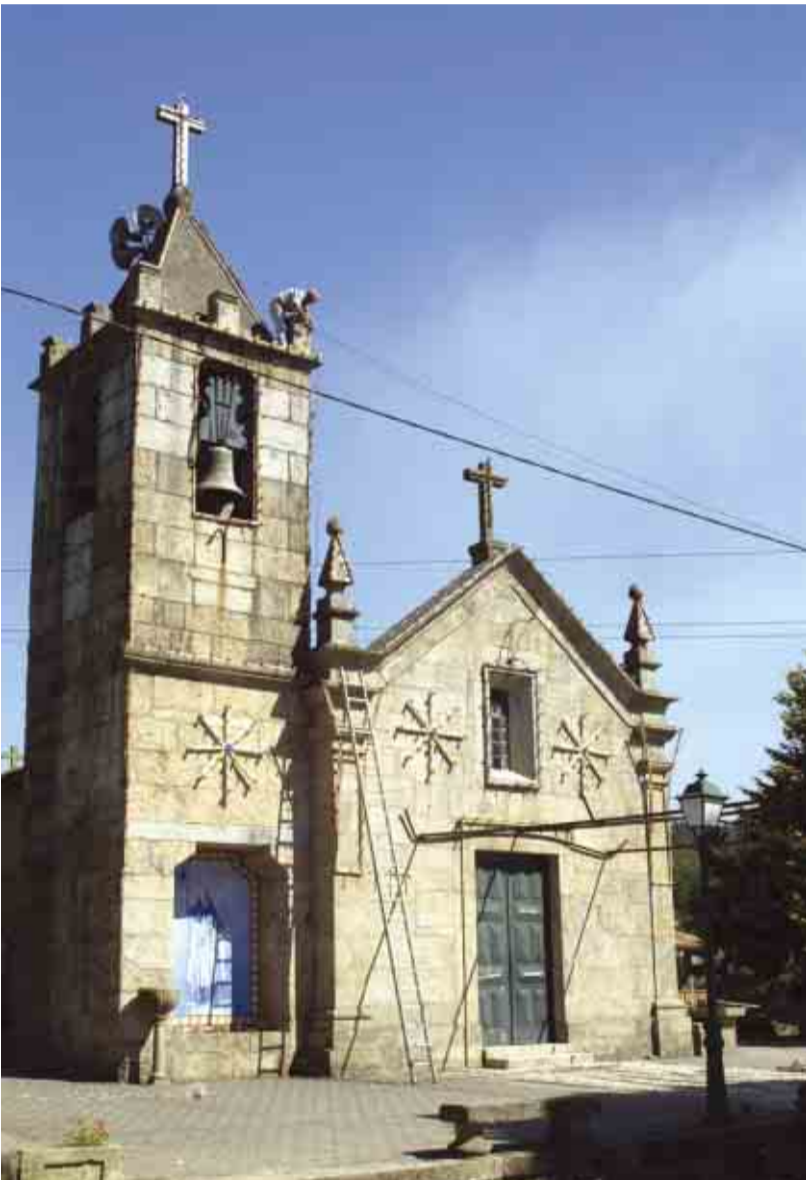
CASTELÕES Projecto para reabilitação urbanística do adro da Igreja