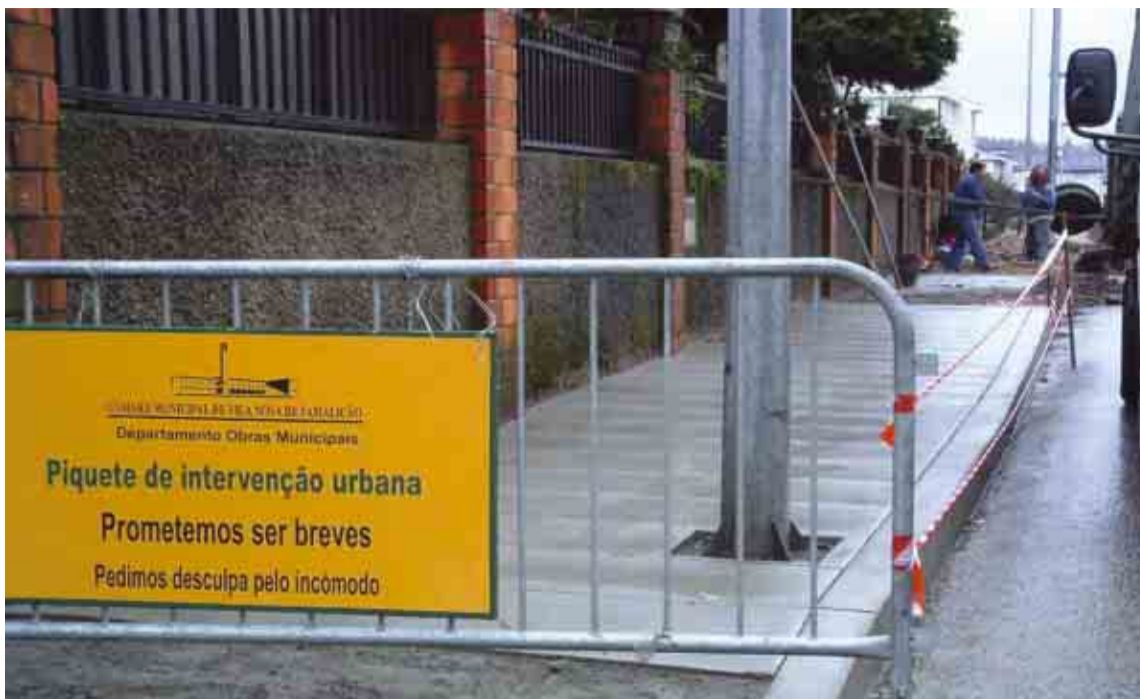
Intervenção recentemente efectuada pelo piquete municipal na Rua Alberto Sampaio