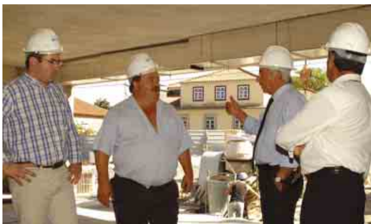
Centro Cultural cresce em frente à Casa-Museu Camilo Castelo Branco

“UMA OBRA necessária para servir a juventude famalicense e o movimento associativo com mais expressão no concelho.” As palavras do Presidente da Câmara foram proferidas no passado dia 18 de Janeiro, durante a cerimónia de apresentação do projecto e lançamento da primeira pedra da futura sede social do agrupamento de escuteiros de Ceide S. Miguel. Com um investimento estimado na ordem dos 150 mil euros, a nova infra-estrutura ficará situada na Rua da Seara, em terreno cedido pela Câmara Municipal. O novo edifício, cuja construção deverá estar concluída dentro de dois anos, estará equipado com várias salas para o desenvolvimento das actividades dos escuteiros e com dormitório, refeitório e balneários, valências que permitirão acolher outros agrupamentos escutistas e outras associações ligadas à juventude que estejam de visita à terra onde Camilo Castelo Branco viveu grande parte dos seus dias e onde produziu a maioria das suas obras.