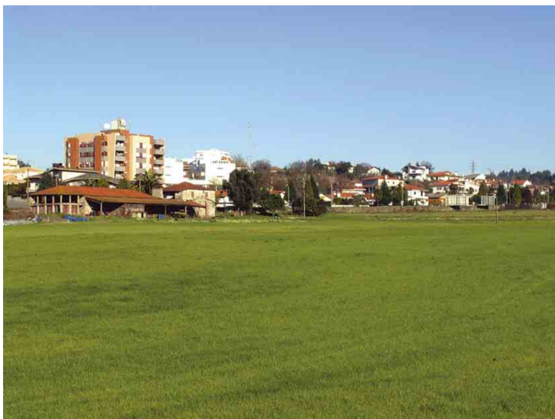
GAVIÃO Cedência de terreno para construção do Palácio da Justiça de Vila Nova de Famalicão