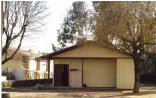
ANTAS Cantina na Escola Básica de S. Cláudio