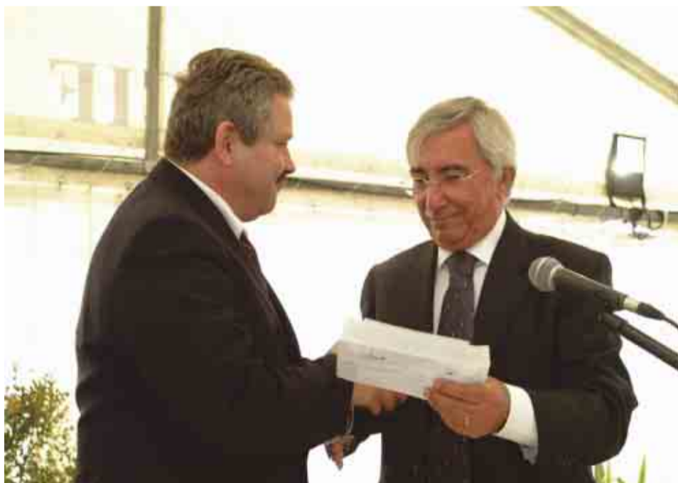
Câmara paga inscrições de jovens futebolistas famalicenses na Associação de Futebol de Braga