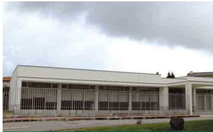
ESMERIZ Construção do Jardim-de-Infância