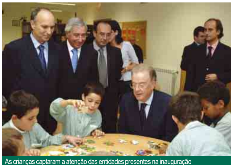
As crianças captaram a atenção das entidades presentes na inauguração