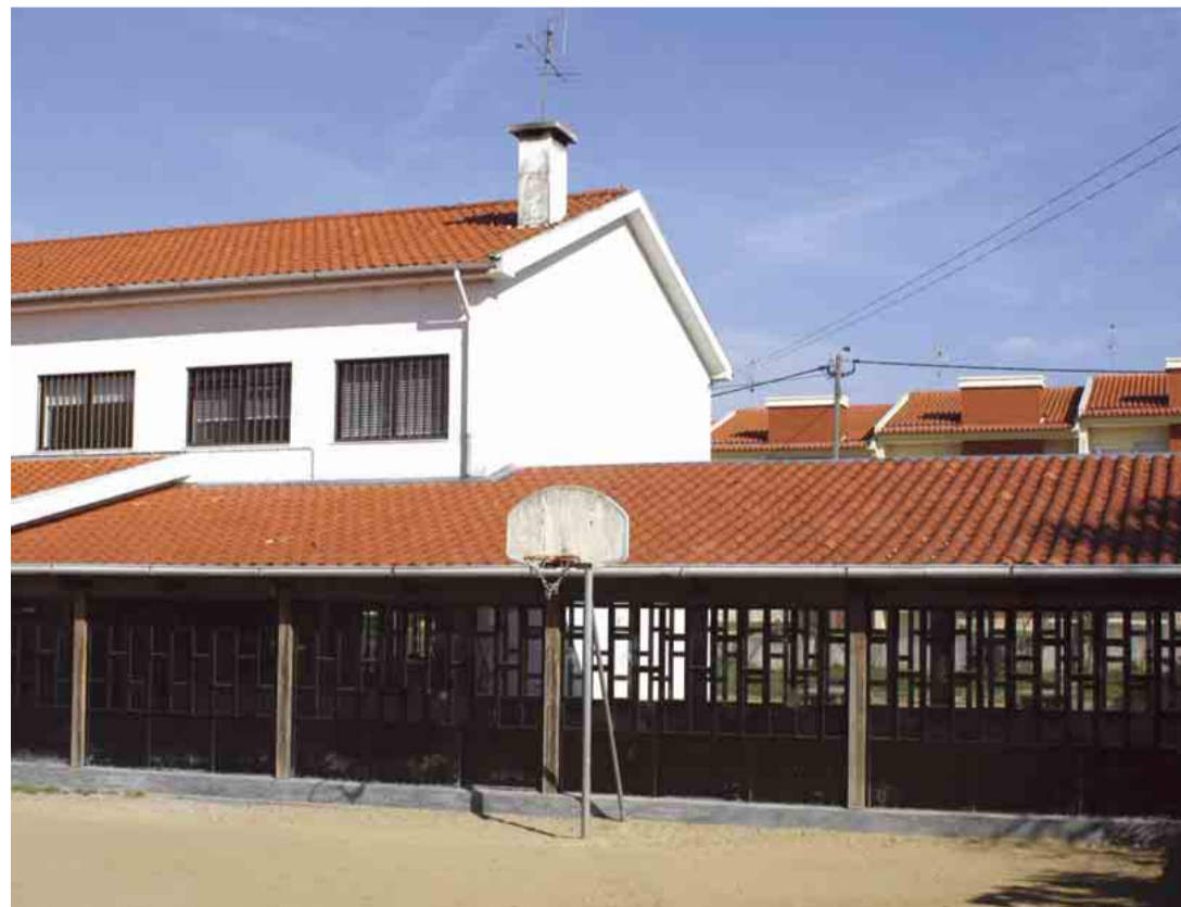
VERMOIM Beneficiação da Escola Básica da Estalagem