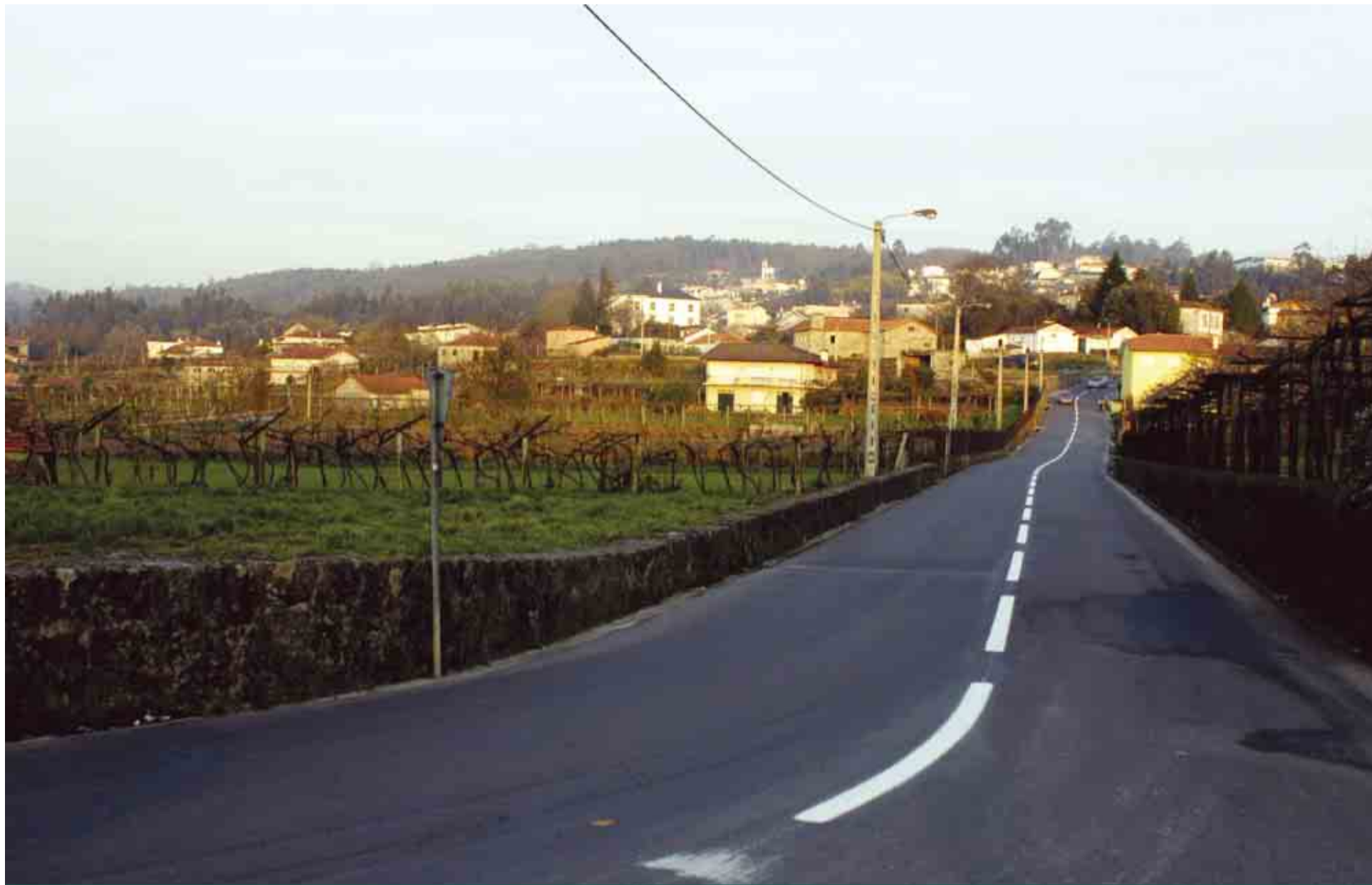
Estrada Municipal nº 571-2, entre Gavião, Mouquim, Lemenhe e Nine, foi uma das vias pavimentadas