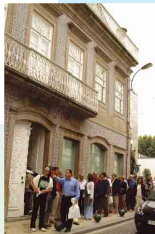
24.06.2003 Turistas brasileiros do Estado de Pernambuco, grande parte deles do Recife e Caruaru, em visita ao Museu Bernardino Machado