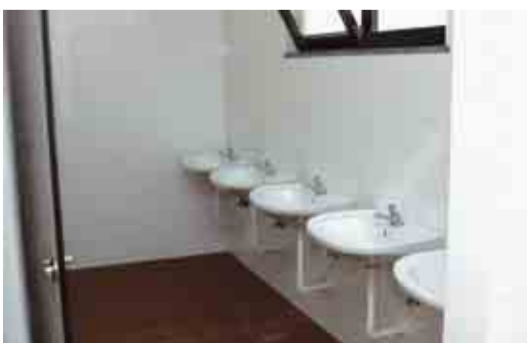
VILA NOVA DE FAMILIÇÃO Remodelação das instalações sanitárias da Escola Sede nº 1