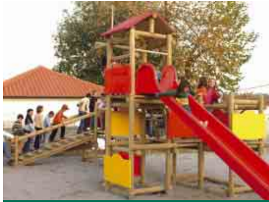
CALENDÁRIO Parque infantil na Escola Básica da Magida