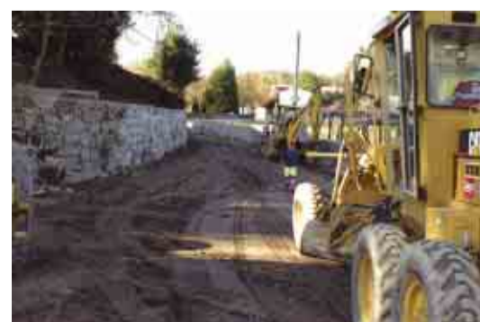
LAGOA Reconstrução da Rua do Solar de Pouve