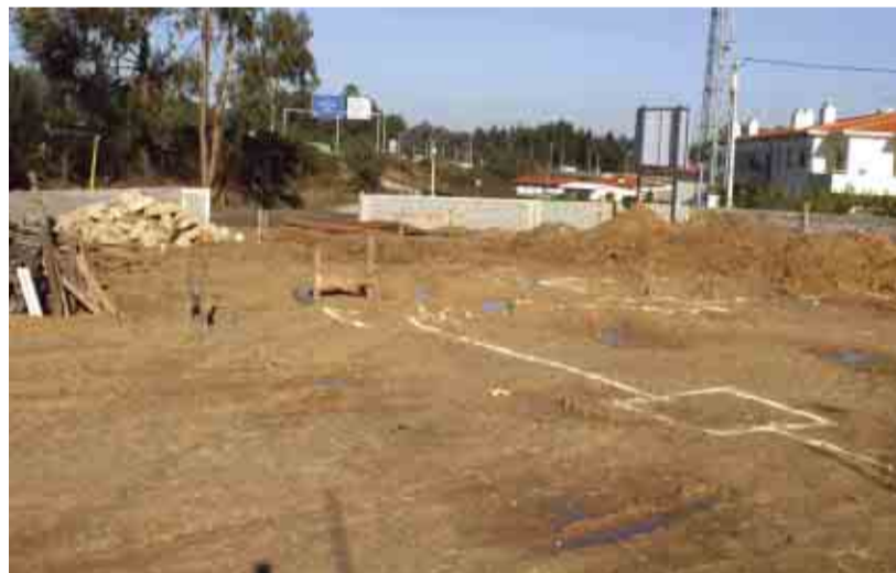
CEIDE SÃO MIGUEL Cedência de terreno para construção da Sede dos Escuteiros