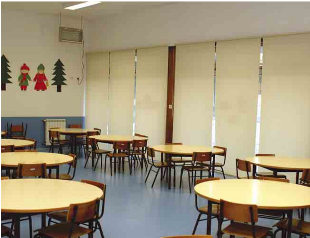
RIBA DE AVE Beneficiação do jardim-de-infância