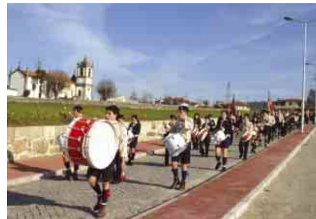
Os escuteiros deram um colorido especial à festa