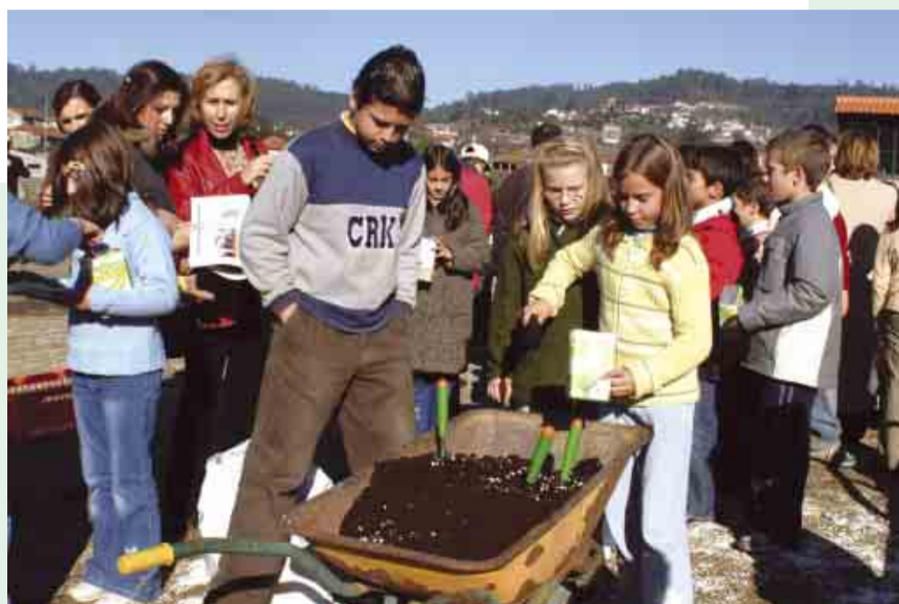
25.11.2003 Crianças envolvidas nas comemorações do Dia da Floresta Autóctone, na Didáxis de S. Cosme do Vale