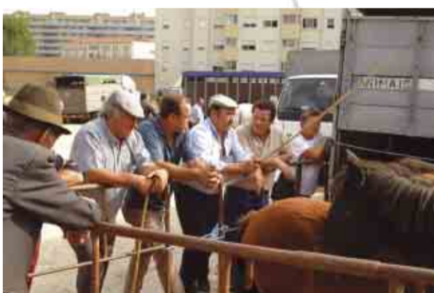
Feira de Gado Bovino, Cavalari, Caprino e Ovino