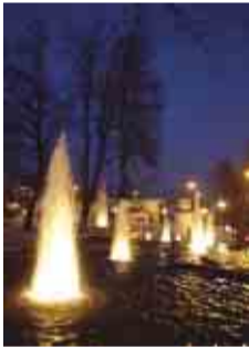
CAPA A nova imagem do Parque 1º de Maio, 21-01-2004

Vila Nova de Famalicão Boletim Municipal