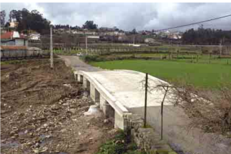
NINE Pontão junto ao rio Este (lugar de Borrallheira)