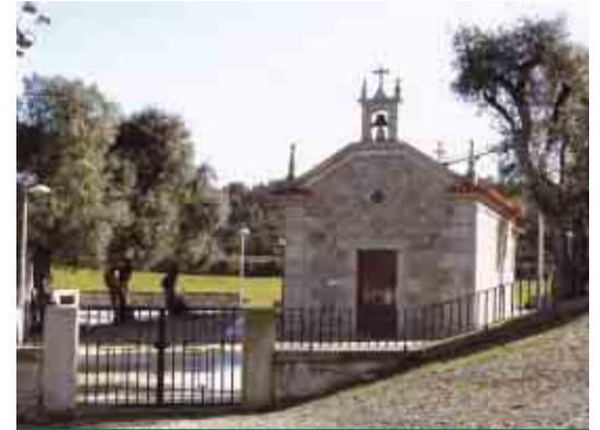
OUTIZ Arranjo urbanístico da Capela Nossa Senhora da Guia