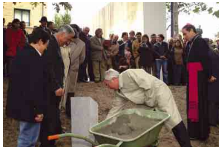
Lançamento da primeira pedra da nova Sede da Junta de Vilarinho das Cambas

salientou o presidente da Câmara Municipal, reafirmando o empenho do município em dotar todas as Juntas de Freguesia “de mecanismos e condições indispensáveis à execução do seu mandato”.