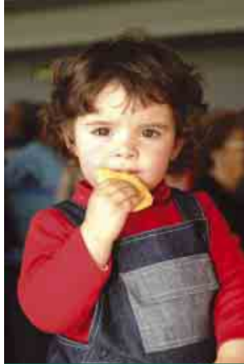
Casa das Artes, 03-06-2003