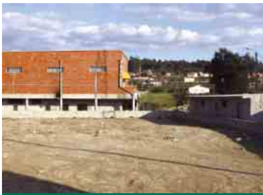
POUSADA DE SARAMAGOS Apoio à construção do Polidesportivo da ADRO