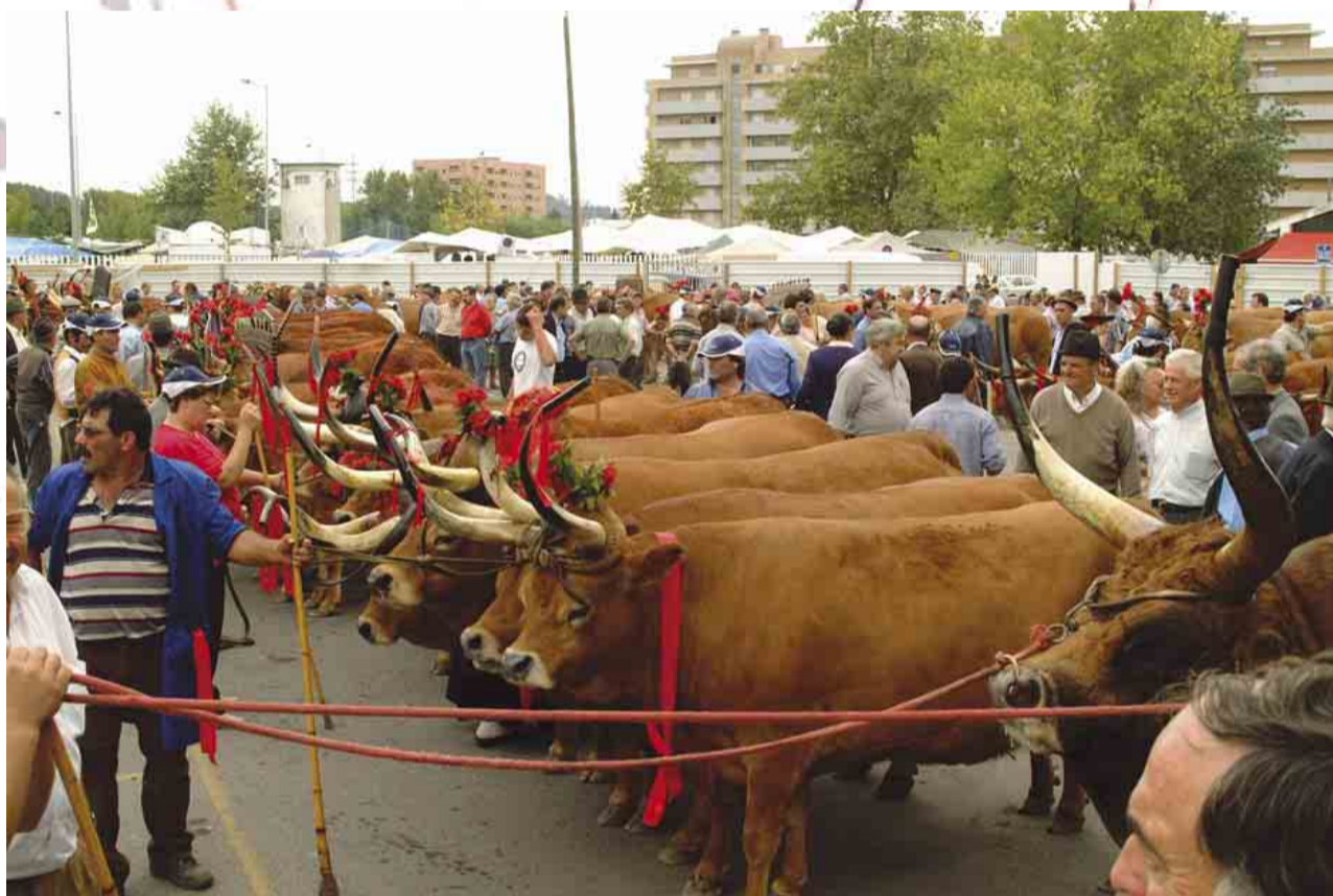
Grande Concurso Pecuário

A cidade foi visitada por milhares e milhares de pessoas que deram a melhor resposta à aposta da Câmara Municipal de Vila Nova de Famalicão na recuperação de uma feira com oito séculos de história.