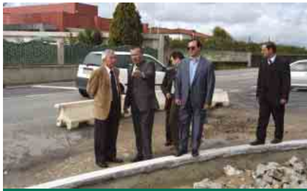
Novos acessos no Louro com a duplicação da Linha do Minho