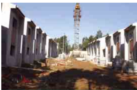
FRADELLOS Construção da Urbanização de Valdossos (45 fogos)