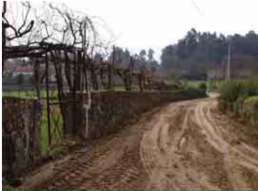
OLIVEIRA SANTA MARIA Reconstrução da Rua de Real