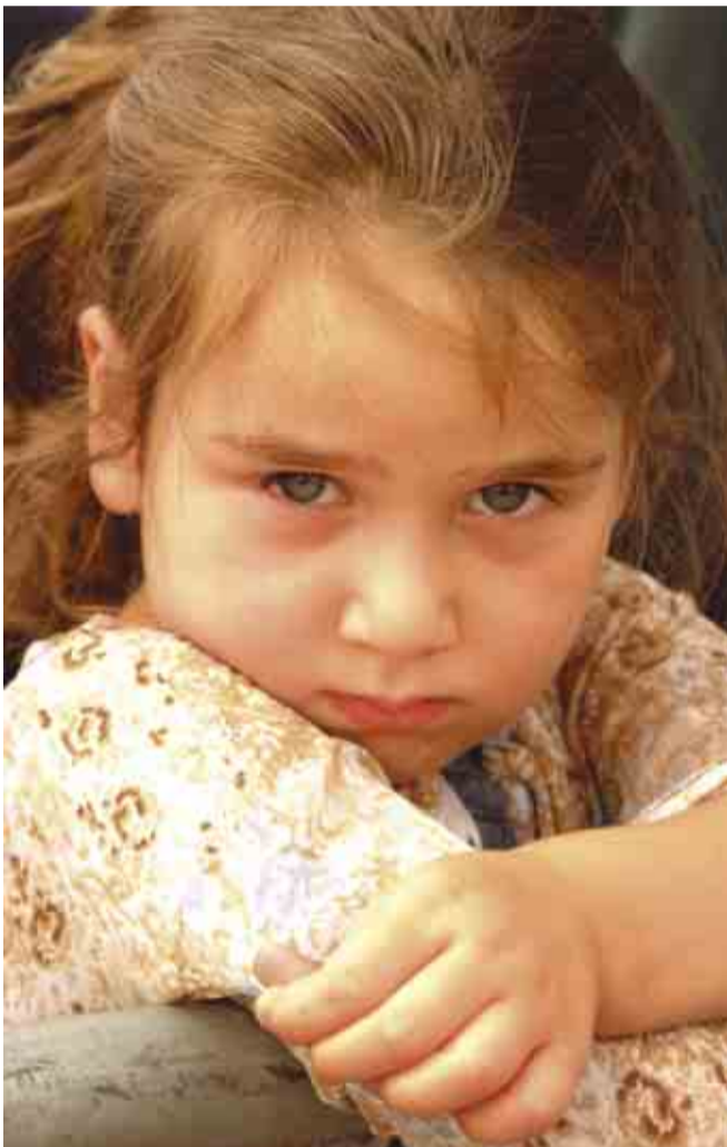
Feira Grande de S. Miguel, 29-09-2003