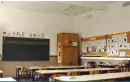
LOUSADO Beneficiação da Escola Básica da Serra