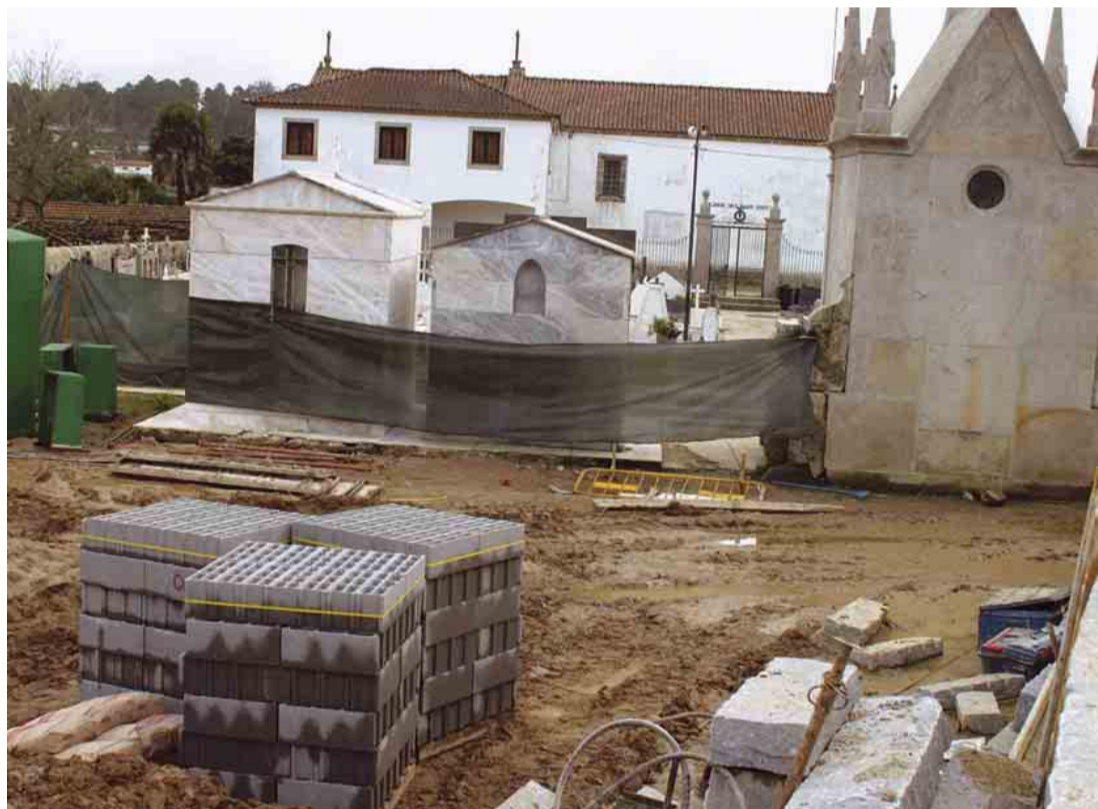
MOUQUIM Ampliação do cemitério paroquial