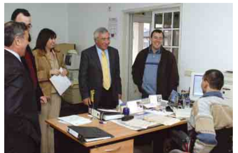
Boa disposição na visita às instalações da Junta de Freguesia

Visivelmente satisfeito com o iminente avanço da obra, o pre-