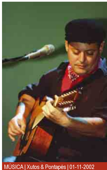
MÚSICA | Xutos & Pontapés | 01-11-2002