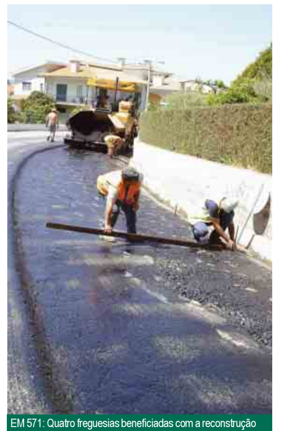
EM 571: Quatro freguesias beneficiadas com a reconstrução

Para melhor regularização de trânsito, serão criadas duas rotundas em dois cruzamentos de alta densidade de tráfego, sendo uma em Mouquim e a outra na freguesia de Nine. Junto à Igreja Paroquial de Mouquim será criado um parque de estacionamento, de forma a aproveitar o espaço existente. Está também prevista a criação de passadeiras para peões, em locais a indicar pelas quatro Juntas de Freguesia abrangidas pelo traçado da EM 571-2.