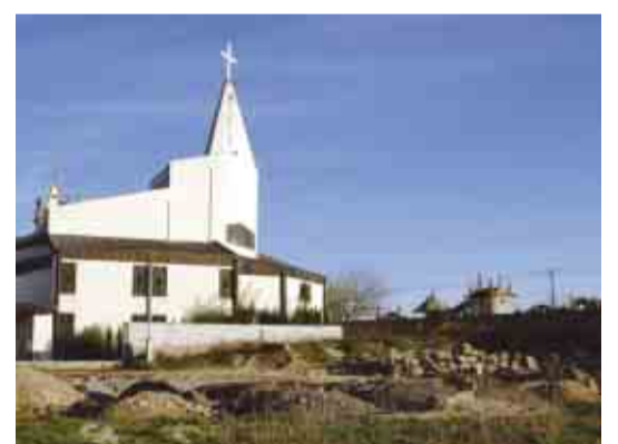
BRUFE Ampliação do Cemitério