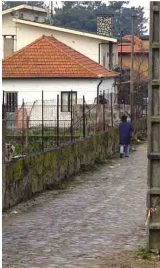
BAIRRO Alargamento da Rua da Beleza