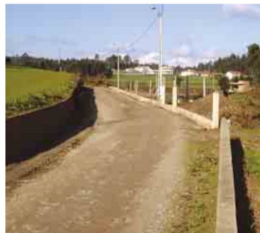
VILARINHO DAS CAMBAS Alargamento e pavimentação da Rua da Funtela