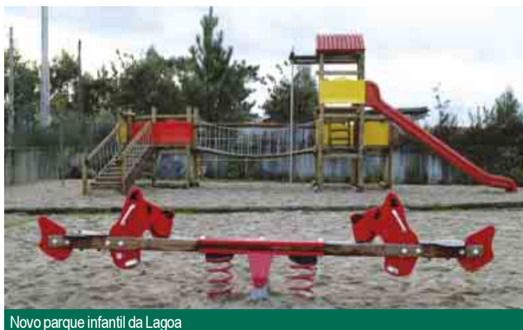
Novo parque infantil da Lagoa

Aqui, o Presidente da Câmara sugeriu uma acção que vá ao encontro dos dois problemas: “Vamos pensar na hipótese de dotar a freguesia de uma centralidade que não existe. Para isso teremos que disponibilizar terreno para construção na zona envolvente à igreja paroquial, salvaguardando áreas para a construção de futuras valências sociais para a freguesia, e estudaremos um arranjo urbanístico que leve em conta todos estes factores.”