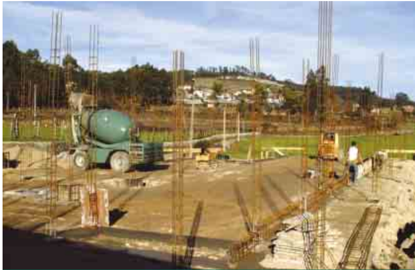
MOUQUIM Construção do Jardim-de-Infância