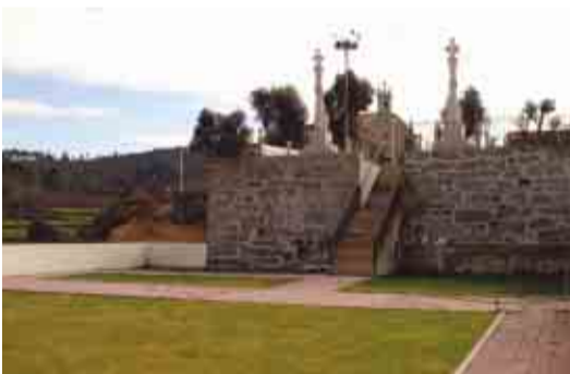
OUTIZ Ampliação do cemitério de Gemunde