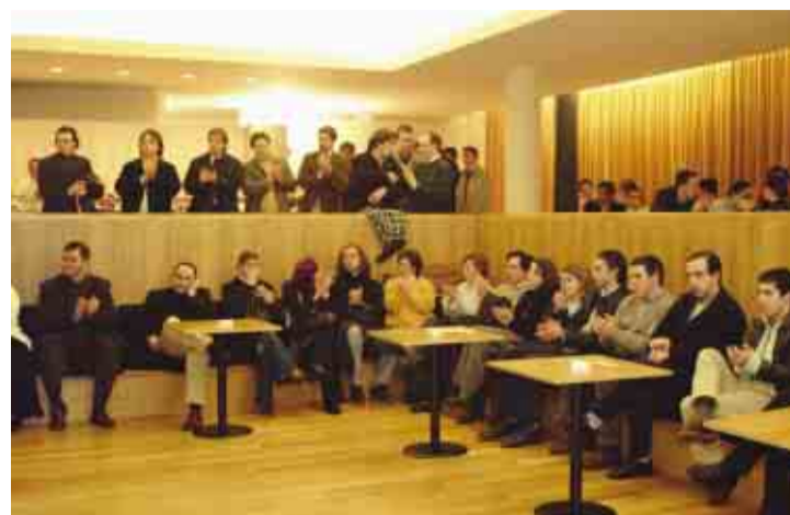
Tomada de posse do CMJ de Famalicão