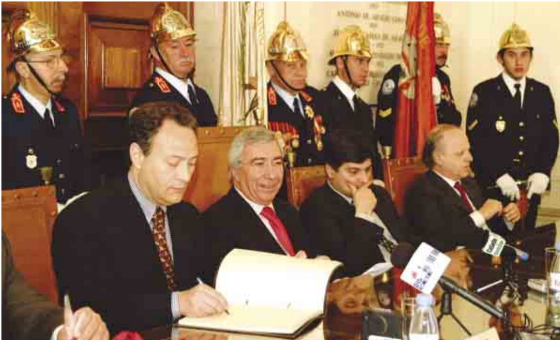
Secretário de Estado Adjunto do Ministro da Saúde deixou compromissos em Famalicão