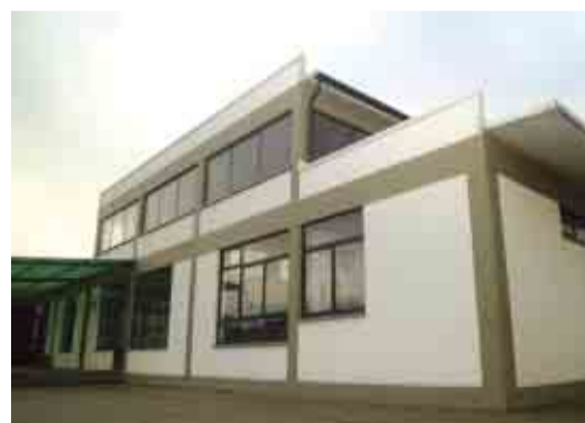
FRADELOS Reparação do edifício EB 1 do Sapugal