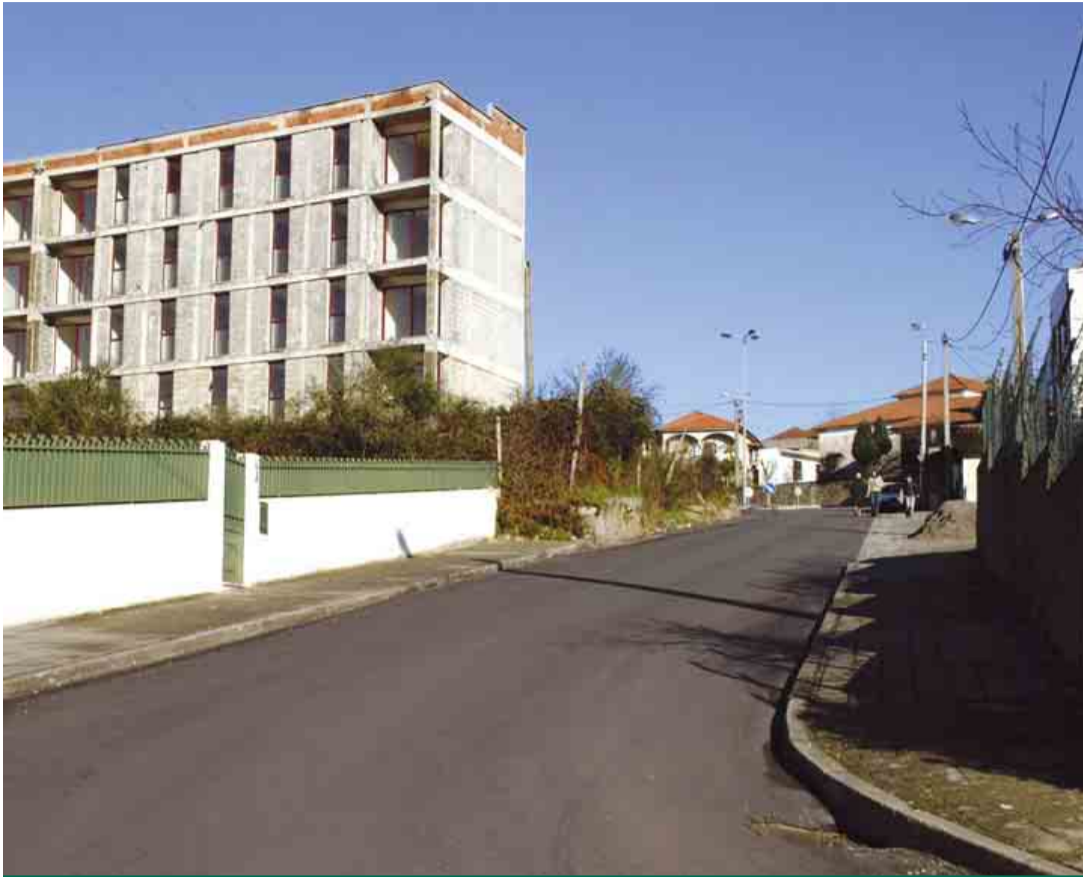
CALENDÁRIO Repavimentação da Rua Domingos da Costa Simões