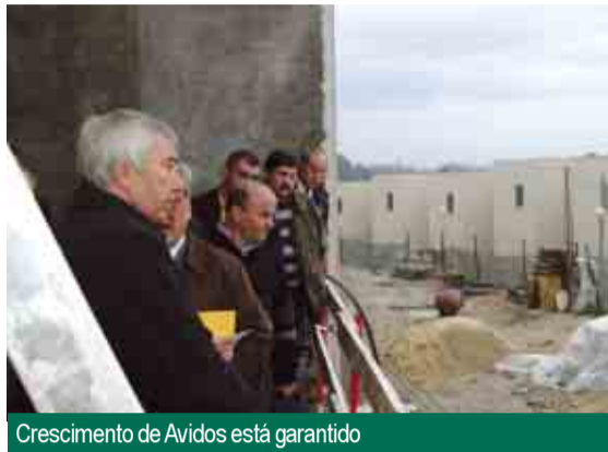
Crescimento de Avidos está garantido