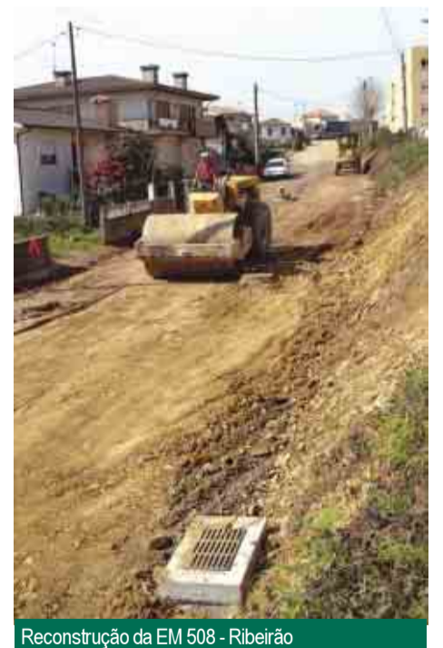
Reconstrução da EM 508 - Ribeirão

“A luta diariamente travada na desburocratização dos serviços, o incessante esforço despendido na melhoria da qualidade e aumento de eficácia dos serviços prestados à população, a assumpção plena das obrigações da autarquia, aliada à motivação incutida nos funcionários camarários resultou em taxas de produtividade claramente superiores aos últimos anos.”