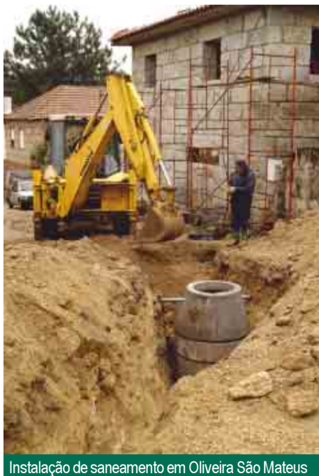
Instalação de saneamento em Oliveira São Mateus

“A promoção do investimento público, criterioso e atravessando todas as áreas da governação autárquica, está