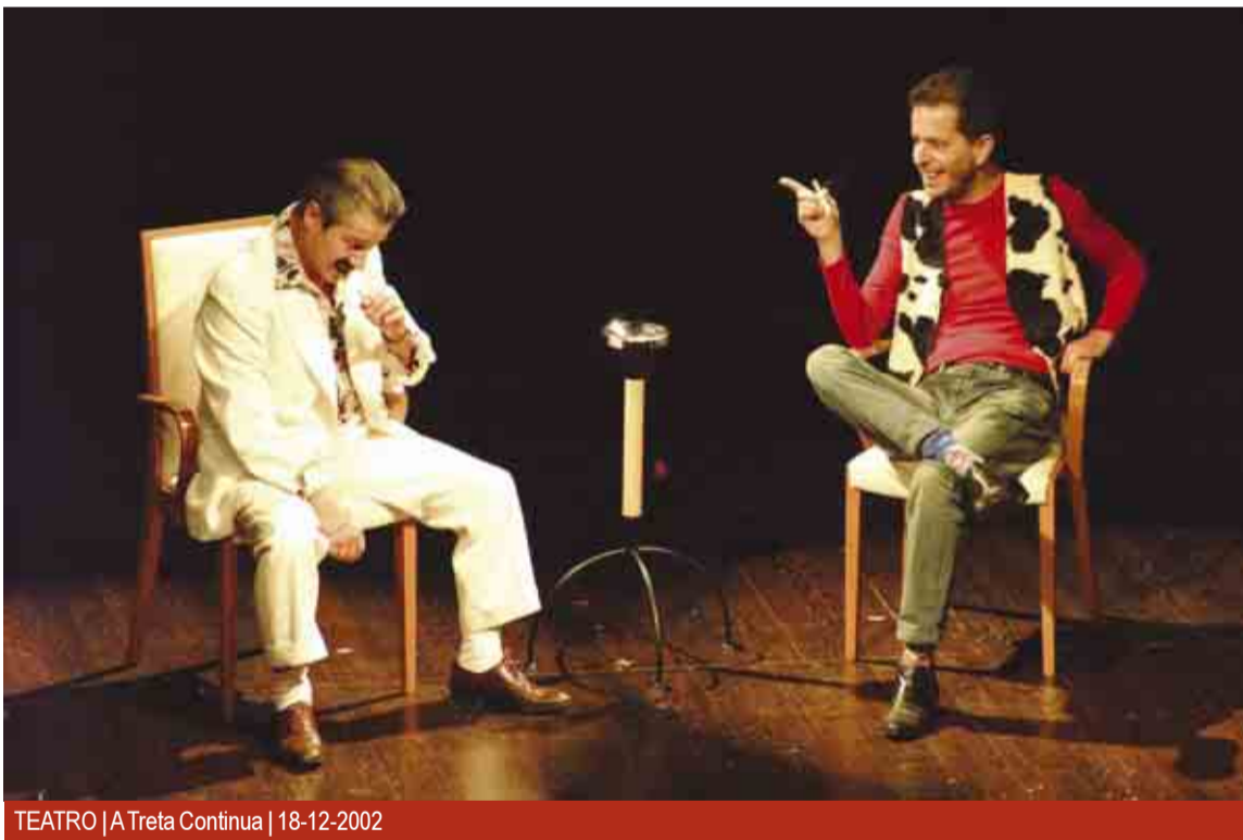
TEATRO | A Treta Continua | 18-12-2002