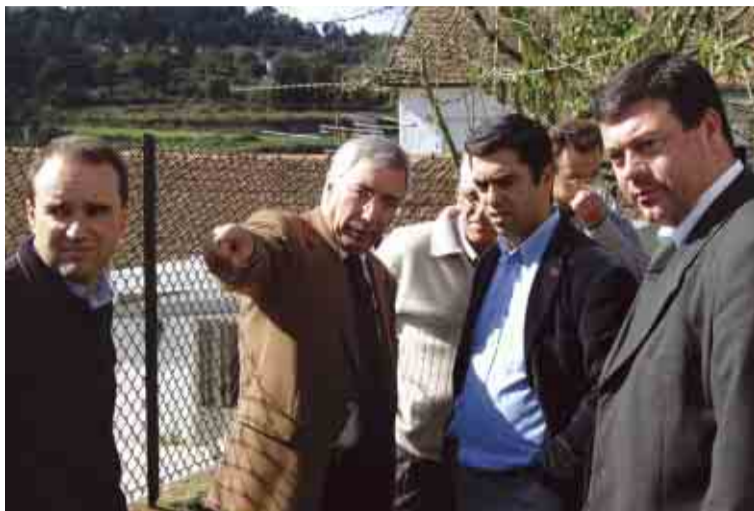
Autarcas apontam caminhos para a freguesia

Além destas, a Câmara Municipal e a Junta de Freguesia executaram recentemente duas intervenções importantes na freguesia. Na Urbanização Quinta de Pereira, mais propriamente na Rua Dr. Nuno Álvares Pereira, decorreram as obras de pavimentação, alargamento, construção de passeios e implementação da rede de saneamento e águas pluviais, num investimento total de cerca de 102 mil euros. Já na Rua de Pirre efectuaram-se as obras de rectificação e pavimentação daquela artéria, com uma