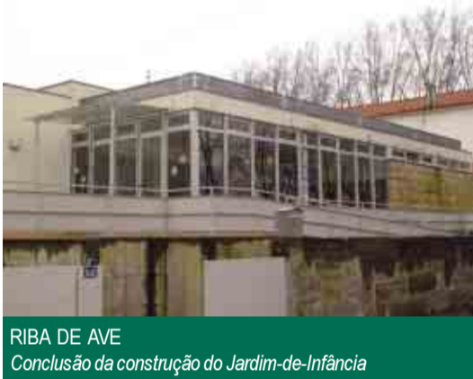
RIBA DE AVE Conclusão da construção do Jardim-de-Infância