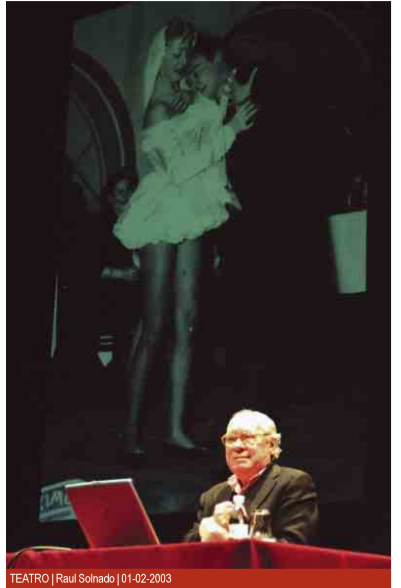
TEATRO | Raul Solnado | 01-02-2003