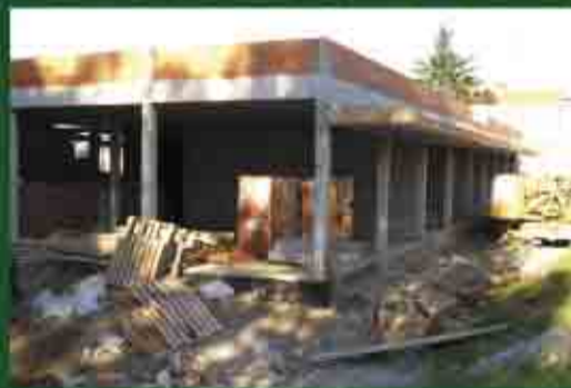
AVIDOS INVESTIMENTO: 230.404,13€ (+IVA) - 46.192.482$