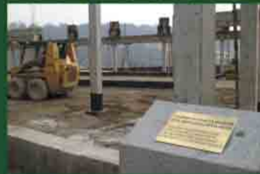
MOUQUIM INVESTIMENTO: 248.146,01€ (+IVA) - 49.748.808$