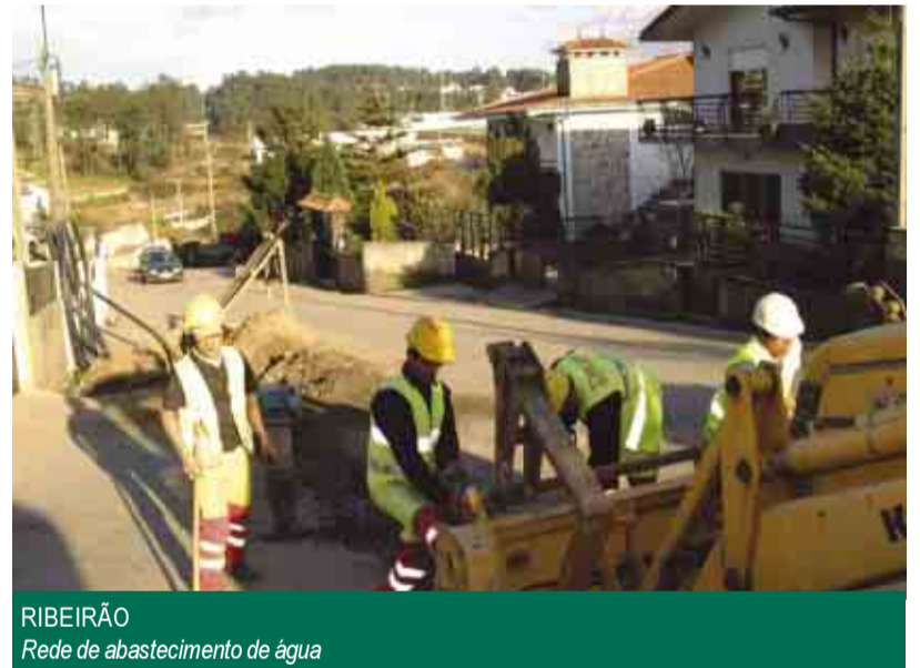
RIBEIRÃO Rede de abastecimento de água