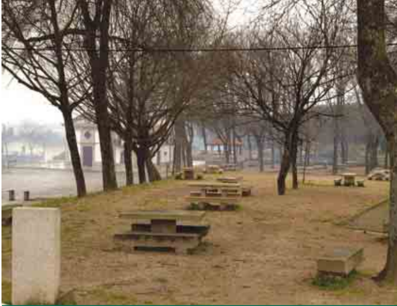
SÃO TIAGO DA CRUZ Arranjo urbanístico do Largo do Senhor dos Aflitos