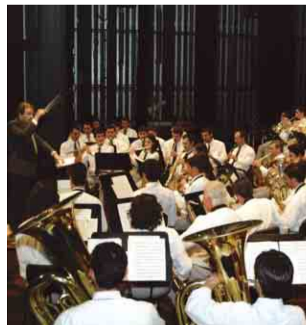
MÚSICA | Banda de Famalicão | 06-12-2002