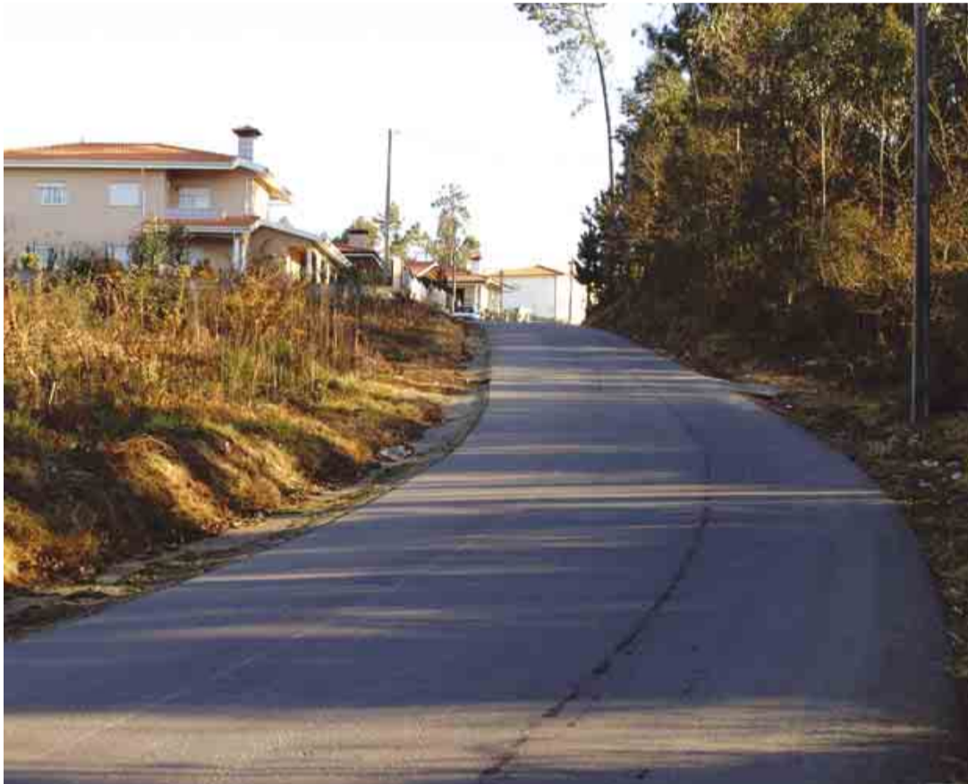
LAGOA Pavimentação da Avenida dos Lamosos