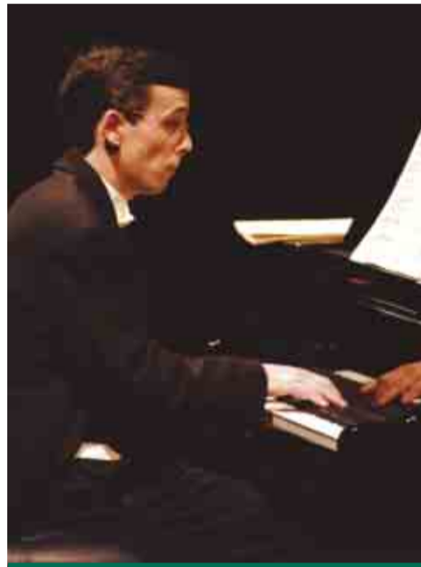
Casa das Artes, 28-11-2002