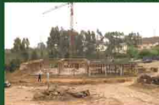
CALENDÁRIO (LAGE) INVESTIMENTO: 324.487,62€ (+IVA) - 65.083.927$

Praça Álvaro Marques 4764-502 Vila Nova de Famalicão Telefone 252 320900 Fax 252 312849 E-mail: camaramunicipal@cm-vnfamalicao.pt Internet: www.cm-vnfamalicao.pt