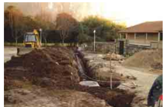
LANDIM Revitalização da Alameda do Mosteiro