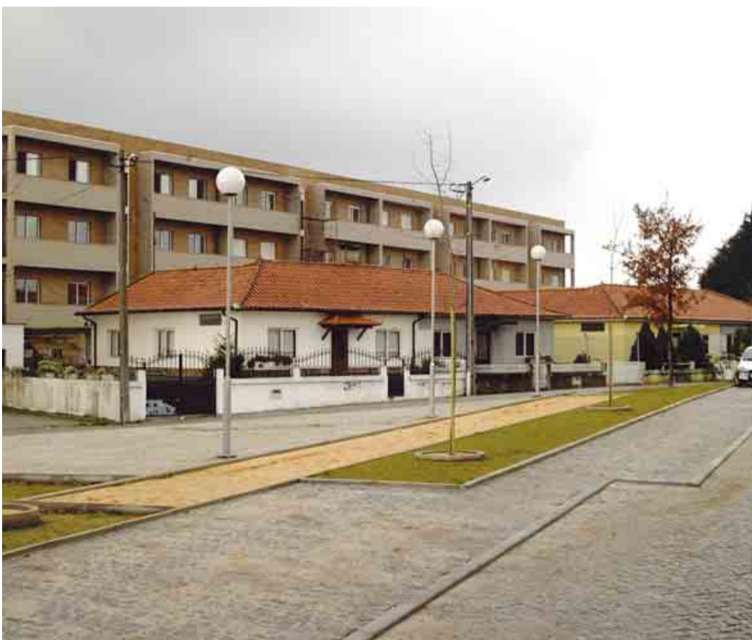
DELÃES Reabilitação do Largo dos Carvalhos