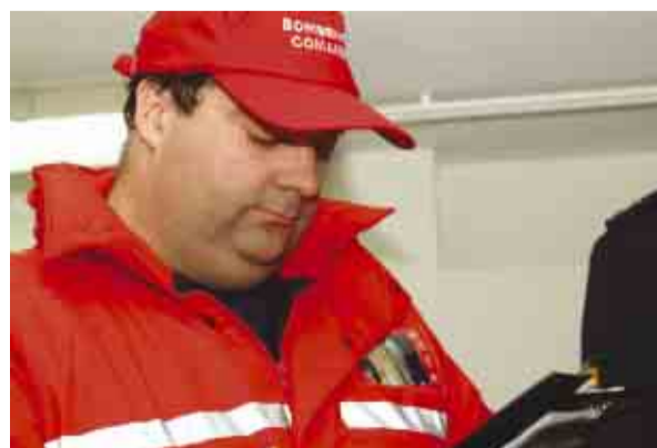
Vila Nova de Famalicão, 1-12-2002