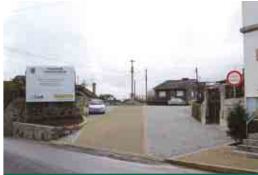
ANTAS Arranjo da zona envolvente do Largo do Cruzeiro