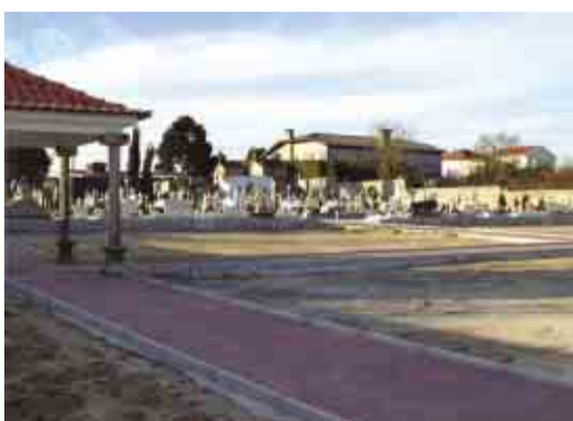
LOURO Rectificação e pavimentação da Rua Nª Senhora de Fátima