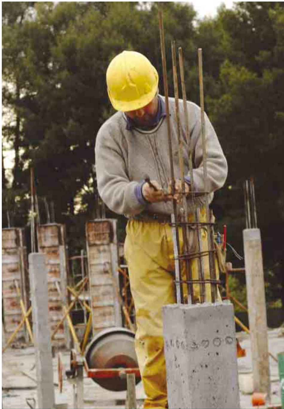
Obras de construção do Jardim-de-Infância de Avidos