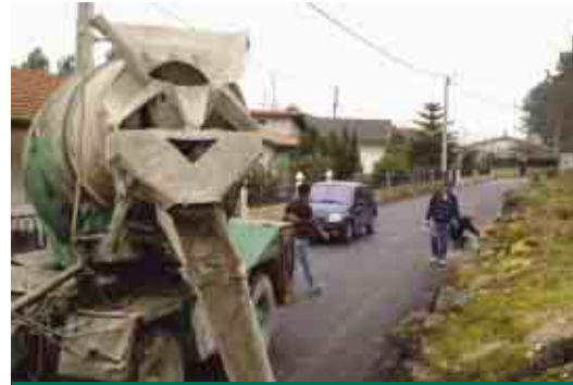
CARREIRA Pavimentação da Rua de Andorinhas e de Lamas