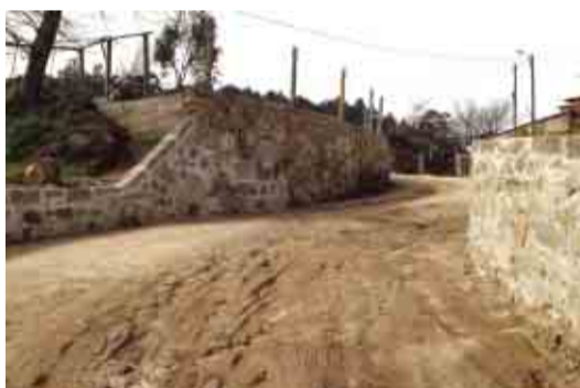
AVIDOS Alargamento e rectificação do Caminho Municipal 1510