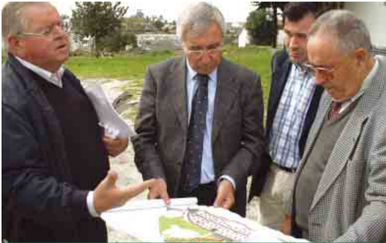
Projectos para Ruivães em análise