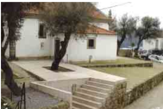
CAVALÕES Reabilitação da área envolvente à Capela de S. Gonçalo