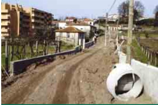
GAVIÃO Alargamento do CM S. Fins (Gavião - Requião)