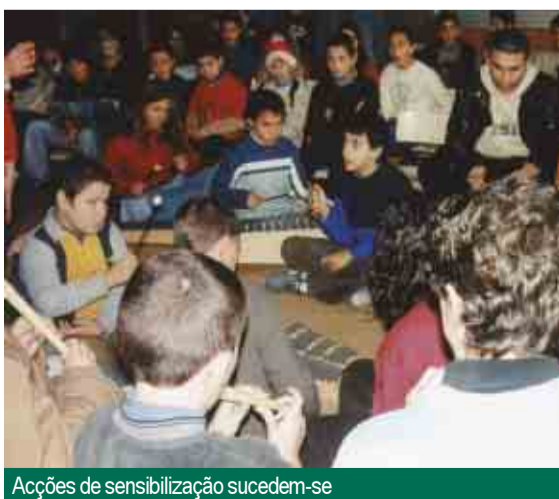
Acções de sensibilização sucedem-se