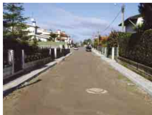
ESMERIZ Água, saneamento e pavimentação Rua D. Nuno A. Pereira