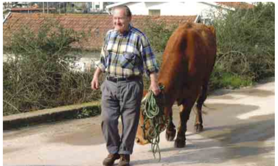
S. Cosme do Vale, 13-02-2003