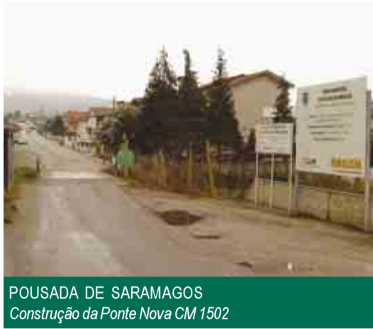
POUSADA DE SARAMAGOS Construção da Ponte Nova CM 1502