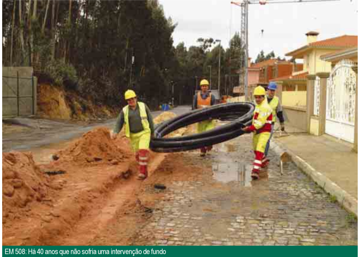
EM 508: Há 40 anos que não sofria uma intervenção de fundo