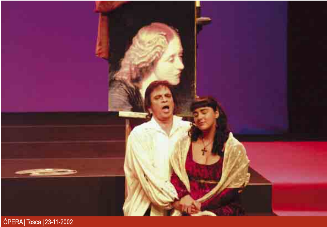
ÓPERA | Tosca | 23-11-2002