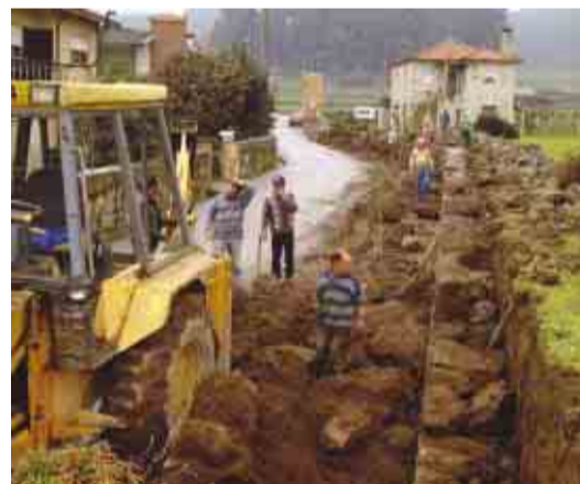
VERMOIM Alargamento e pavimentação do CM 1504