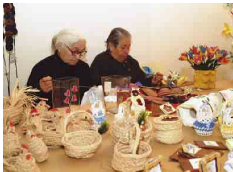
Trabalho ao vivo enriqueceu iniciativa

A encenação da peça acabou por ser o pretexto para uma jornada de confraternização entre os idosos de diversas instituições de solidariedade social do município, que viveram grandes momentos de animação, sobretudo quando o grupo que integra o programa municipal de desporto para a terceira idade interpretou uma série de números de dança e canto.