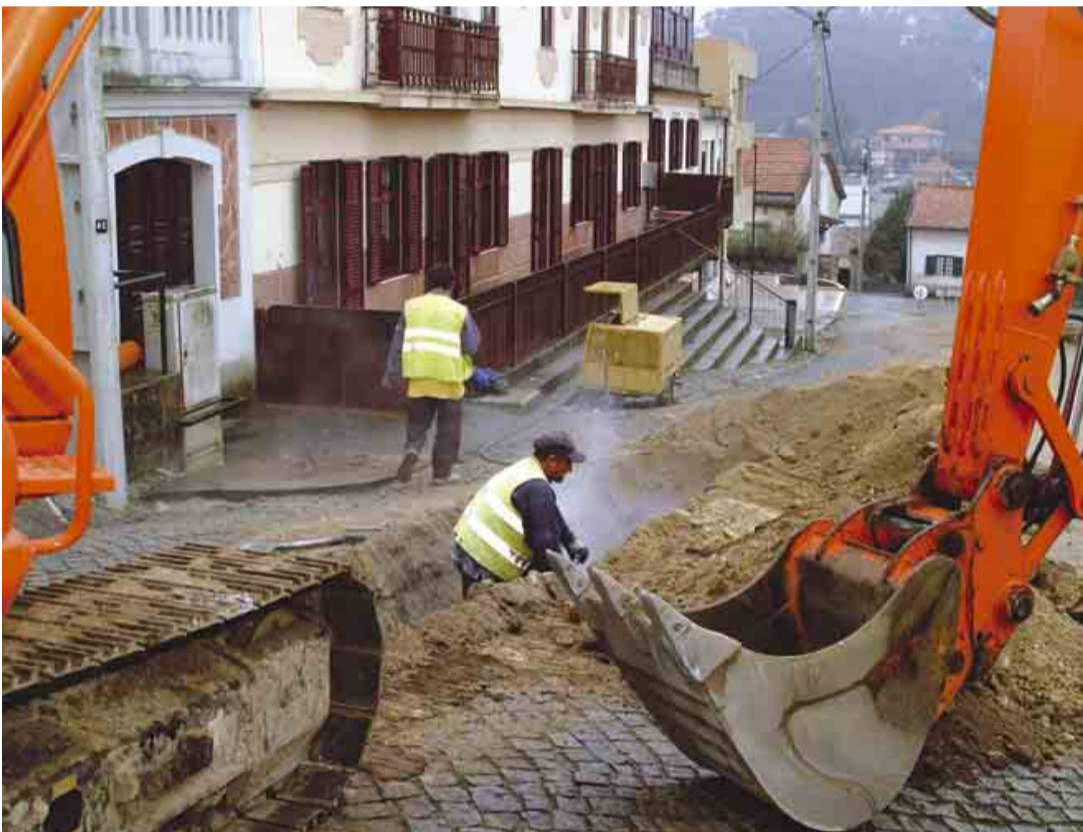
OLIVEIRA SÃO MATEUS Obras de saneamento