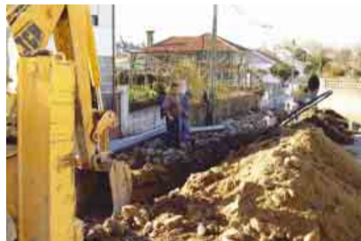
CEIDE SÃO MIGUEL Infraestruturas de água e saneamento na Rua Manuel Alves