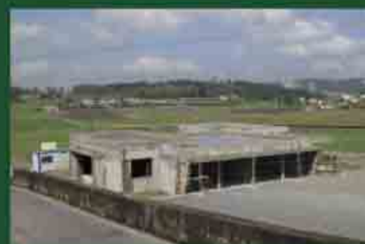
REQUIÃO INVESTIMENTO: 211.072,44€ (+IVA) - 42.316.224$