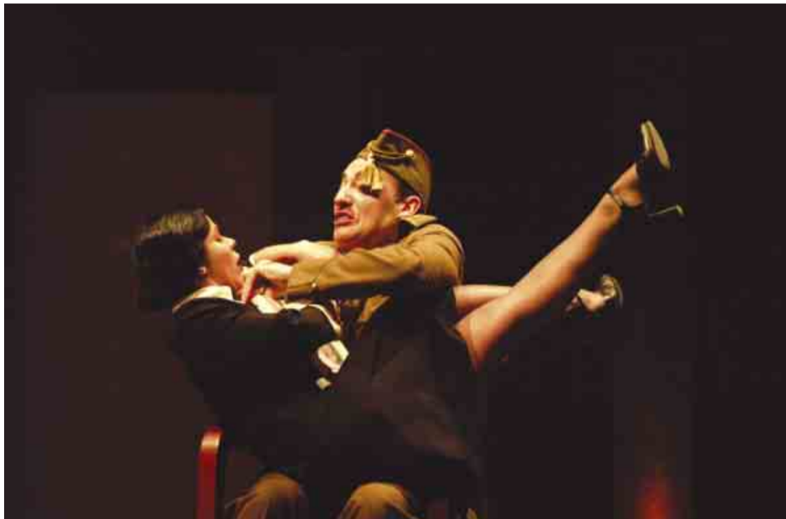
TEATRO | Franczarinas | 25-01-2003

A CASA das Artes de Vila Nova de Famalicão é hoje uma das principais referências artístico-culturais de Portugal. Um ano depois de a Câmara Municipal ter arrancado com a disponibilização de uma programação cultural mensal diversificada e de elevada qualidade, o sucesso é contundente. Pelos palcos da Casa das Artes já desfilaram destacadas figuras nacionais e internacionais do mundo da arte e da cultura. A presenciar os muitos espectáculos promovidos estiveram muitos milhares de pessoas, desde famalicenses a lisboetas, até portuenses e galegos. A aposta da Câmara numa verdadeira política de democratização cultural é para manter. A Casa das Artes continuará com uma programação diversificada, direccionada para actividades e públicos variados.