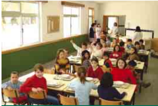
ABADE DE VERMOIM Construção da cantina da Escola da Igreja