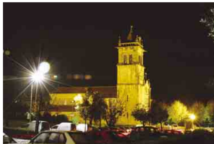
Património histórico valorizado