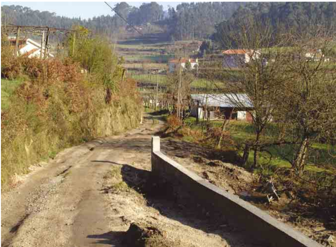
TELHADO Alargamento e pavimentação da Rua do Ribeirinho