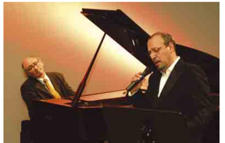
MÚSICA | António Vitorino d'Almeida e Carlos Mendes | 19-02-2003