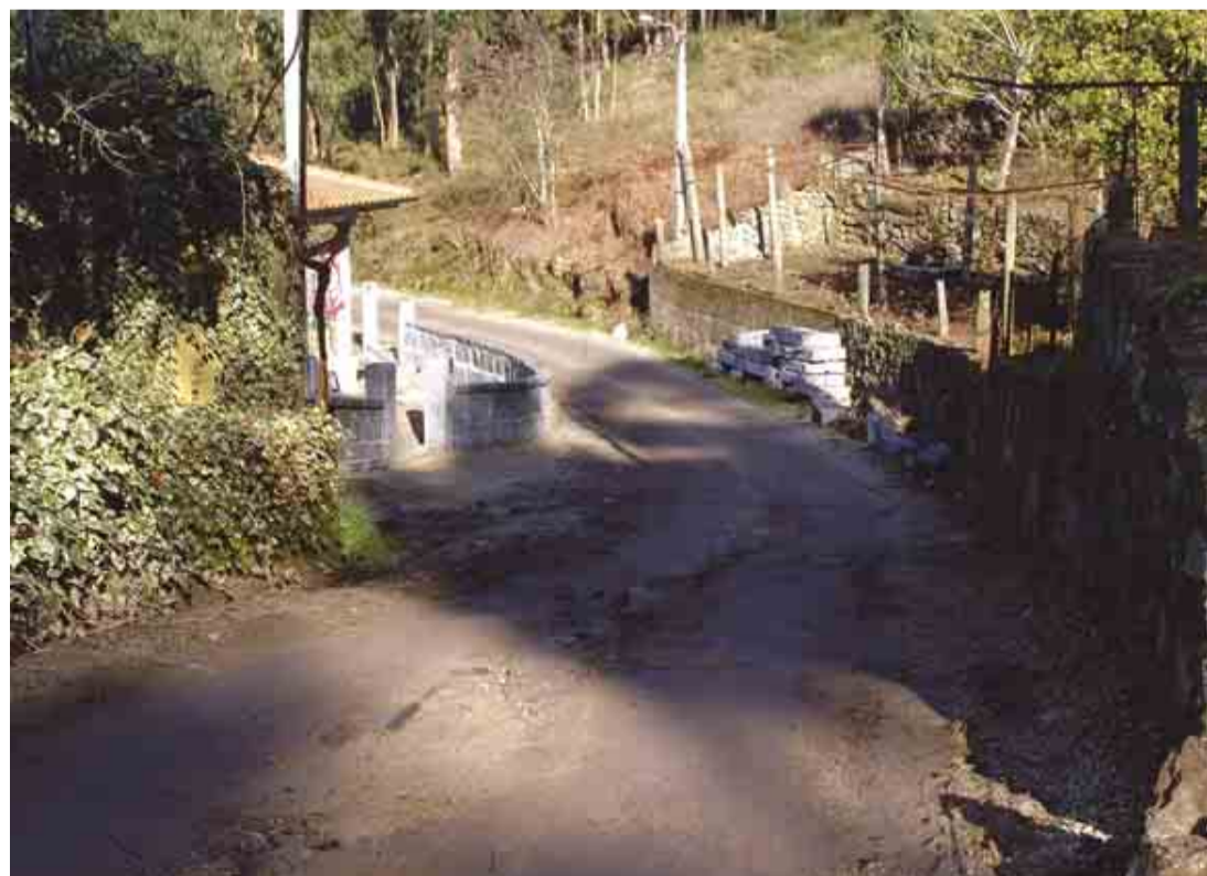
PORTELA Alargamento do caminho da Presa, do Bico e Calvário