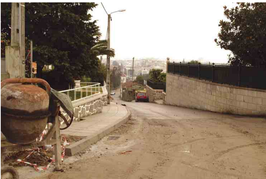
VILA NOVA DE FAMILIÇÃO Construção de passeios e pavimentação da Rua do Príncipe Real