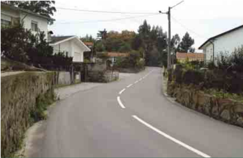
MOGEGE Pavimentação da Estrada Municipal 574-2 (Joane - Mogege)