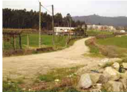
CASTELÕES Alargamento da Rua do Rio