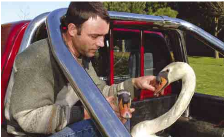
Parque de Sinções, 14-02-2003