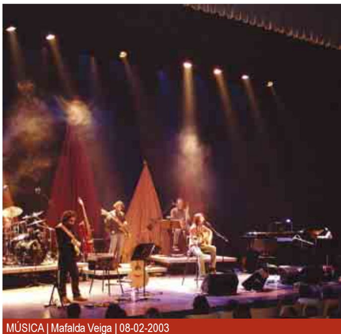
MÚSICA | Mafalda Veiga | 08-02-2003