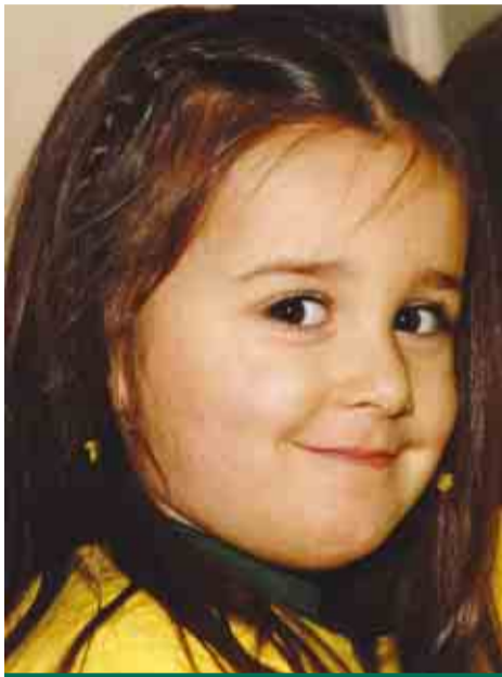
Externato Delfim Ferreira, 13-12-2002

Em cada edição do BOLETIM MUNICIPAL vamos mostrar rostos de Famalicense captados nos diversos momentos da vida pública do Município. Indicamos ainda a data e o lugar em que a fotografia foi registada. Cada rosto é um bocadinho da identidade de Vila Nova de Famalicão. São crianças, jovens e adultos. Todos juntos fazem o concelho que somos. Um grande concelho.