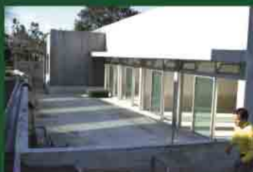
BENTE INVESTIMENTO: 201.211,77€ (+IVA) - 40.339.338$