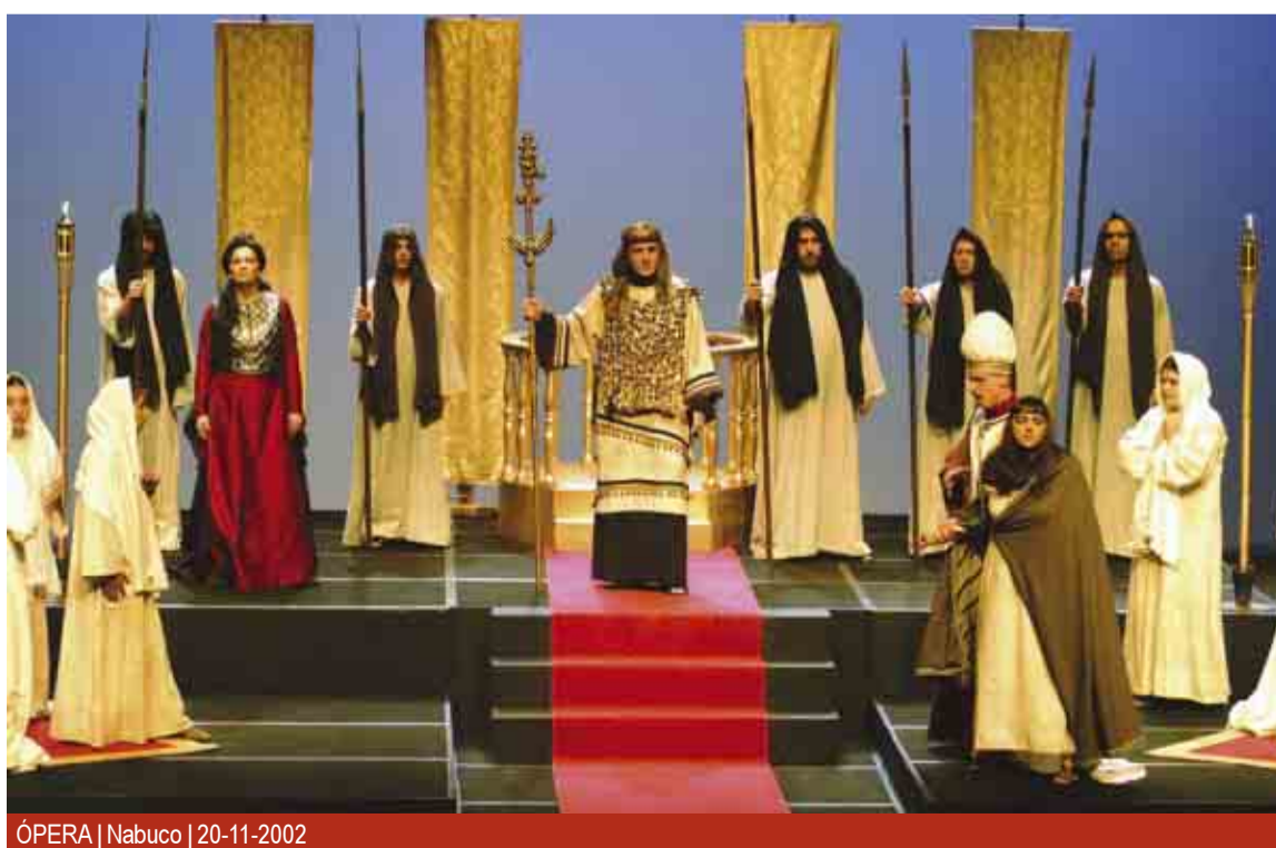
ÓPERA | Nabuco | 20-11-2002