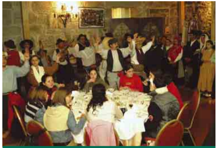
Animação dos restaurantes foi uma constante