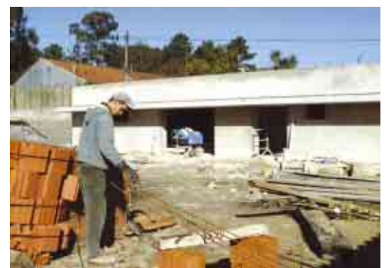
CABEÇUDOS Construção da cantina escolar da EB 1º Ciclo do Souto