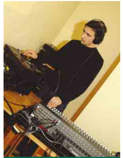
Casa das Artes, 8-01-2003