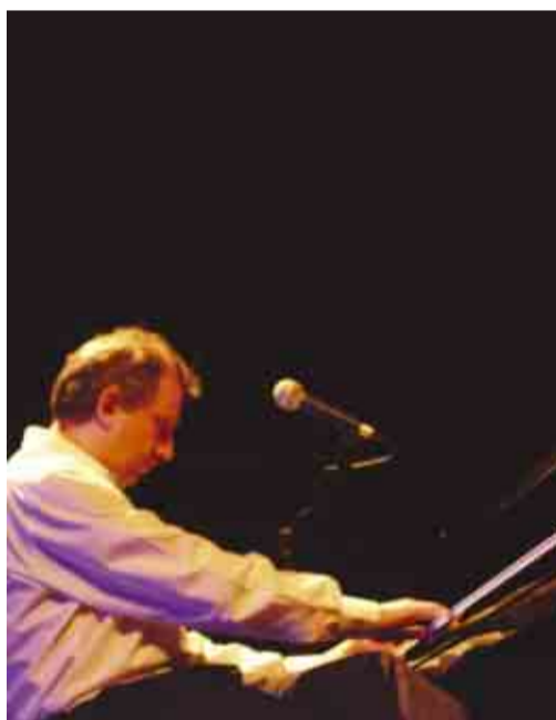
MÚSICA | Wim Mertens | 03-12-2002