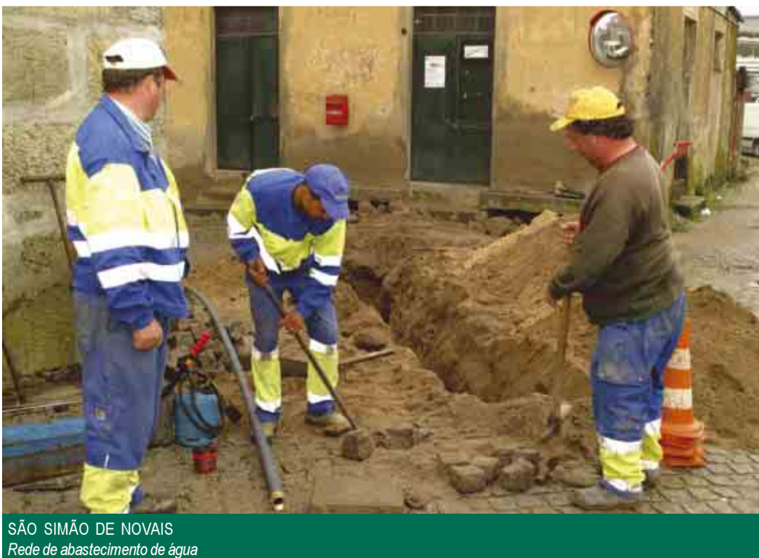
SÃO SIMÃO DE NOAIS Rede de abastecimento de água