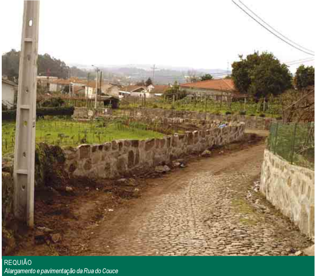
REQUIÃO Alargamento e pavimentação da Rua do Couce