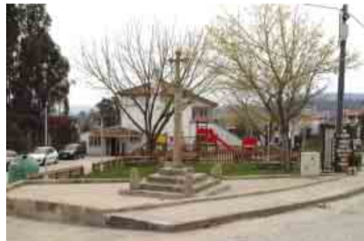
NINE Arranjo urbanístico do Largo da Casa do Povo