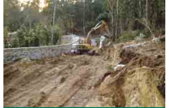
JESUFREI Alargamento e pavimentação da Rua de Pousada / CM 1782