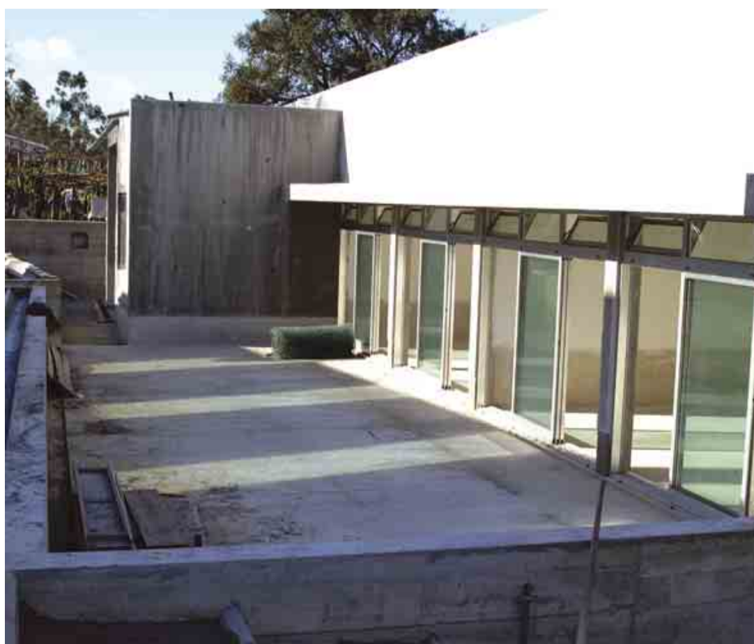
BENTE Construção do Jardim-de-Infância