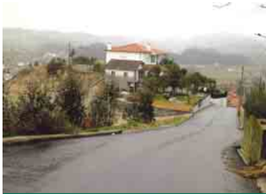
ARNOSO SANTA MARIA Alargamento e pavimentação da Rua Alto de Quintela