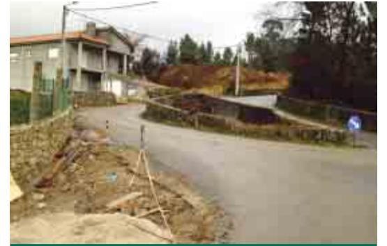
ARNOSO SANTA EULÁLIA Alargamento da Estrada da Minhoteira