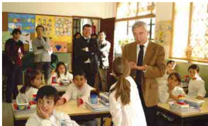
Boas novas de Armindo rasgaram sorrisos nas crianças

A EDUCAÇÃO foi também um dos temas centrais da visita de Armindo Costa a Esmeriz, tendo o Presidente da Câmara respondendo positivamente às pretensões do autarca da freguesia, Jorge Silva, e, anunciando o avanço das obras de construção da cantina escolar e ATL da Escola do 1º Ciclo de S. Marçal, de modo a ficar operacional no próximo ano lectivo, ficando liberta parte da sede da Junta de Freguesia, onde actualmente estão a funcionar estas valências. Recorde-se que, em Setembro de 2002, Armindo Costa lançou a primeira pedra do futuro Jardim-de-Infância da freguesia, num investimento de 203 mil euros (mais de 40 mil contos), que deverá estar pronto a receber os primeiros alunos, já no próximo ano lectivo de 2003/2004.