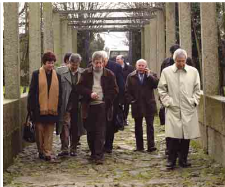
Representantes da Associação das Terras Camilianas em Ceide

Projecto de valorização da Casa-Museu Camilo Castelo Branco: 4.050.241,19 euros