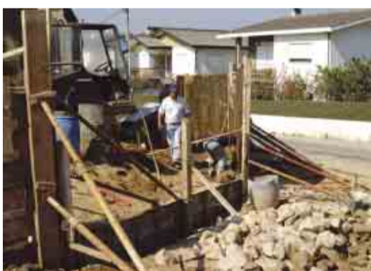
LEMENHE Alargamento da Rua da Vinha