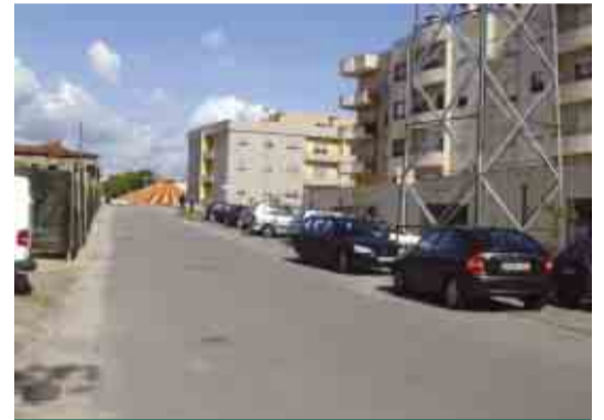
JOANE Rectificação e pavimentação da Rua de S. Bento