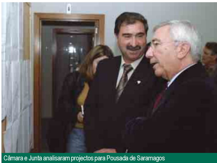
Câmara e Junta analisaram projectos para Pousada de Saramagos

O auto de consignação da empreitada foi referenciado pelo presidente da Junta de