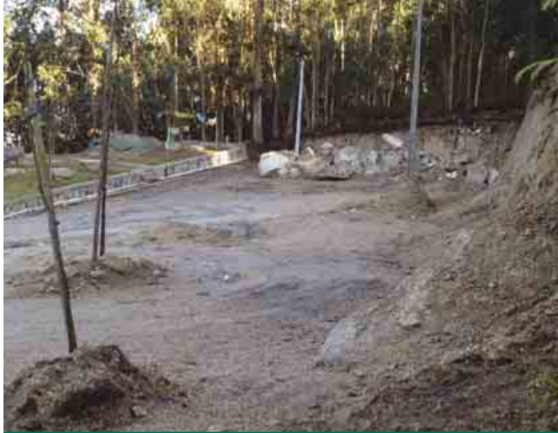
SEZURES Alargamento e pavimentação da rua de acesso à Capela de São Vicente