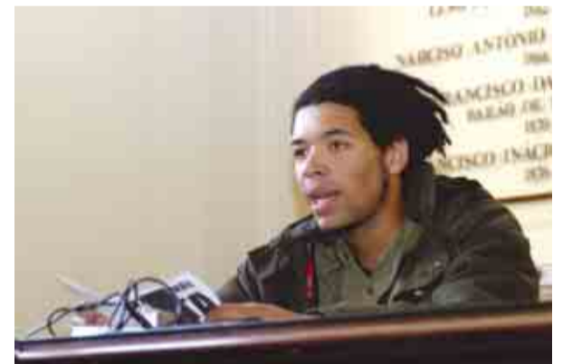
Paços do Concelho, 28-11-2002