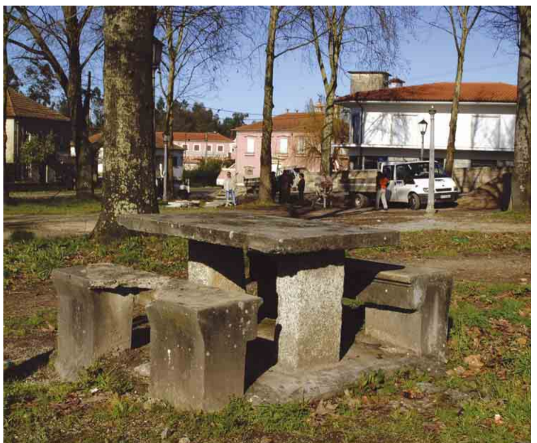
LOUSADO Arranjo urbanístico do Largo do Souto