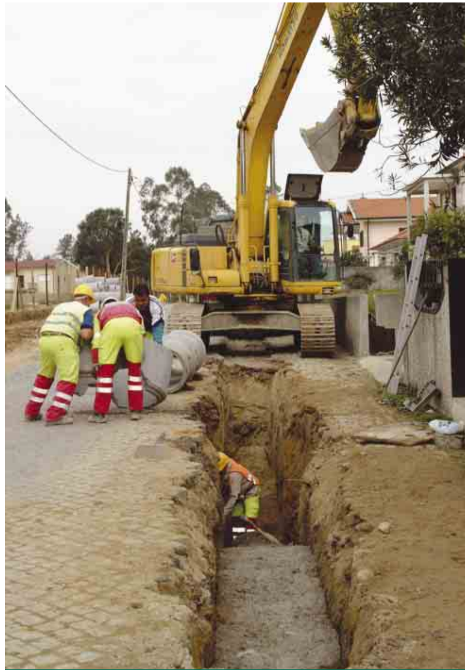
Reconstrução da Estrada Municipal Antas - Ceide S. Miguel