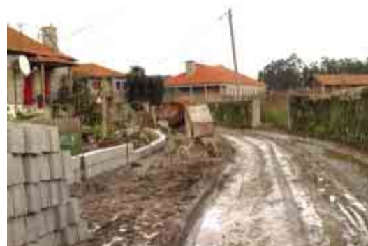
CEIDE SÃO PAIO Rectificação e pavimentação do CM 1509