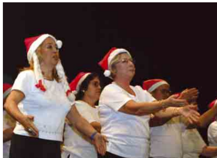
Momentos de animação entre os seniores do concelho