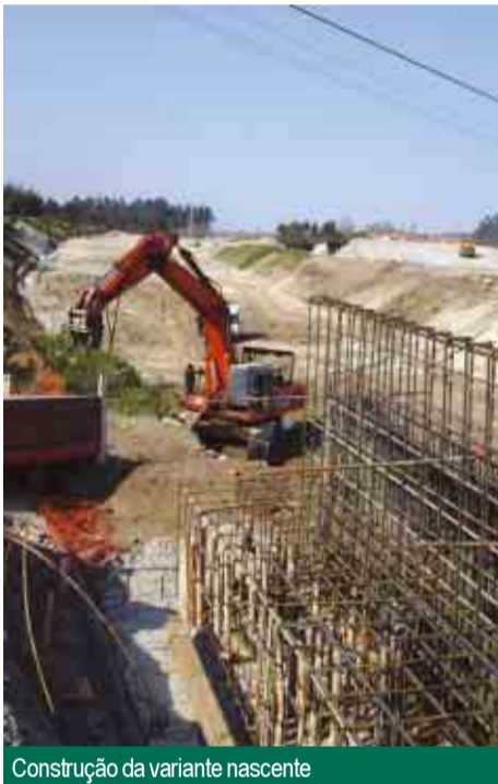
Construção da variante nascente

“A enorme dívida herdada e que em 1 de Janeiro de 2002 ultrapassava os 57 milhões e oitocentos mil euros (mais de 11 milhões e quinhentos mil contos), foi até 31 de Dezembro de 2003, drasticamente reduzida para 45 milhões e oitocentos mil euros, ou seja, (uma redução de 2 milhões e quatrocentos mil contos).”