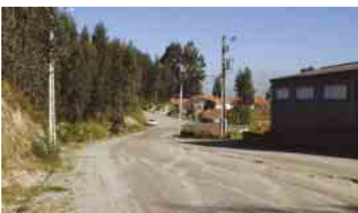
PEDOME Rectificação e pavimentação da Rua das Flores