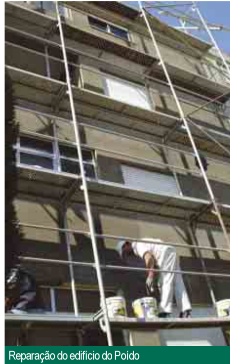
Reparação do edifício do Poído

a transformar Vila Nova de Famalicão, num concelho mais desenvolvido, com melhor qualidade de vida, mais justo, mais livre e mais solidário.”