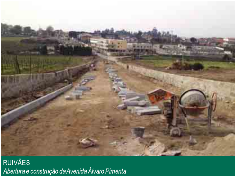
RUIVÃES Abertura e construção da Avenida Álvaro Pimenta