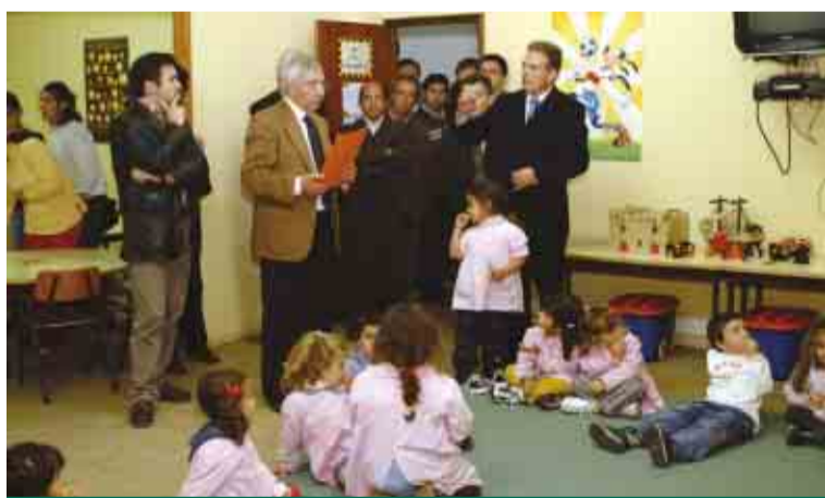
Visita ao Jardim-de-Infância da Igreja

CABEÇUDOS vai ter um novo Jardim-de-Infância e uma escola básica renovada, com um espaço de actividades de tempos livres (ATL) e um refeitório escolar.