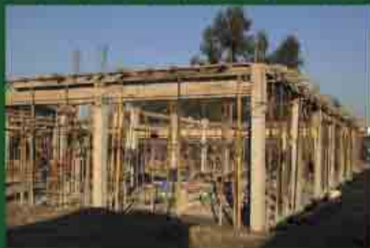
LAGOA INVESTIMENTO: 241.698,86€ (+IVA) - 48.456.270$