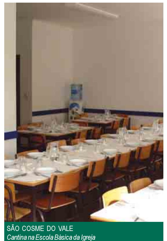
SÃO COSME DO VALE Cantina na Escola Básica da Igreja