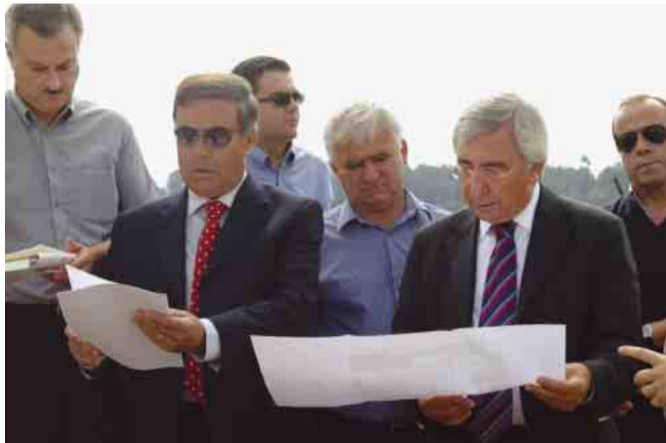
Autarcas analisam projectos para Mouquim