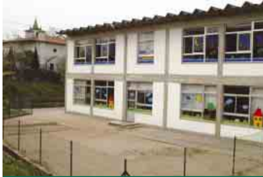
GONDIFELOS Adaptação do edifício EB para Pré-Primária