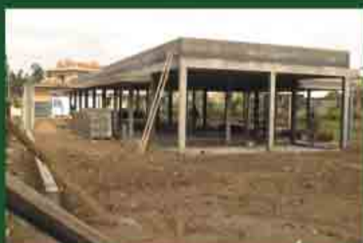
ESMERIZ INVESTIMENTO: 203.533,12€ (+IVA) - 40.804.726$