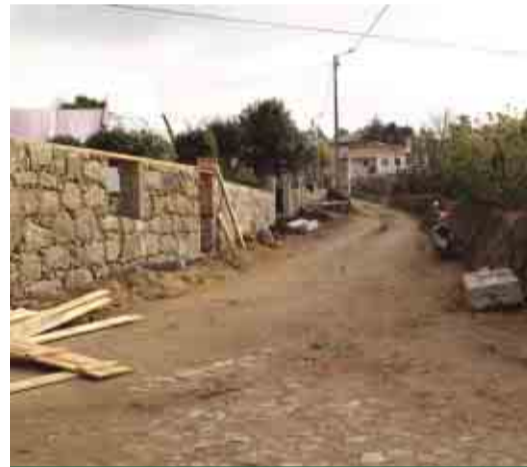
VALE SÃO MARTINHO Alargamento e pavimentação da Travessa da Escola