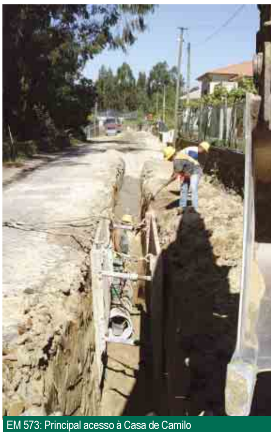
EM 573: Principal acesso à Casa de Camilo

A obras referentes à primeira fase da empreitada, ligando a cidade de Famalicão à futura variante nascente estão praticamente concluídas. Entretanto, a Câmara Municipal tem já em fase de lançamento a terceira fase da operação, que beneficiará o percurso entre Ceide S. Miguel e Ruivães, estando a ser preparado o processo relativo à quarta e última fase, que contemplará o circuito Ruivães-Oliveira S. Mateus.