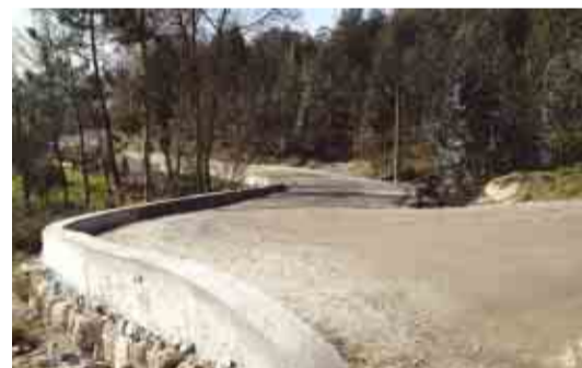
OLIVEIRA SANTA MARIA Alargamento e pavimentação da Rua da Aldeia Nova