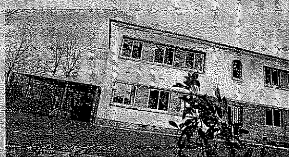
Escola de Riba d'Ave

O terceiro período vai começar em festa nas escolas básicas do 1.º ciclo de Conde S. Cosme e de Riba d'Ave. Cerca de 400 crianças vão inaugurar as "novas" escolas depois de obras profundas de reabilitação e ampliação.