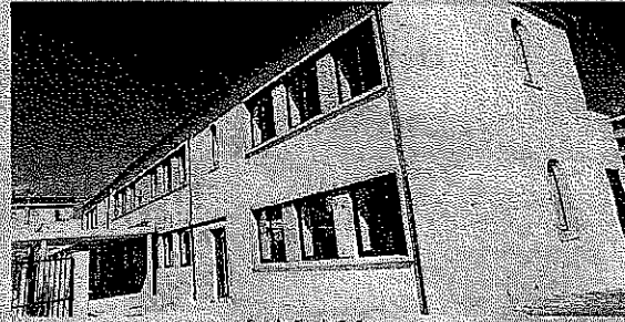
Escola Conde S. Cosme