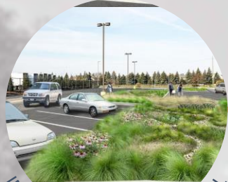
INTEGRAÇÃO DO AUTOMÓVEL