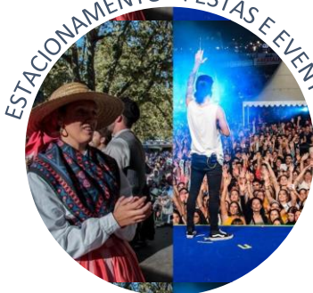
ESTACIONAMENTO - FESTAS E EVENTOS